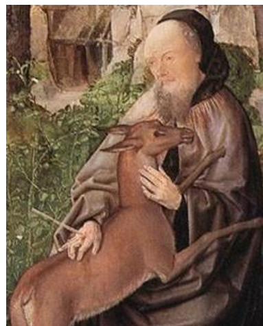
Svatý Jiljí Obr. I

Svatý Jiljí – latinsky Ægidius, německy Ägidius, anglicky Giles a italsky Egidio. Řecký mnich a poustevník jeden z nejznámějších středověkých světců, který se stal patronem Komunity. Komunita po něm převzala svůj název, hlavně proto, že se v kostele St. Egidio scházela. Avšak není to jen náhoda, že si vybrali pro svůj název právě tohoto mnicha. St. Egidio, jehož jméno se může také přeložit jako „ochránce“. Narodil se roku 640 v Aténách v Řecku. Vyrůstal jako syn, vznešených a zámožných rodičů, kteří byli také vzorní křesťané. Už od dětství