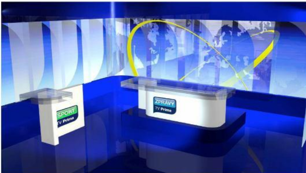
Příloha č. 5: Vizualizace studia zpráv a sportu z února 2008 (obrázek)