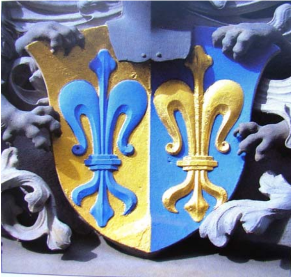
Obr. č. 3 Erb Fuggerů von der Lilie.