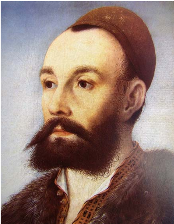
Obr. č. 4 Anton Fugger, autor Hans Maler (1525).