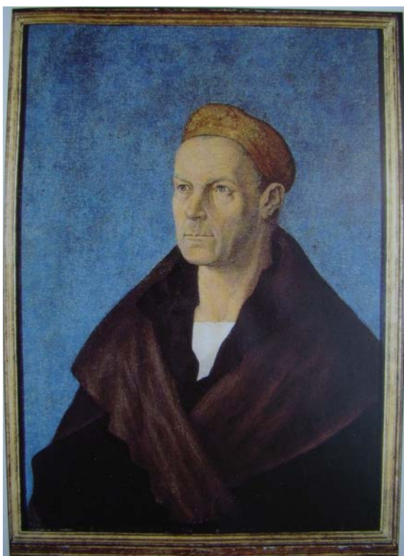
Obr. č. 2 Jakob Fugger Bohatý, autor Albrecht Dürer (1518).