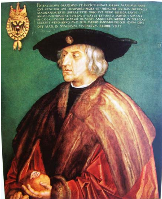
Obr. č. 5 Císař Maxmilián, autor Albrecht Dürer (1518).