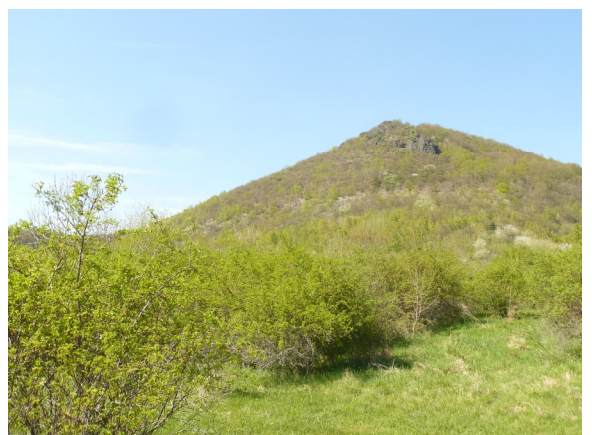
Obrázek 12 Zarůstající část bílé stráně pod Lipskou horou (plocha č. 60)