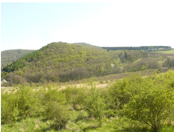
Obrázek 17 Opuštěná orná půda západně od Lhoty (plocha č. 27)