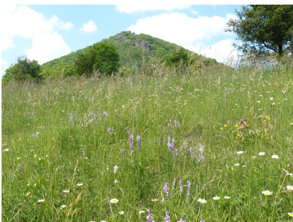
Obrázek 11 Bílá stráň pod Lipskou horou – udržovaná část