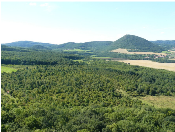
Obrázek 15 Rozsáhlý opuštěný ovocný sad pod Plešivcem (plocha č. 87)