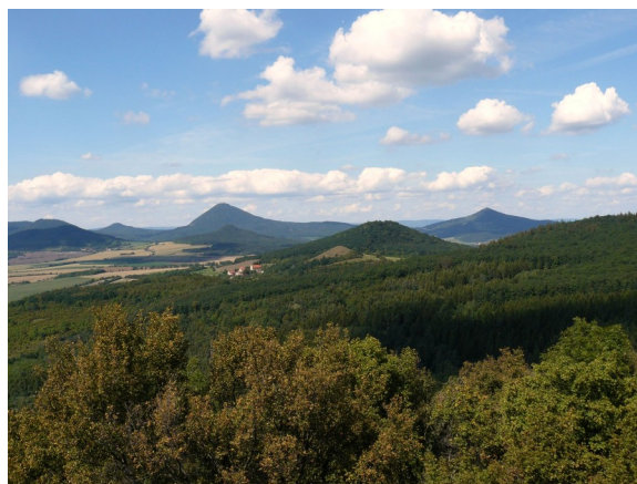
Obrázek 2 Pohled na Sutom z Košťálova