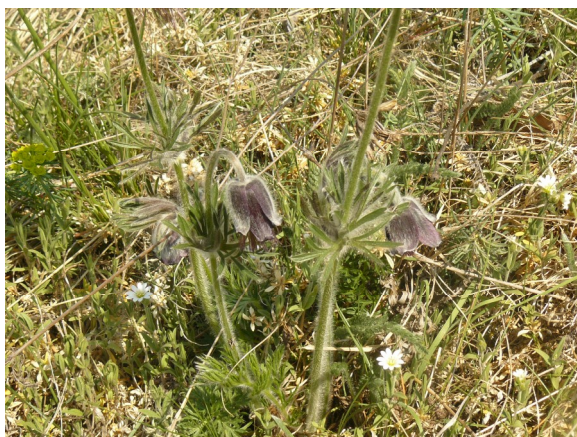
Obrázek 3 Koniklec luční český na Třešňovce