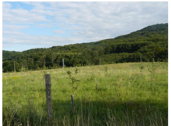
Obrázek 16 Nově vysazené ovocné sady u Milešova