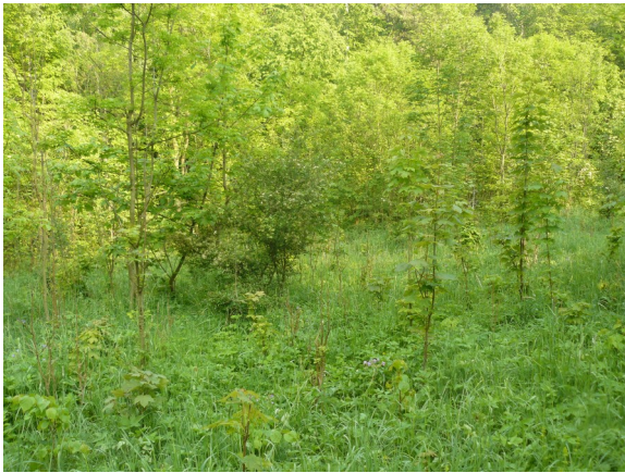
Obrázek 7 Zarůstající vlhká louka severně od Lipské hory (plocha č. 38)