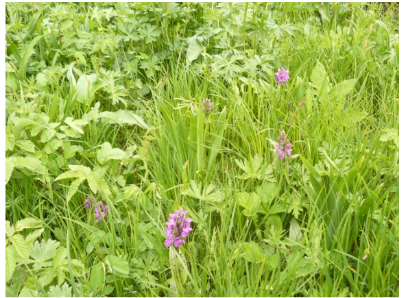
Obrázek 14 Prstnatec májový na vlhkých loukách u Lukova