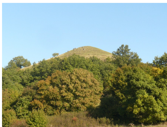
Obrázek 6 Holý vrch u Sutomi (plocha č. 75)