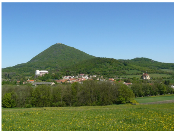
Obrázek 1 Milešov a Milešovka