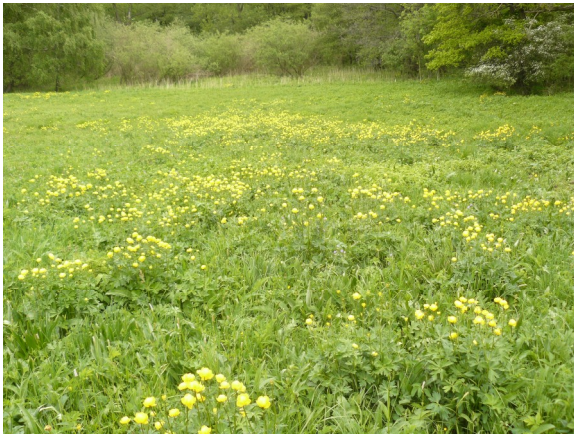
Obrázek 13 Upolín evropský na vlhkých loukách u Lukova