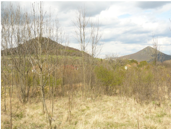
Obrázek 9 Opuštěné širokolisté suché trávníky u Borče (plocha č. 1)