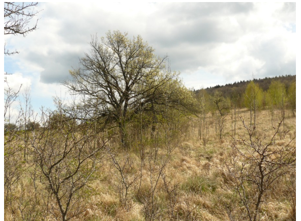
Obrázek 10 Staré ovocné stromy na opuštěných plochách u Borče (plocha č. 1)