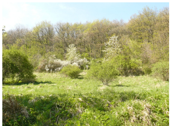
Obrázek 18 Opuštěné širokolisté suché trávníky západně od Lhoty (plocha č. 28)