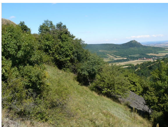
Obrázek 5 Úzkolisté suché trávníky na jižních svazích Plešivce (plocha č. 88)