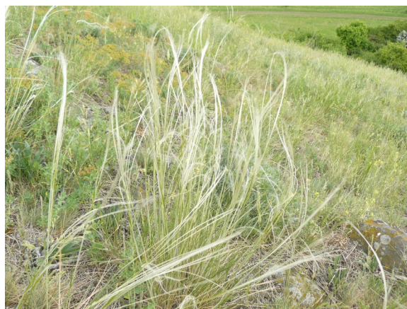
Obrázek 4 Kavyly na Holém vrchu u Sutomi