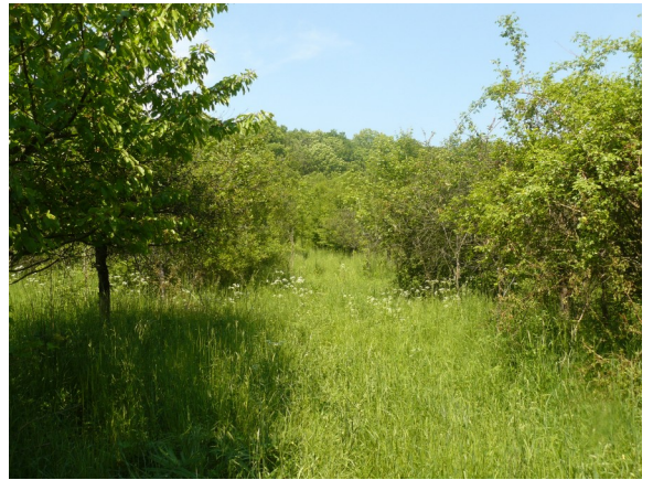
Obrázek 8 Opuštěný ovocný sad u Medvědic (plocha č. 47)