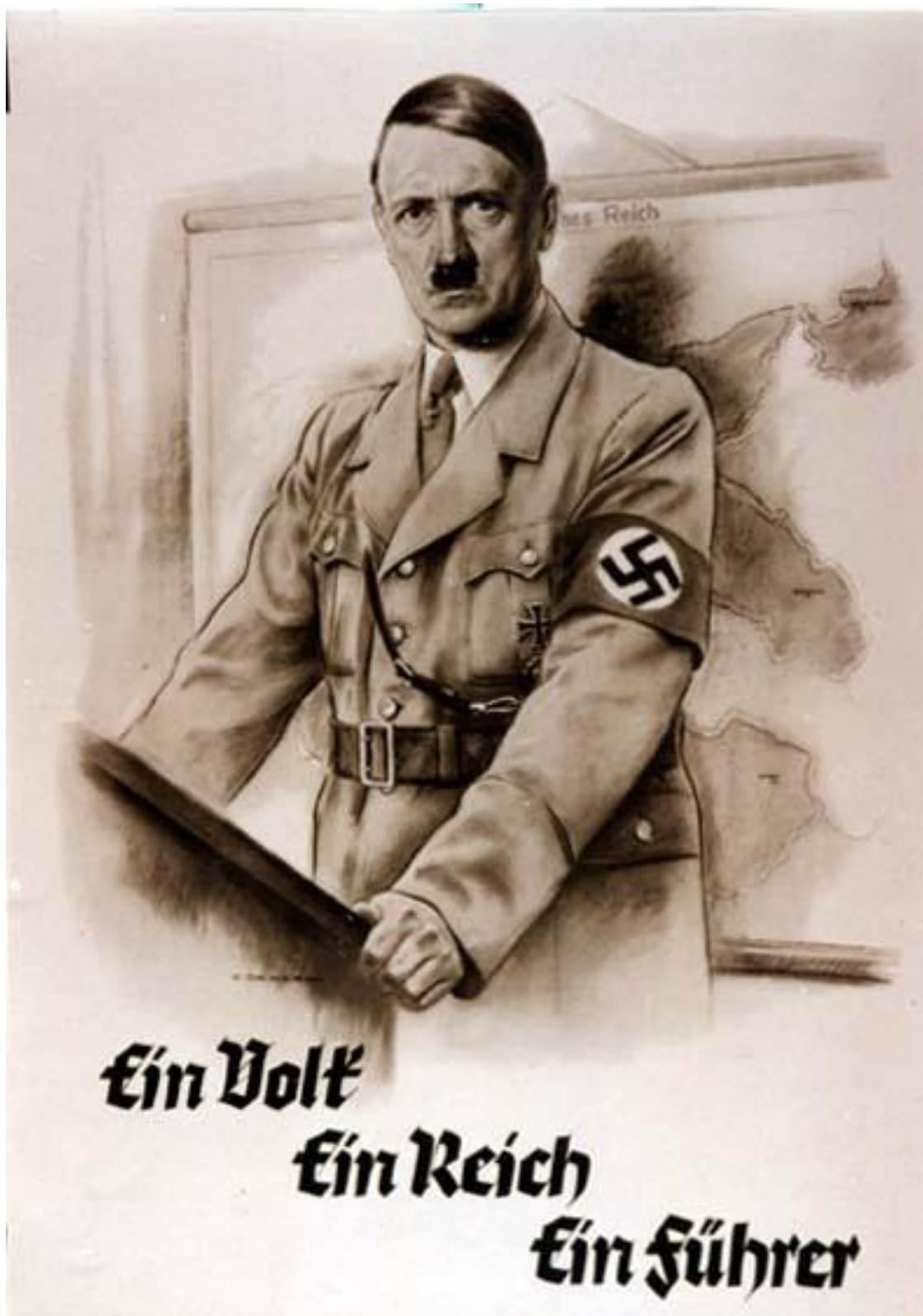
Příloha 1: Plakát „ Ein Volk, ein Reich, ein Führer “