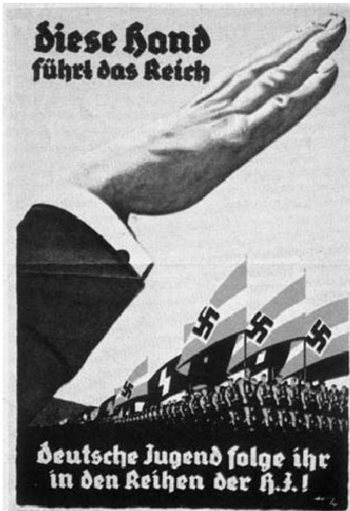
Příloha 11: Náborový plakát „ Hitlerjugend “

Zdroj: WELCH, David. The Third Reich: Politics and Propaganda . New York: Routledge, 2002. ISBN 0-203-93014-2.