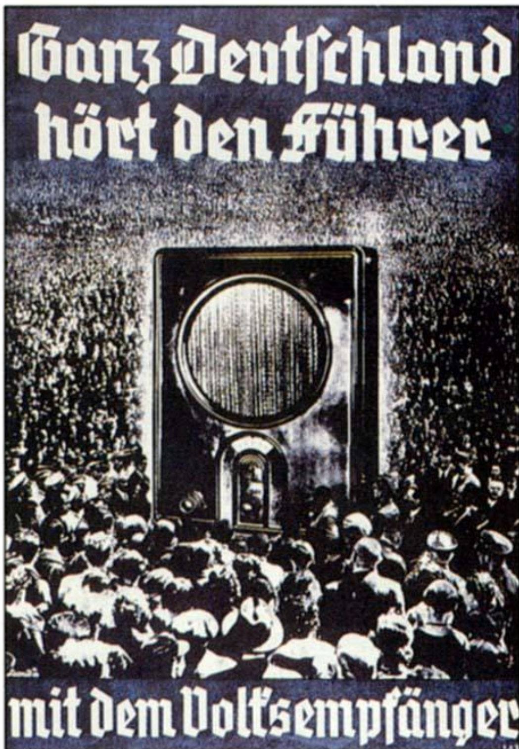
Příloha 5: Plakát „ Celé Německo naslouchá vůdci s lidovým rádiem “