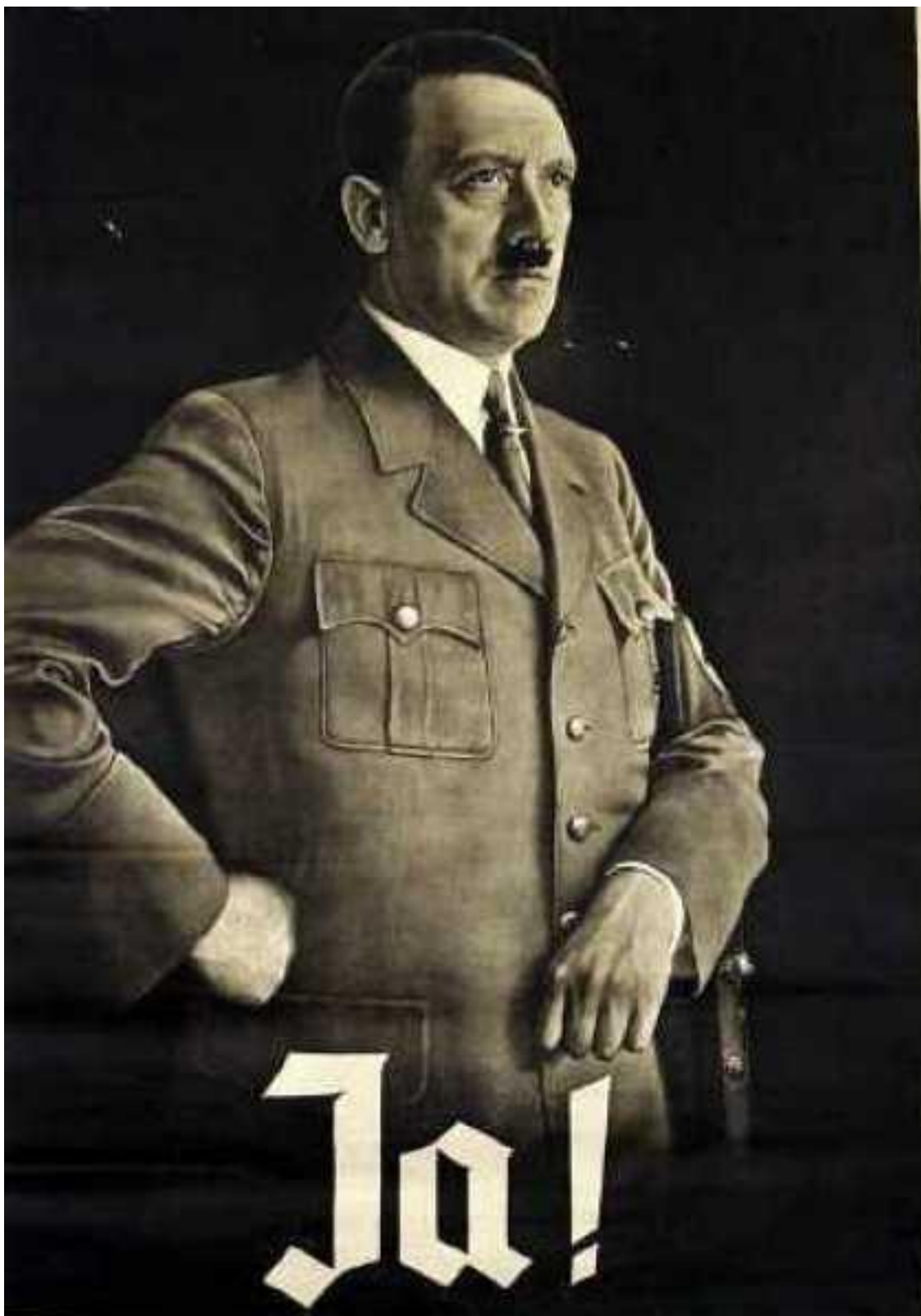
Příloha 2: Plakát k referendu