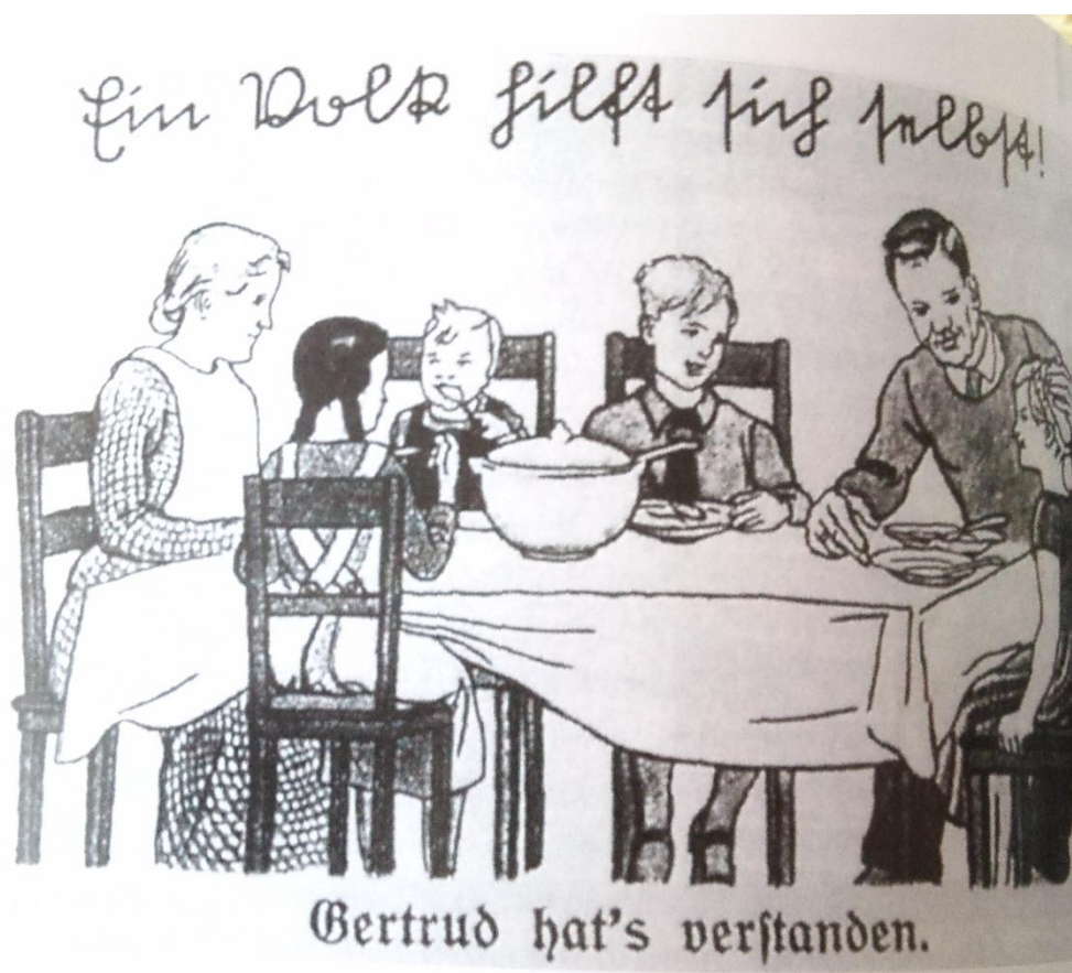
Příloha 10: Obrázek z dětské čítanky, zobrazující typický „Eintopf“

Zdroj: EVANS, Richard J. Třetí říše u moci. 1. vyd. Praha; Plzeň: Beta-Dobrovský; Ševčík, 2009. ISBN 978-80-7306-323-8.