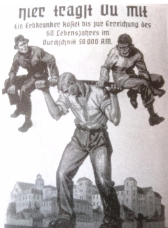
Příloha 9: Plakát, zobrazující, jak zdraví Němci nesou břemeno postižených (přesvědčoval o správnosti kastrace a zabíjení postižených)

Zdroj: EVANS, Richard J. Třetí říše u moci. 1. vyd. Praha; Plzeň: Beta-Dobrovský; Ševčík, 2009. ISBN 978-80-7306-323-8.