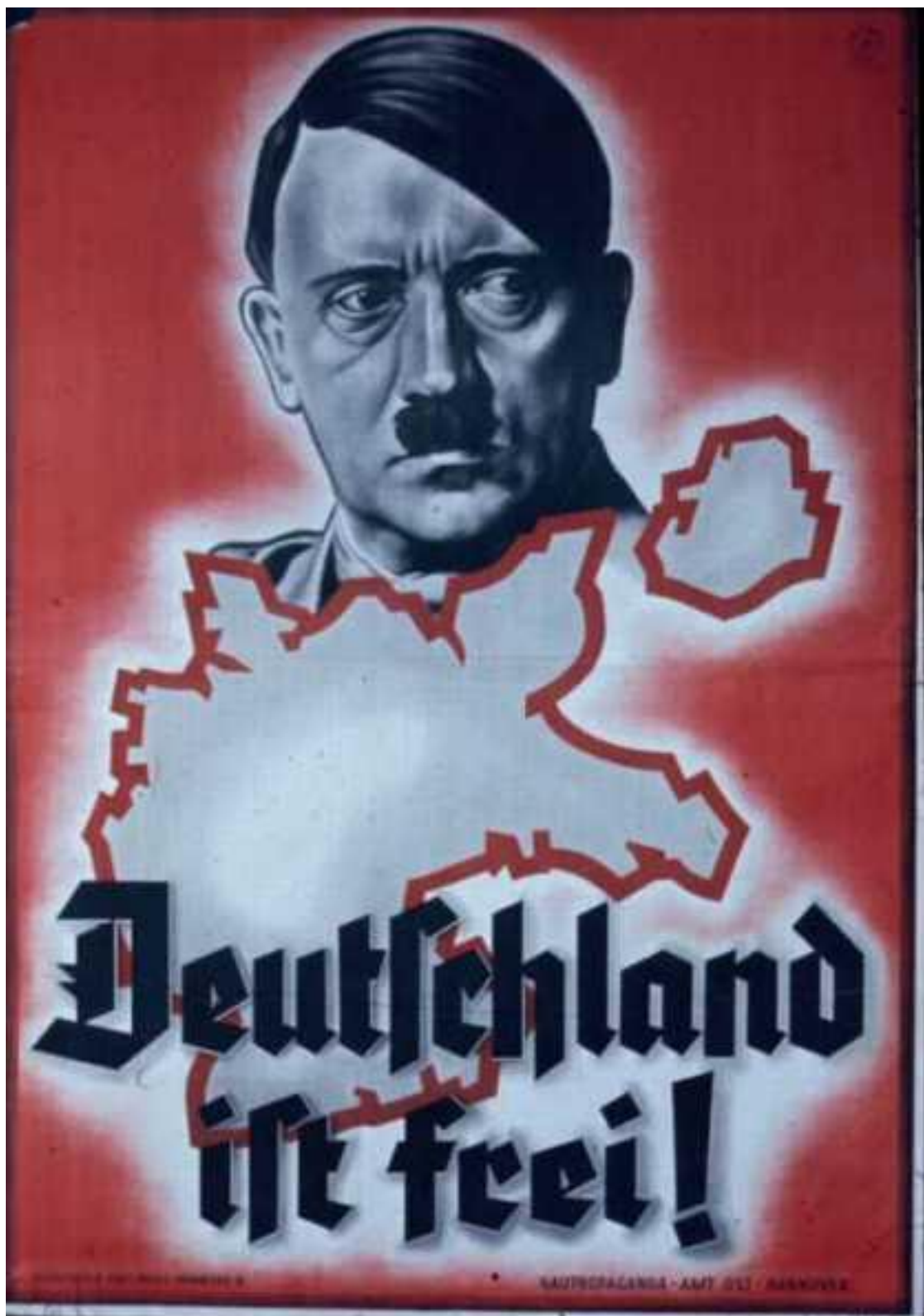
Příloha 6: Propagandistický plakát NSDAP

Zdroj: http://www.vintageadbrowser.com/propaganda-ads-1930s/5