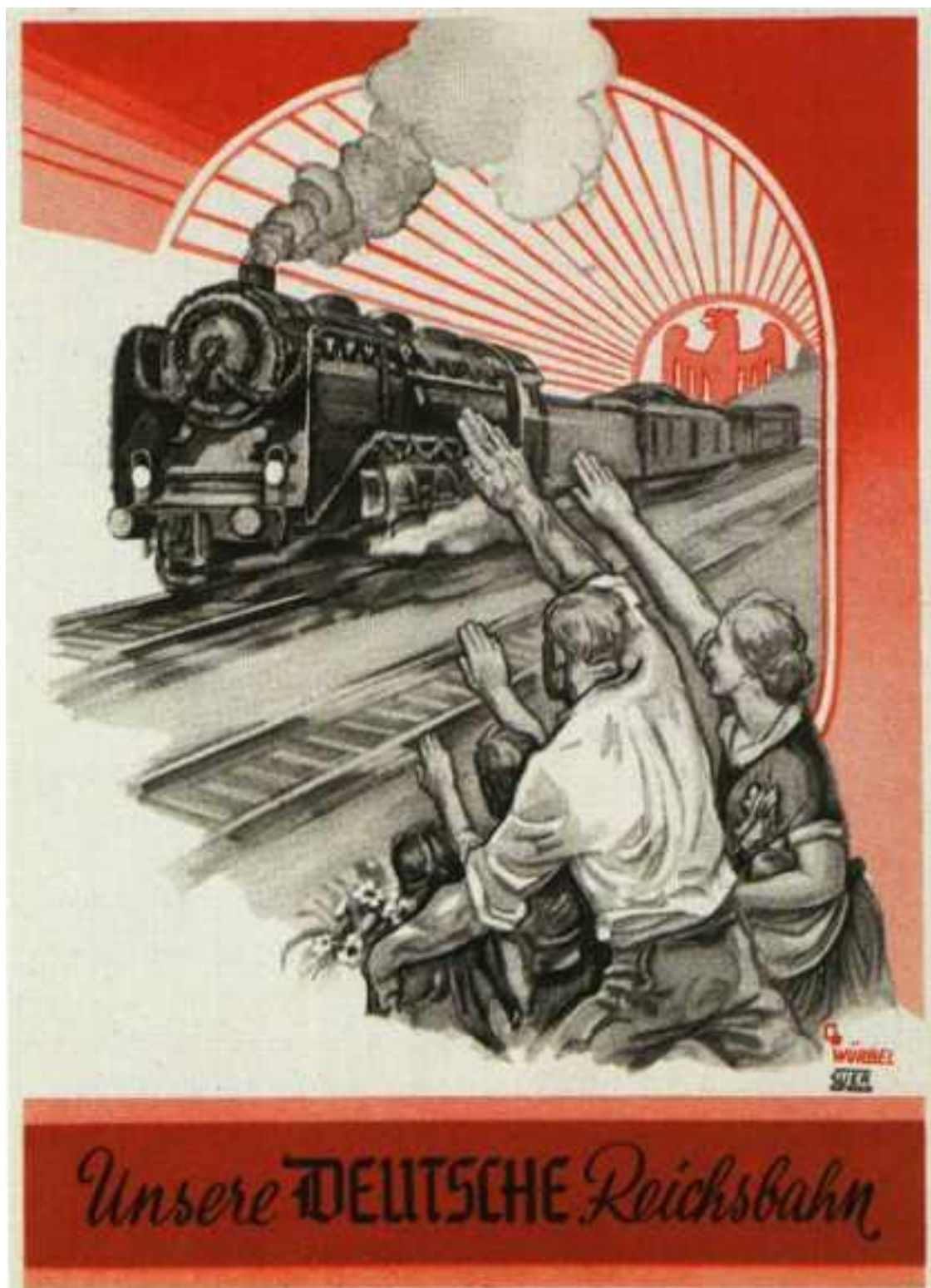
Příloha 7: Plakát „ Naše německá říšská dráha “