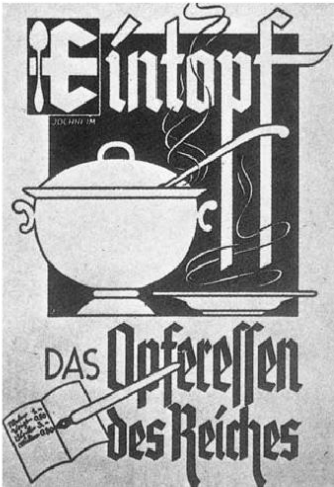
Příloha 8: Reklama, propagující tzv. „Eintopf“ (jídlo, připravované pouze v jednom hrnci)