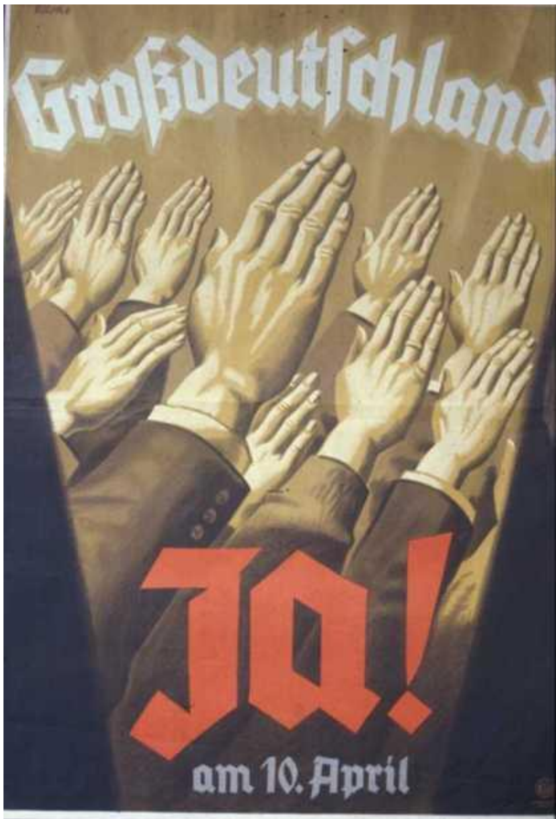
Příloha 3: Volební plakát NSDAP