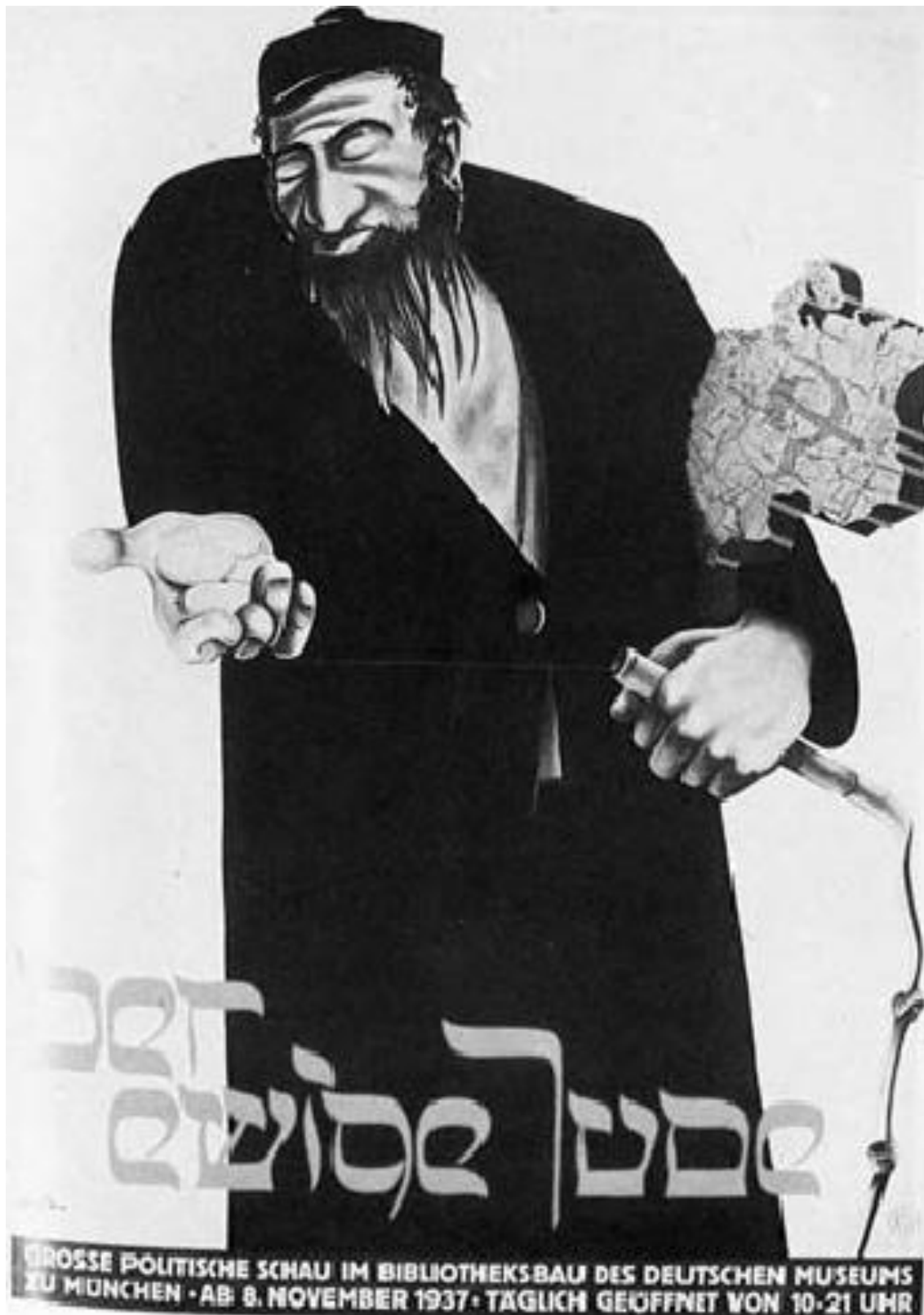
Příloha 12: Plakát k nacistické výstavě „Věčný Žid“