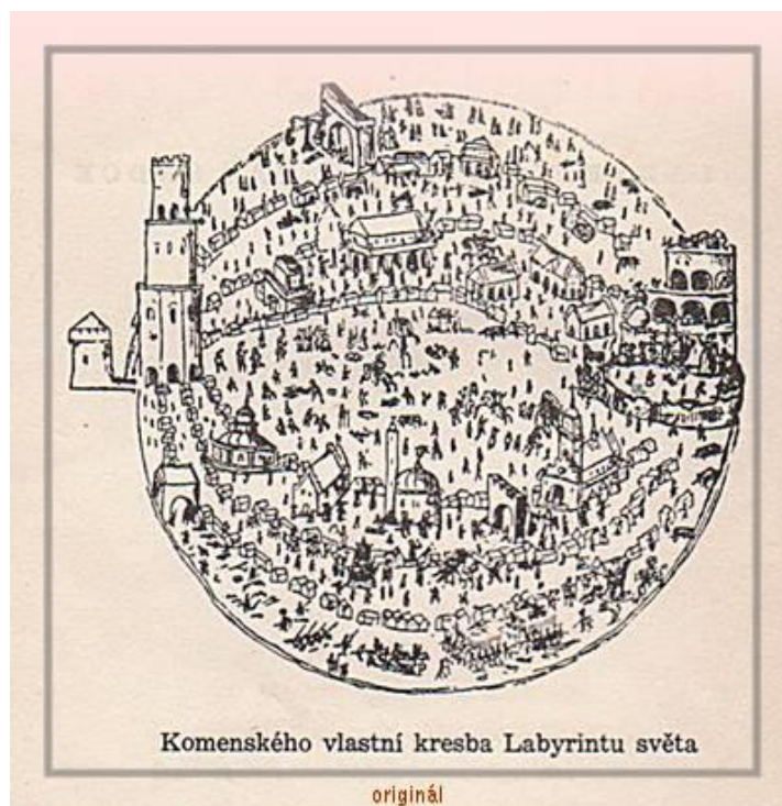
Obr. č. 2 Labyrint světa (Příloha č. 2)

V závěru každé podkapitoly bude uvedeno krátké shrnutí.