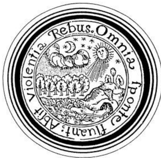
Obr. č. 3 Logo Jana Amose Komenského (Příloha č. 2)