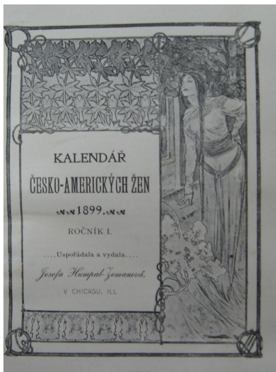
Príloha č. 16: Titulná strana Kalendáru Česko-Amerických Žen (obrázok vľavo)