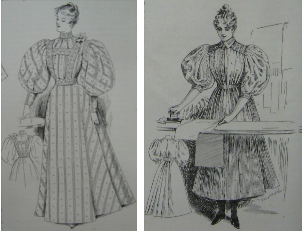
Príloha č. 9: Príspevok v listovej rubrike Besídka (obrázok)