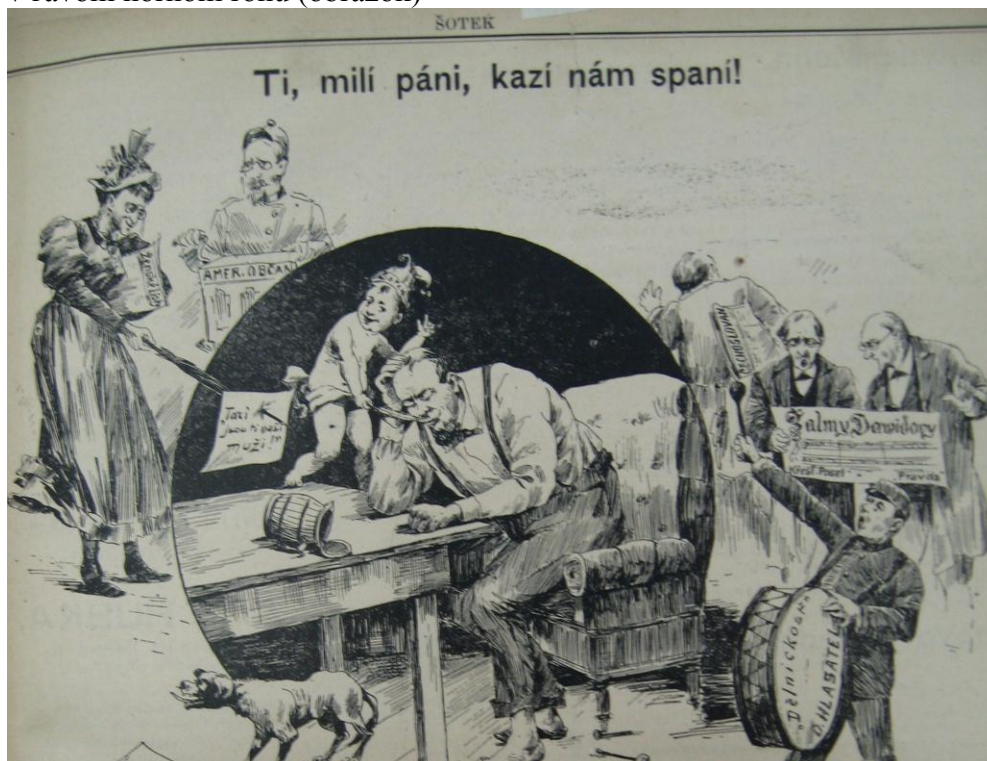
Príloha č. 17: Karikátúra na české krajanské časopisy v Šotku - čitateľka Ženských Listov v ľavom hornom rohu (obrázok)