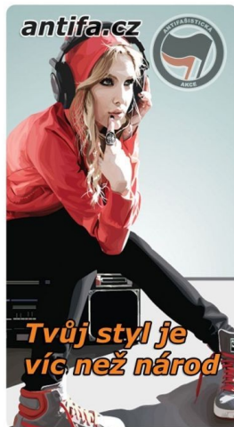
Příloha č. 4 – Některé z obrazových materiálů kampaně Good night white pride