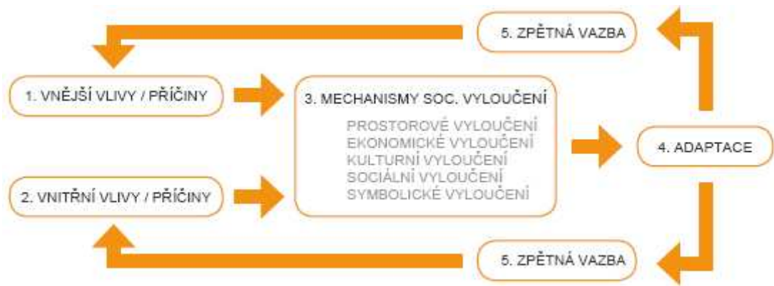
Schéma procesu sociální exkluze