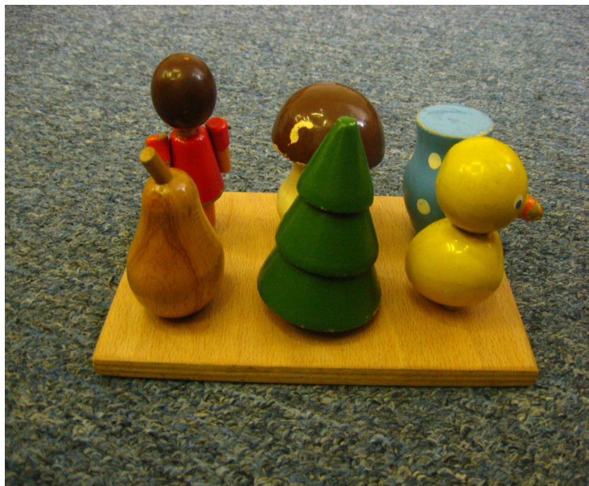
Deska se zasouvacími kolíky v podobě figurek na nácvik šestibodu

Pomůcky a hračky ze Školy Jaroslava Ježka