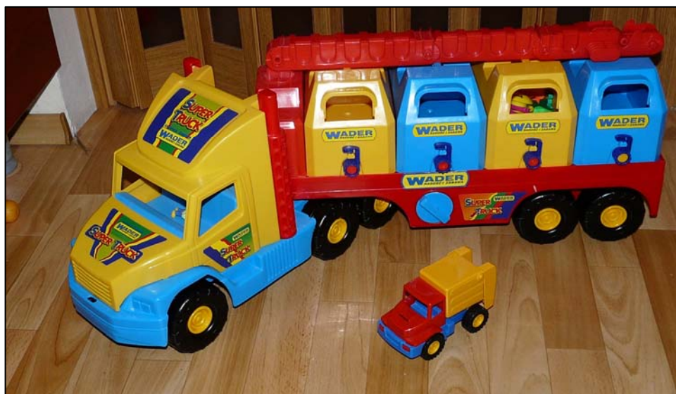
Obrázek 6 Nákladní auto

Matýsek se velmi zajímal o popelářskou profesi, o popelářská auta a též o třídění odpadu. Rodiče mu proto pořídili toto popelářské auto s jednotlivými kontejnery na papír, plast a sklo, což mu velmi vyhovovalo při jeho sklonu k pořádnosti a strukturovanosti.