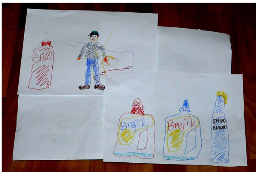
Obrázek 12 Čistící prostředky

Své oblíbené hračky a předměty si nechával často namalovat, stejně tak tomu bylo u Brefíka, Omino bianco a Sava.