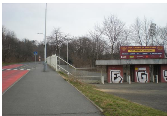
Obr. 7 – Poutač na utkání u silnice