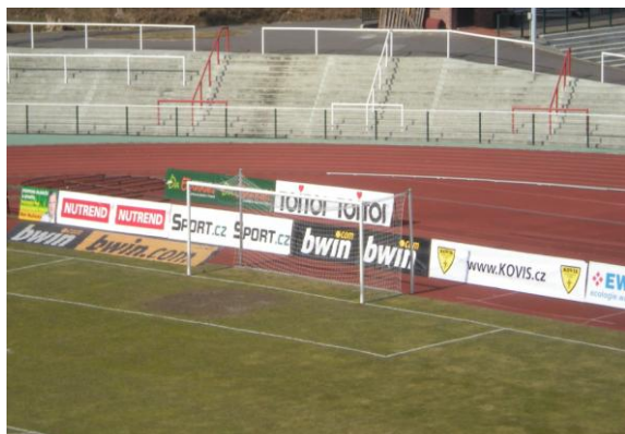
Obr. 5 – Reklamní plochy za brankou