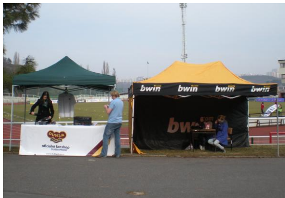
Obr. 1 – Suvenýry a Stan Bwin