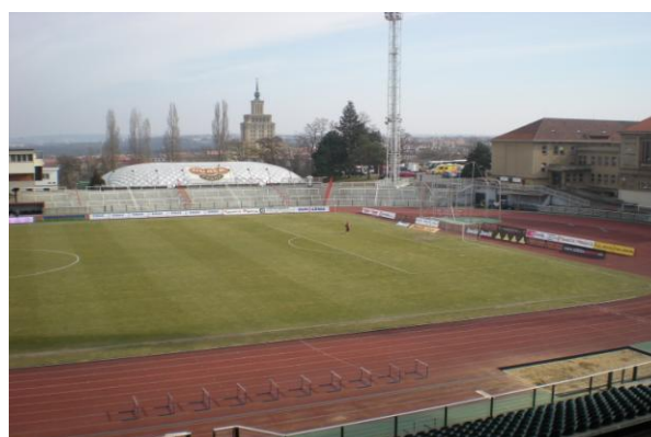
Obr. 8 – Hrací plocha z tribuny