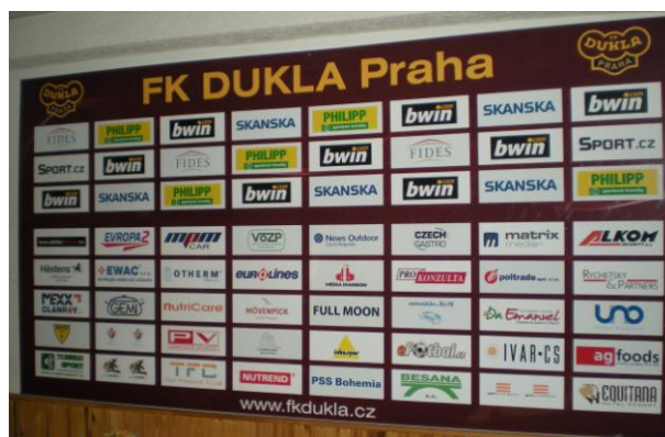
Obr. 2 – Pozadí na rozhovory