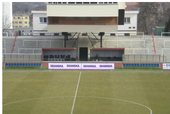
Obr. 6 – LED panely