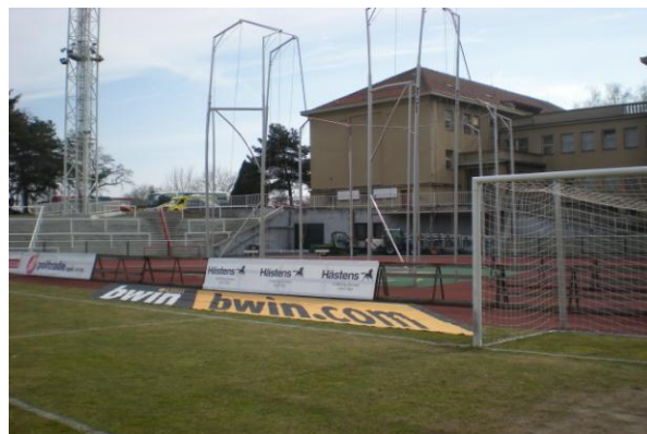
Obr. 4 – Reklamní plachta Bwin