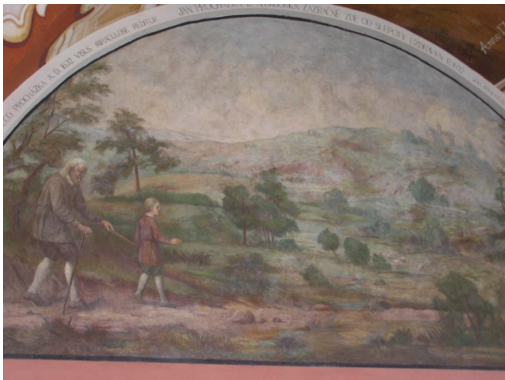
Obr. č. 6 Slepec Jan Procházka přichází po dlouhé pouti na Svatou Horu - lunetový obraz v západním ambitu