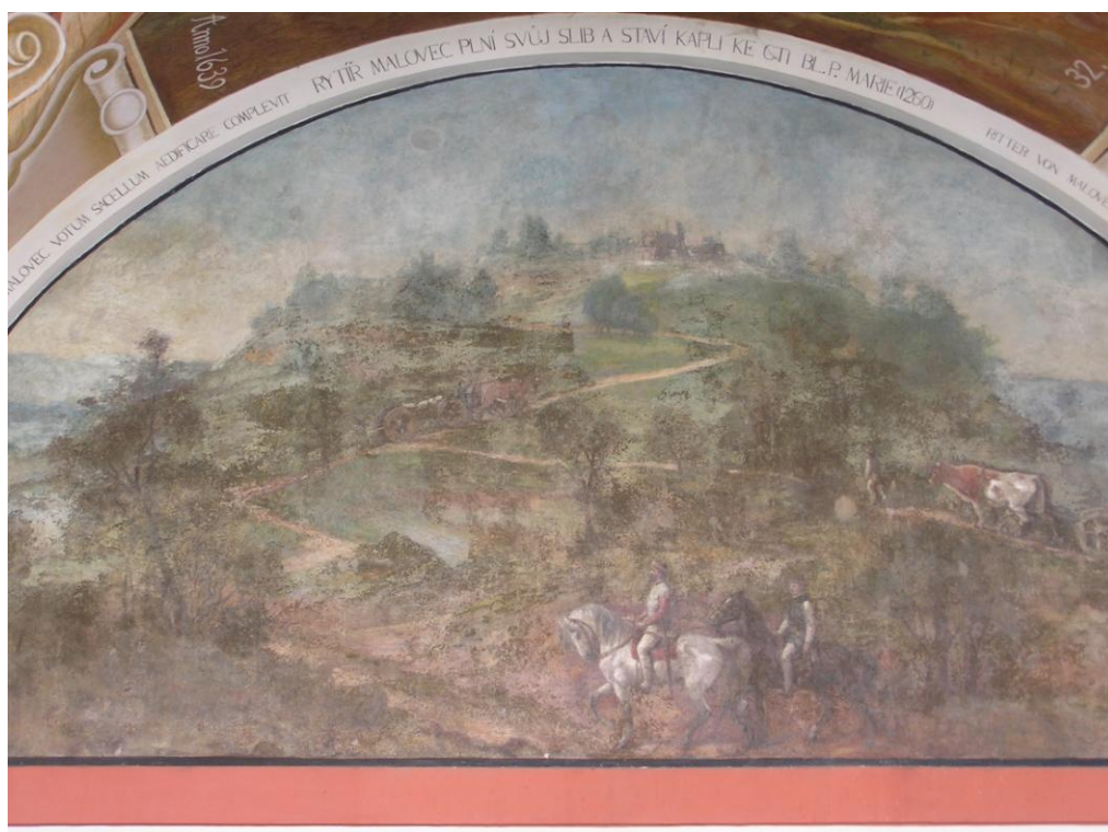
Obr. č.4 Stavba první kapličky - lunetový obraz v jižním ambitu