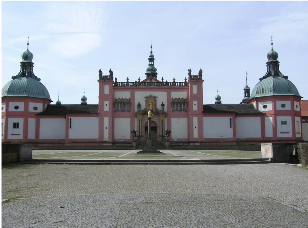
Obr. č. 1 Poutní místo Svatá Hora nad Příbramí, pohled na Pražskou bránu