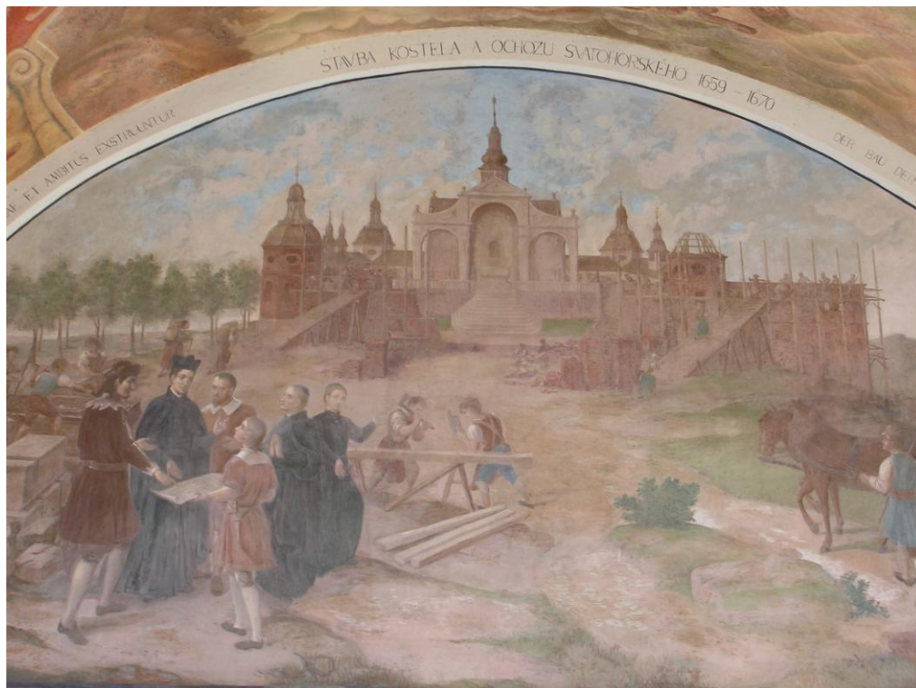
Obr. č. 9 Stavba kostela za správy jezuitů (2. pol. 17. století) - lunetový obraz v severním ambitu