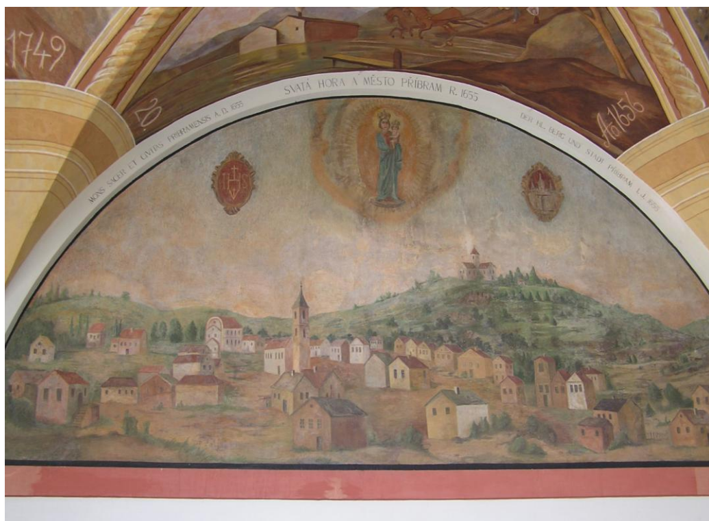
Obr. č. 10 Svatá Hora a město Příbram v roce 1665 - lunetový obraz ve východním ambitu