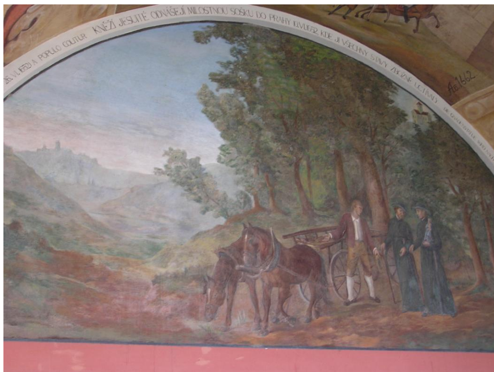
Obr. č.8 Jezuité odnášejí sošku Panny Marie do Prahy - lunetový obraz v západním ambitu