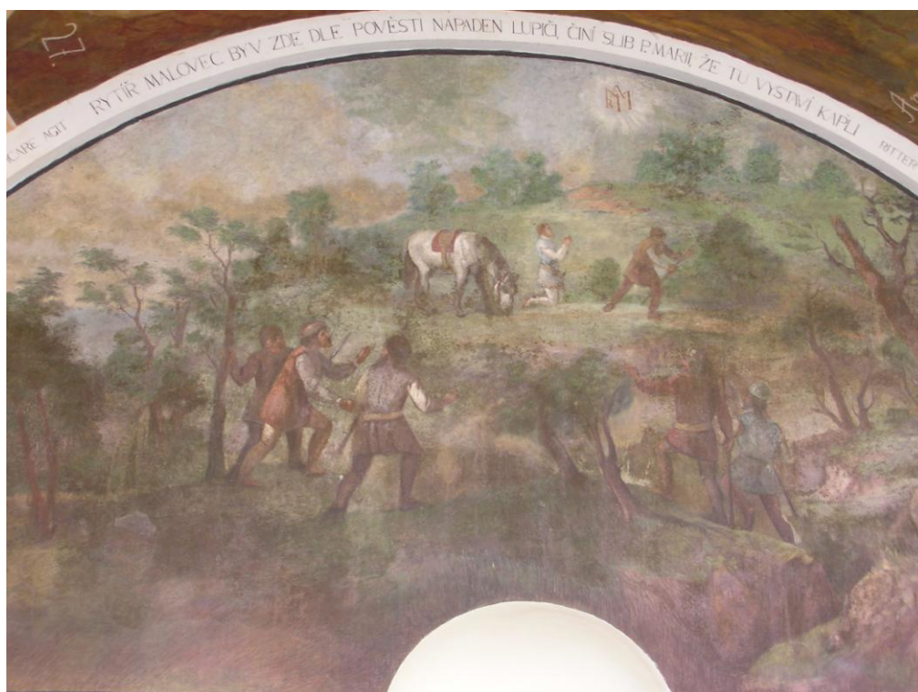
Obr. č. 3 Rytíř Malovec se modlí k Panně Marii na Svaté Hoře - lunetový obraz na stěně v jižním ambitu Svaté Hory