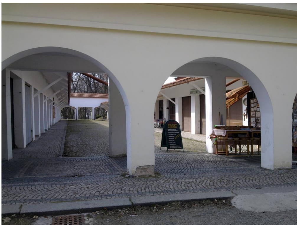
Obr. č. 14 Krámky s upomínkovými předměty na Svaté Hoře