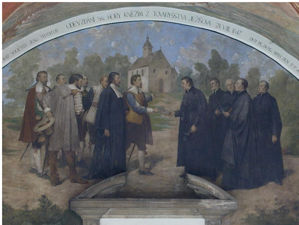
Obr. č. 7 Svatá Hora je předávána do rukou jezuitů - lunetový obraz v severním ambitu