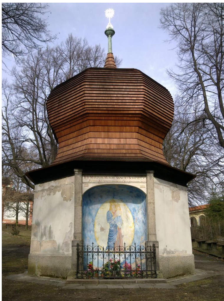
Obr. č. 13 Svatohorská studánka na počátku třetího tisíciletí