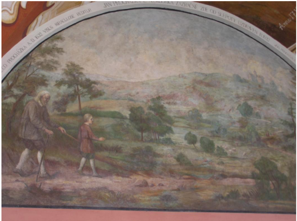
Obr. č. 6 Slepec Jan Procházka přichází po dlouhé pouti na Svatou Horu - lunetový obraz v západním ambitu