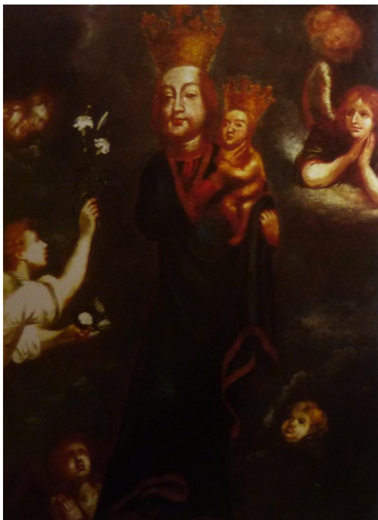
Obr. č. 11 K. Škréta: Andělé adorují Pannu Marii Svatohorskou, obraz z roku 1654 (zdroj: KOPEČEK, J. Svatá Hora . Karmelitánské nakladatelství: Kostelní vydří, 2006.)