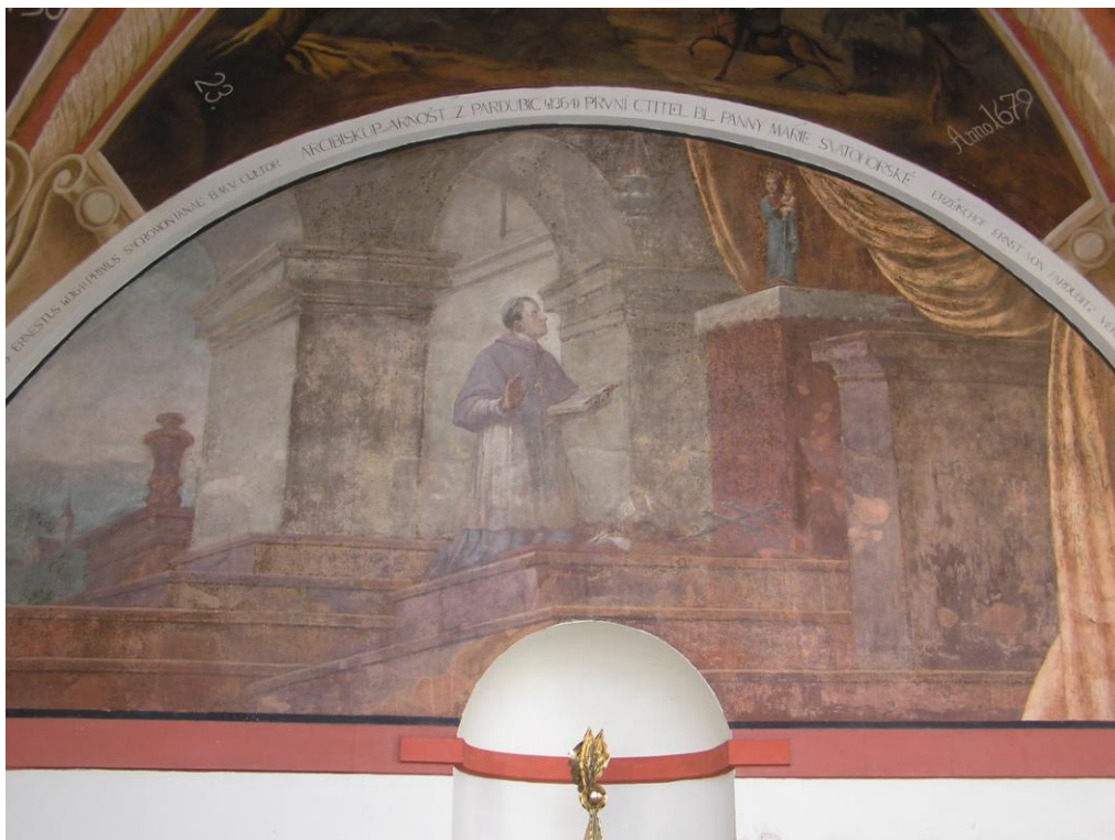
Obr. č. 5 Arnošt z Pardubic se modlí k sošce Panny Marie Svatohorské - lunetový obraz v jižním ambitu