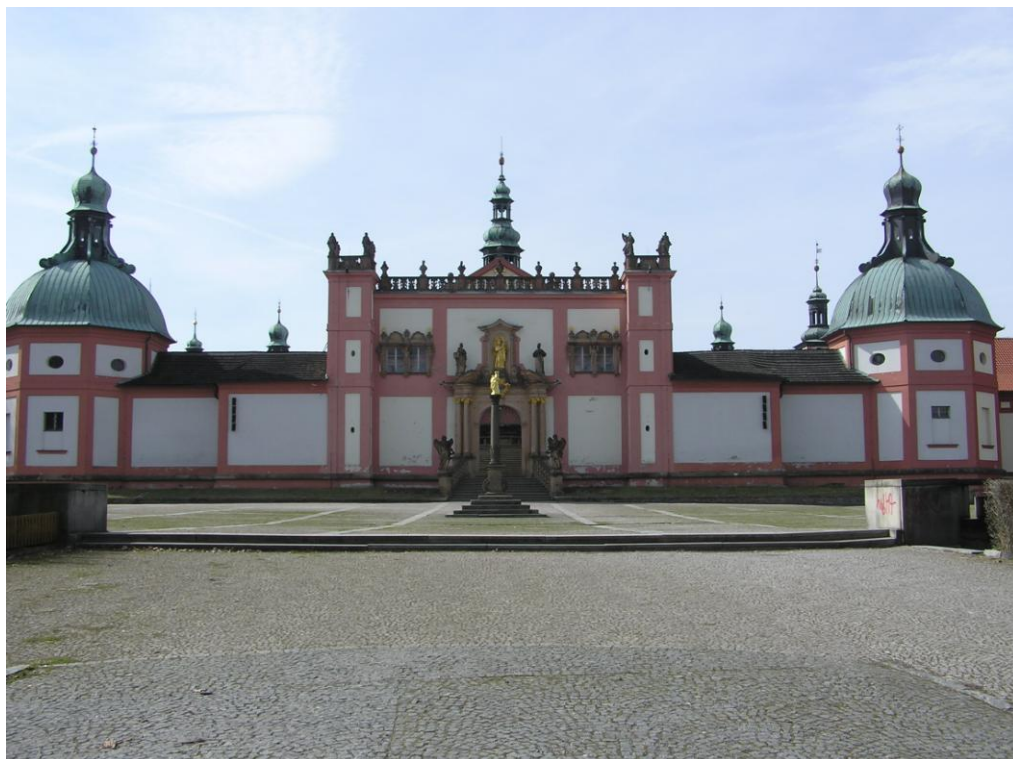
Obr. č. 1 Poutní místo Svatá Hora nad Příbramí, pohled na Pražskou bránu