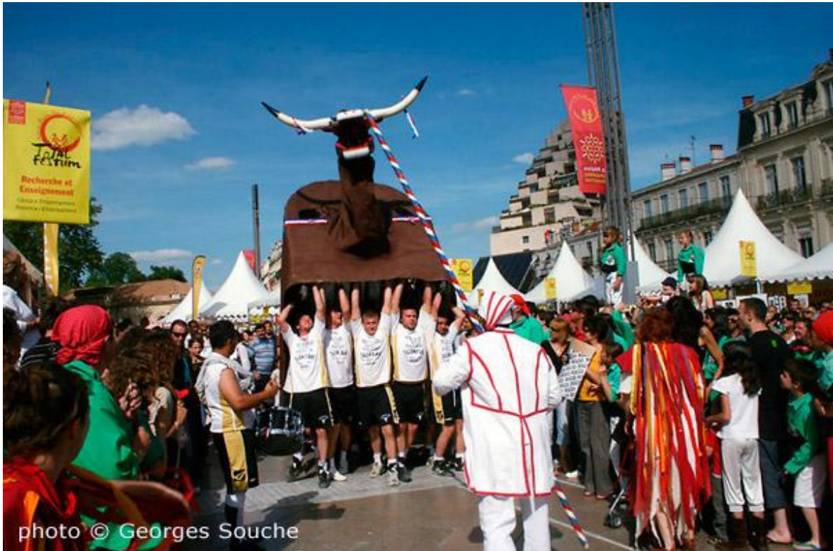
1 Animaux totémiques : le bœuf de Mèze