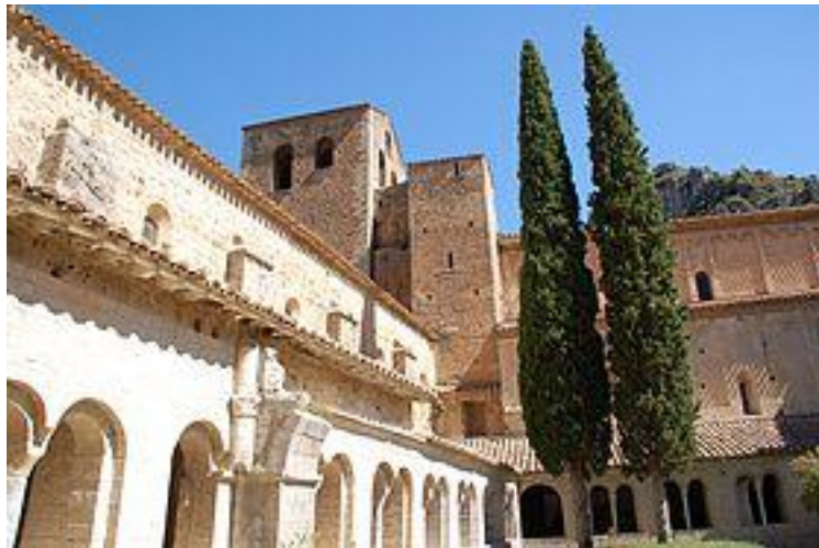
10 Abbaye de Saint-Guilhem le Désert