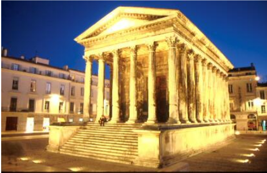
7 Maison Carrée de Nîmes