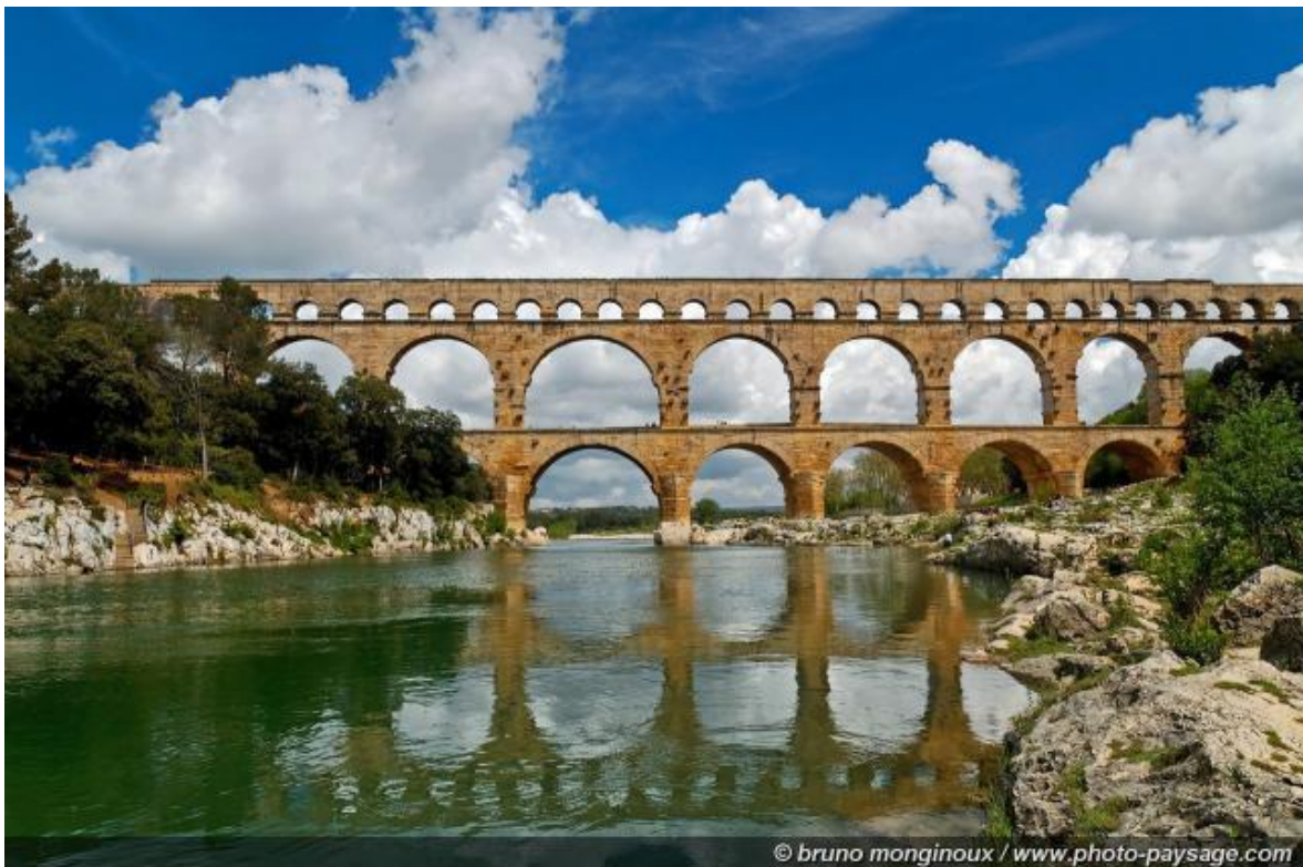
12 Pont du Gard