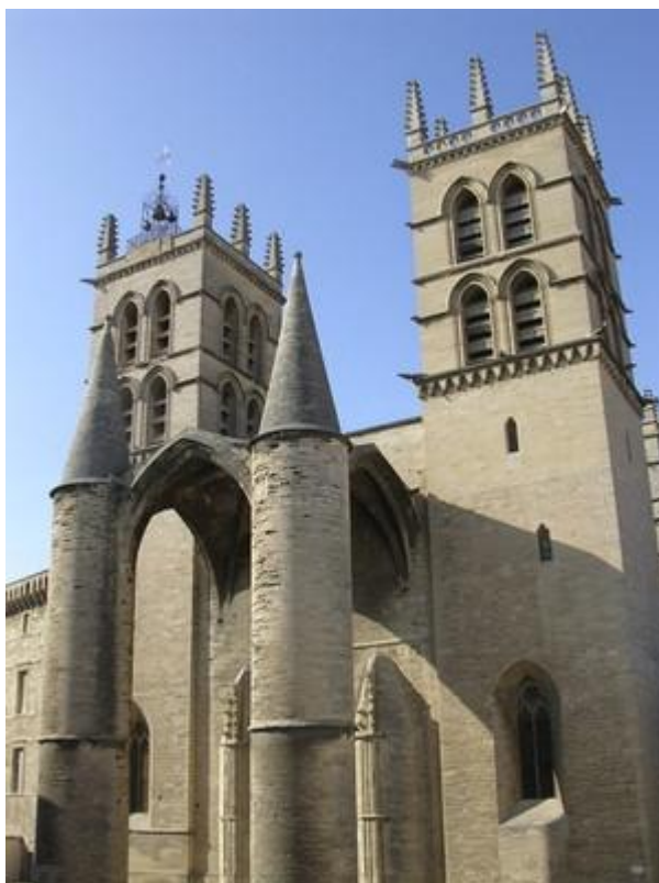
9 Cathédrale Saint-Pierre de Montpellier