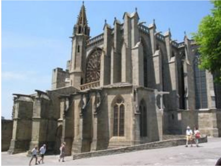
3 Basilique Saint Nazaire de Carcassonne