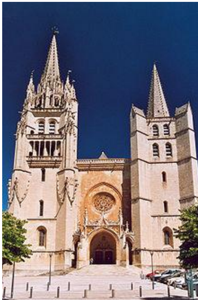
8 Cathédrale Saint-Privat de Mende