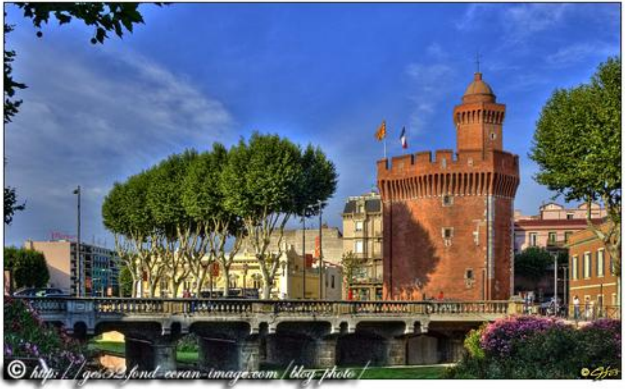
5 Castillet de Perpignan