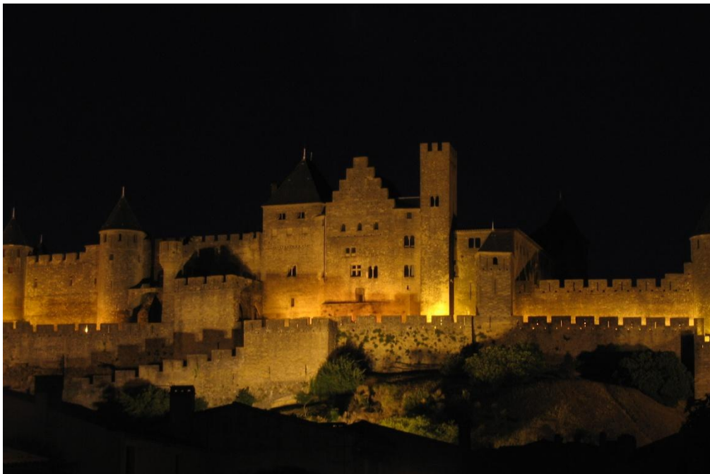
2 Château Comtal de Carcassonne