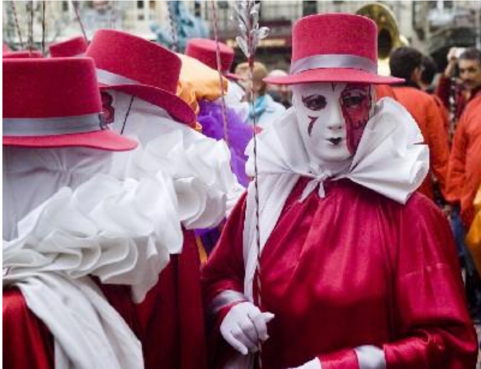
3 Carnaval de Limoux