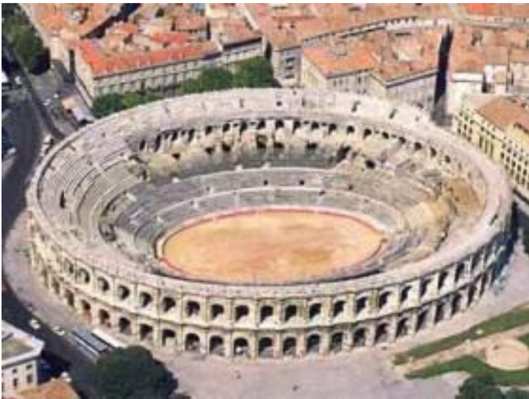
6 Amphithéâtre de Nîmes