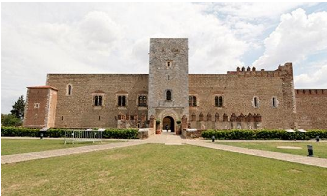
4 Palais des rois de Majorque de Perpignan