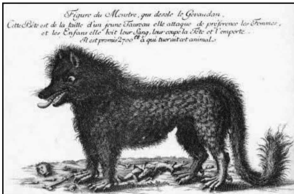
2 Bête du Gévaudan