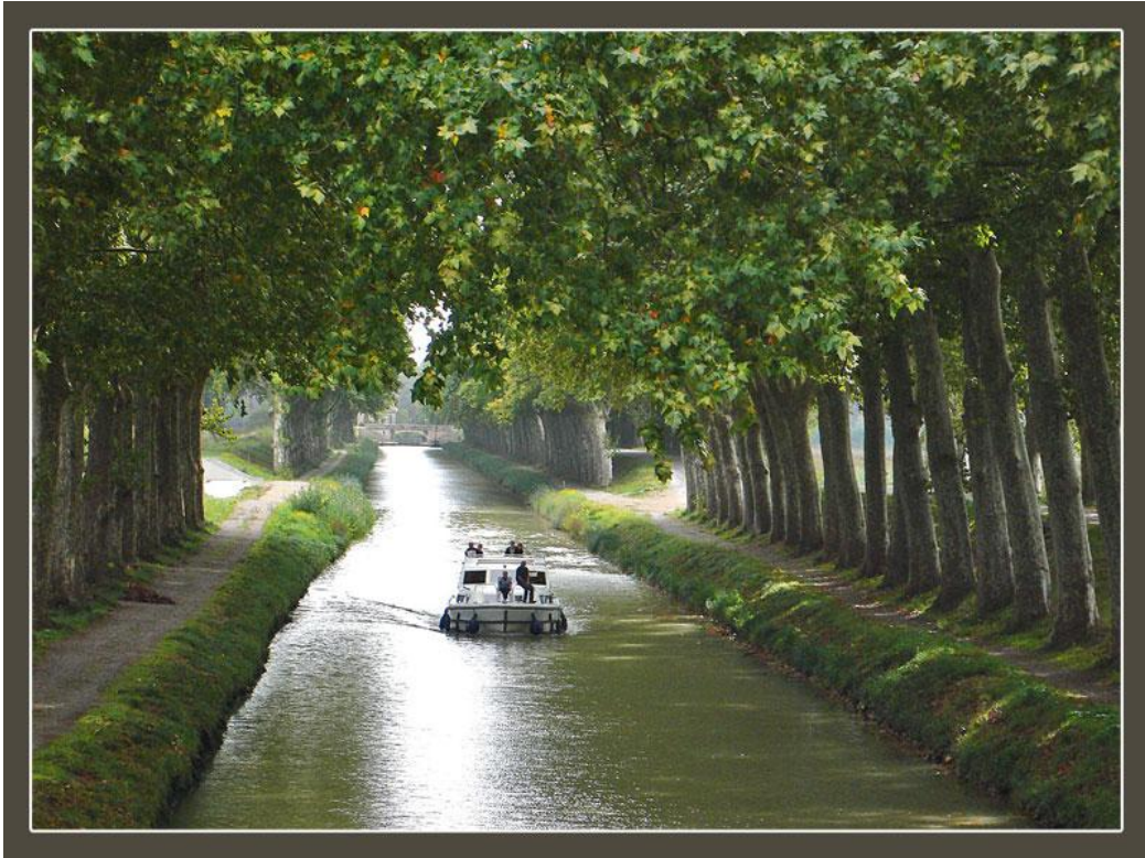
11 Canal du Midi