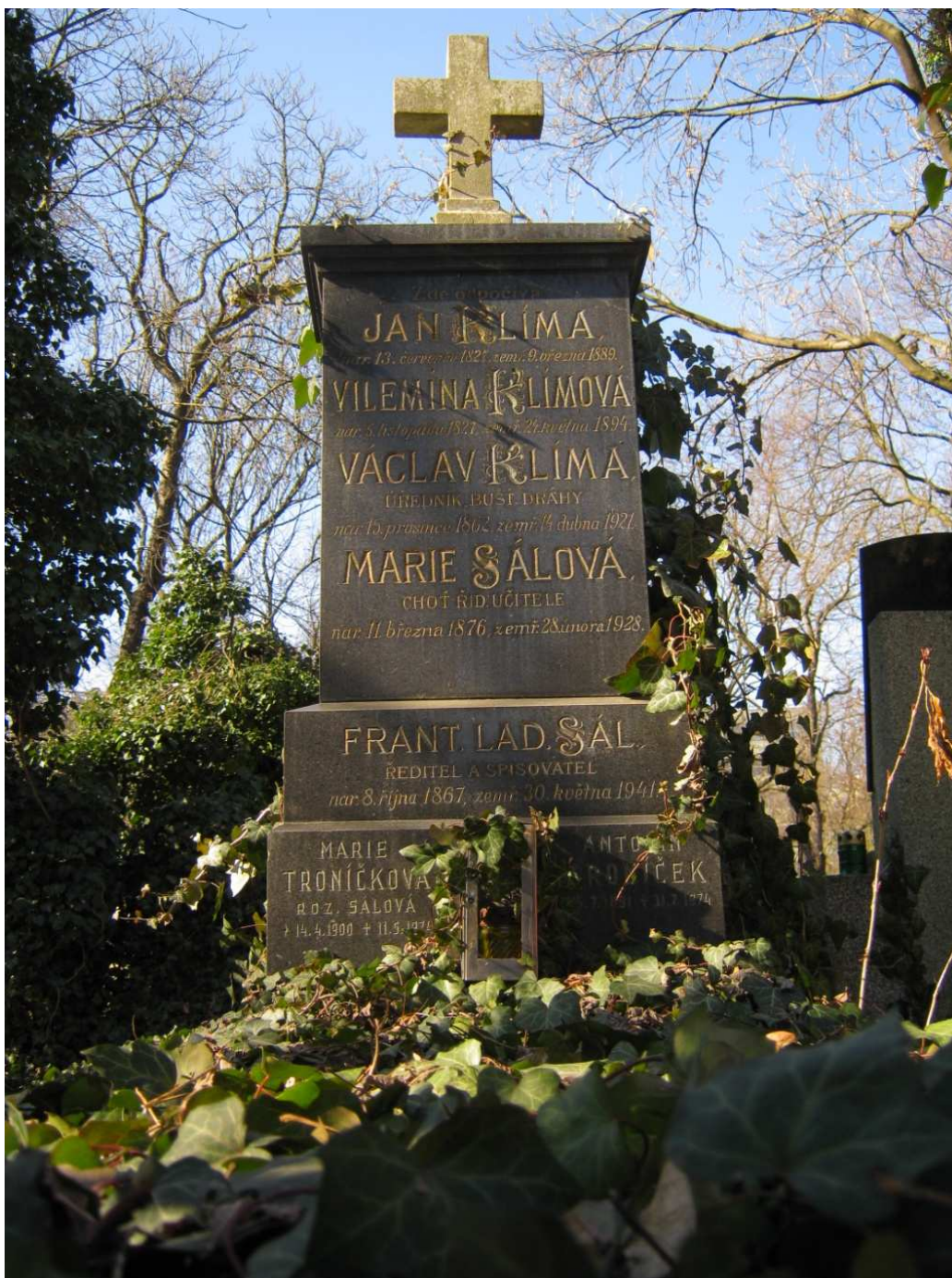
Příloha č. 4 – hrob na Olšanských hřbitovech 143