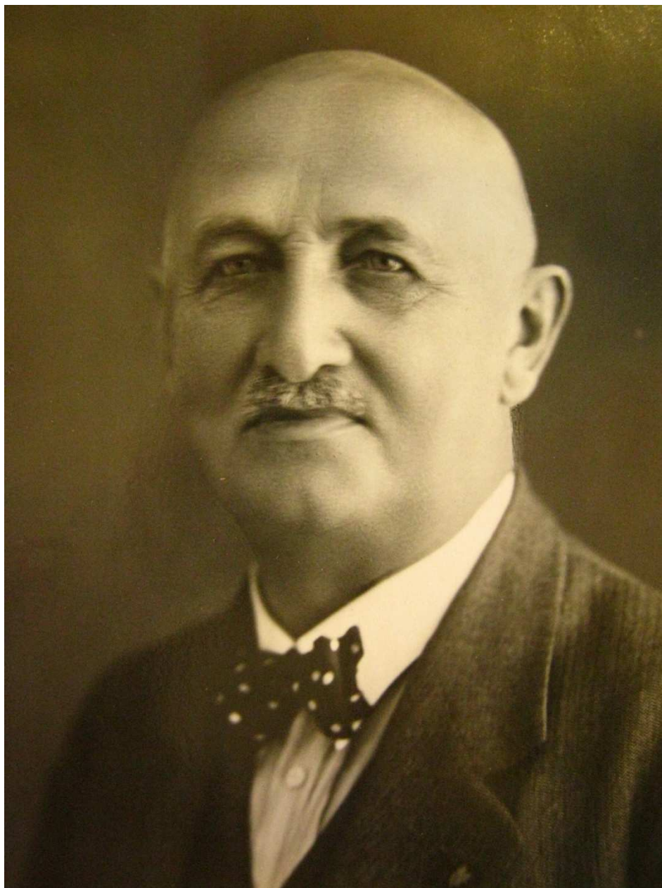
Příloha č. 1 – portrétní fotografie 1 140