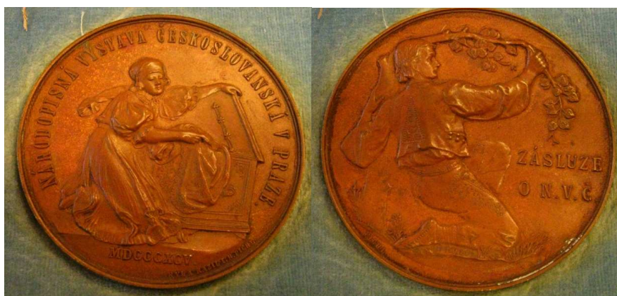
Příloha č. 5 – diplom a medaile za Národopisnou výstavu československou 144