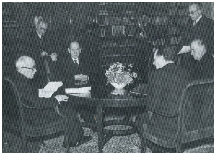
Příloha 12: Prezident Beneš jedná 25. února 1948 s komunisty. 259