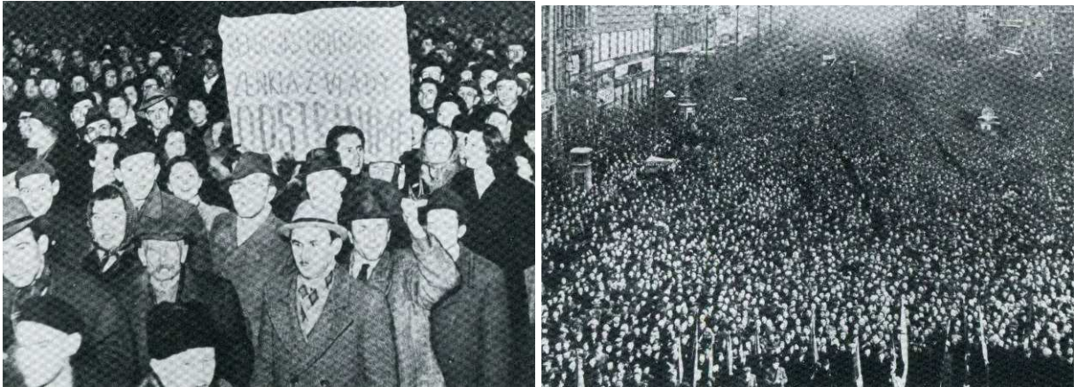
Příloha 11: Manifestace na Václavském náměstí dne 25. února 1948.