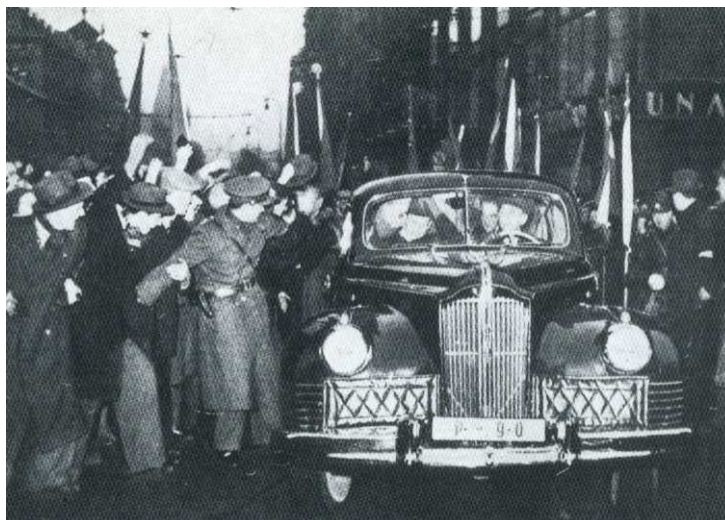
Příloha 14: Klement Gottwald se vrací z Hradu na Václavské náměstí.