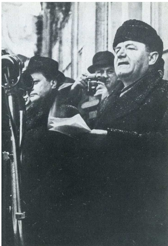
Příloha 7: Projev Klementa Gottwalda na Staroměstském náměstí 21. února 1948. 256