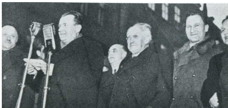
Příloha 15: Znovu Klement Gottwald, tentokrát oznamující davu jmenování nové vlády. 261