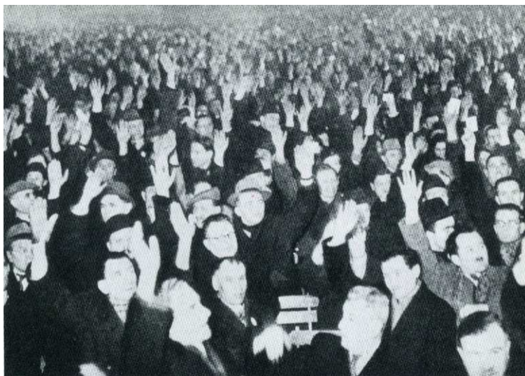
Příloha 9: Hlasování delegátů tamtéž. 257