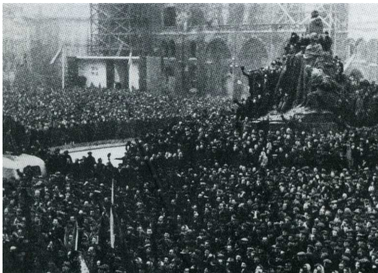
Příloha 6: Manifestace na Staroměstském náměstí 21. února 1948.