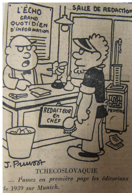
Příloha 20: Takto viděli situaci v ČSR redaktoři francouzského listu Le Pays 26. 2. 1948. 266