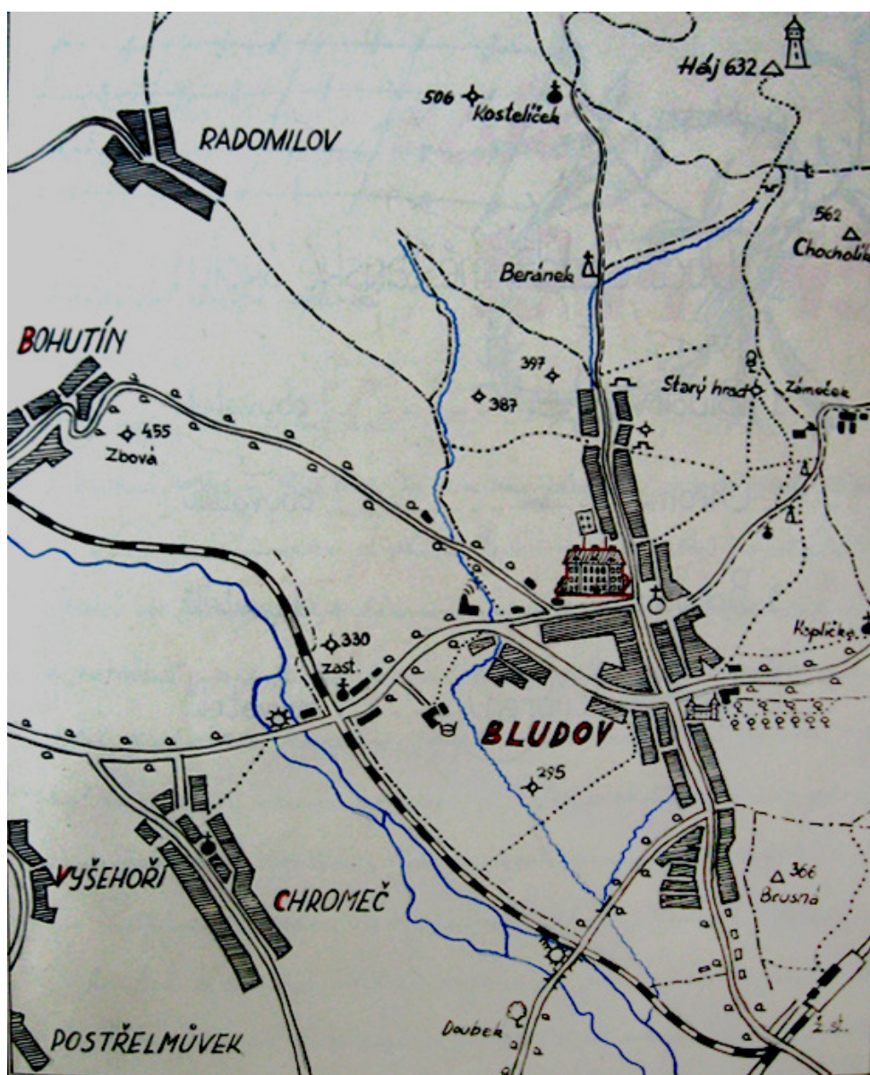
Obr. 1: Mapka Bludova a okolí. Kronika Měšťanské školy Masarykovy v Bludově 1944-1960, str. 3

Obec Bludov se nachází na severní Moravě, asi čtyři kilometry jihozápadně od bývalého okresního města Šumperk. Rozprostírá se na rozhraní Hornomoravského úvalu a Hrubého Jeseníku. Na území Bludova zasahují tři horopisné celky: Branenská vrchovina, Šumperská kotlina a Mohelnická brázda. Od severu k jihu nadmořská výška klesá až k soutoku Moravy s Desnou v jižní části katastru. Řeka Morava tvoří v okolí obce četné meandry a slepá ramena. 18