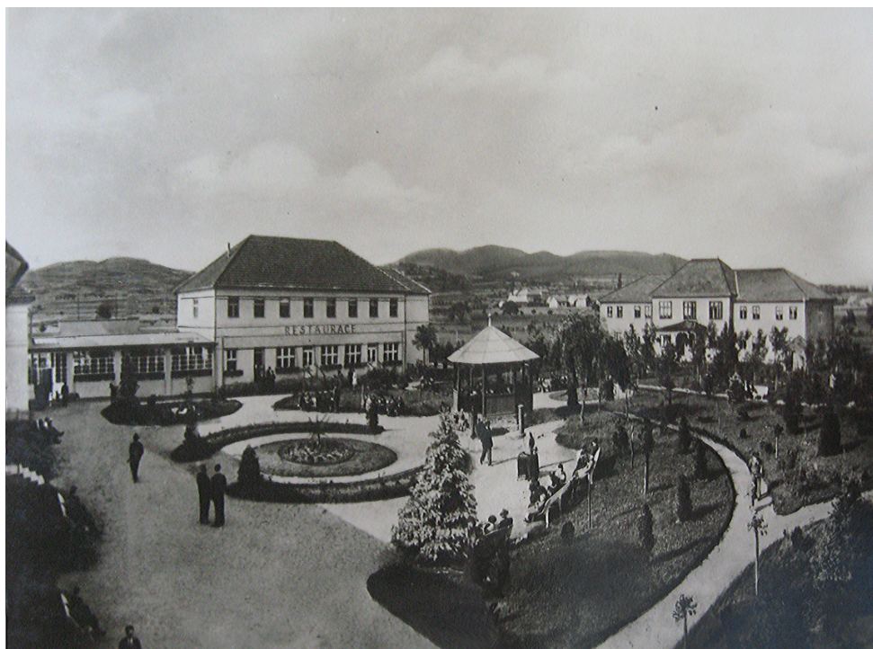
Obr. 5: Bludovské lázně.

Od otevření až do začátku války prakticky každý rok se lázně rozšiřovaly. Už na podzim k nim vedla čtyři metry široká příjezdová cesta. V následujícím období přibýly nové budovy: jedna vanových lázní, druhá se společenským sálem a třetí administrativní s pokoji v prvním patře. V roce 1933 byly zachyceny dva prameny. Zřídlo mělo teplotu 30 °C. Při navrtávání pramene do hloubky 76 metrů v roce 1937 se našlo dalších 12 pramenů, převážně teplých.