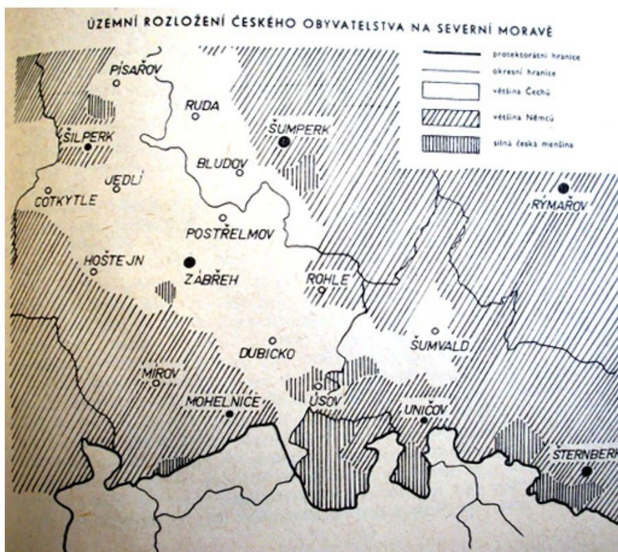
Obr. 2: Národnostní poměry. Bíle jsou vyznačena místa s českou většinou. Převzato z BARTOŠ, Josef. Postavení českého obyvatelstva na Severní Moravě za okupace . Šumperk 1969, str. 33.

na trůn. 24 Do roku 1910 ji navštěvovali pouze chlapci, až ve školním roce 1910-1911 do ní