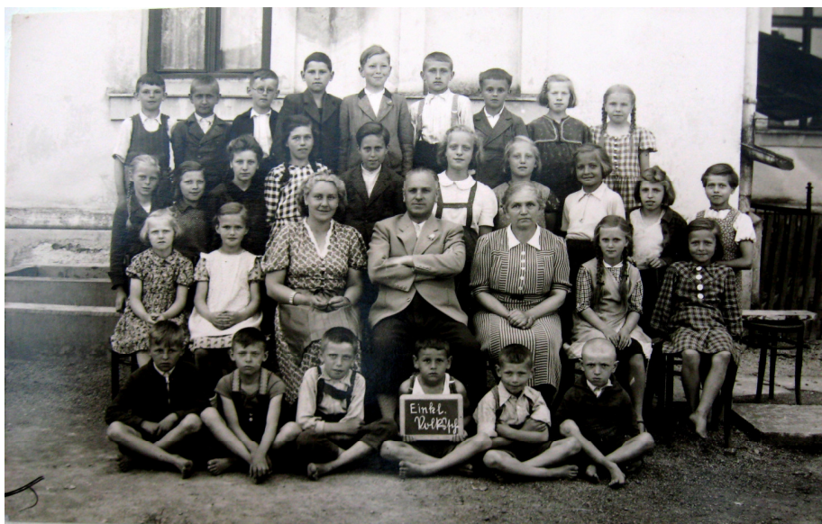
Obr. 9: Německá jednotřídní škola. SOkA Šumperk, fond Německá obecná škola Bludov, inv. č. 1, Schulgedenkbuch, 1. Volksschule in Blauda 1939-1945, nečíslováno.

Jiná situace nastala pro německé obyvatele. Ti za první republiky nevedli v obci kulturní a společenský život jako Češi. 174 Neexistovala německá škola, ani menšinová, ani školka a ani knihovna, proto nyní došlo k jejich vzniku. Škola byla založena na základě