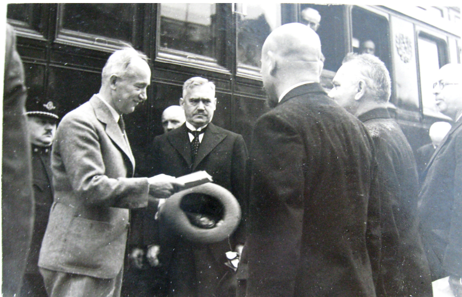
Obr. 6: Prezident E. Beneš vítán na bludovském nádraží. SOkA Šumperk, fond AO Bludov, inv. č. 15, str. 89.

záznam proslovu, který zachytil kronikář: „Jsme na správné cestě, která nás nesporně přivede k lepší budoucnosti. Je jen potřeba pracovat svorně ruku v ruce na společném díle a nic, ani dočasné mraky na mezinárodní obloze, nemůže nám zabránit v dosažení úspěchu. Věřme, že mír bude zachován a že věci se budou v klidu stále lépe a lépe vyvíjeti.“ 110 Bohužel jeho přání se neuskutečnilo a následné události zničily všechny na-