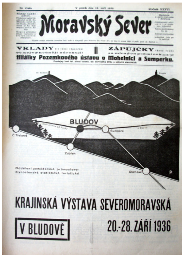
Obr. 4: Upoutávka na výstavu. Noviny Moravský Sever zde dne 18. září 1936.