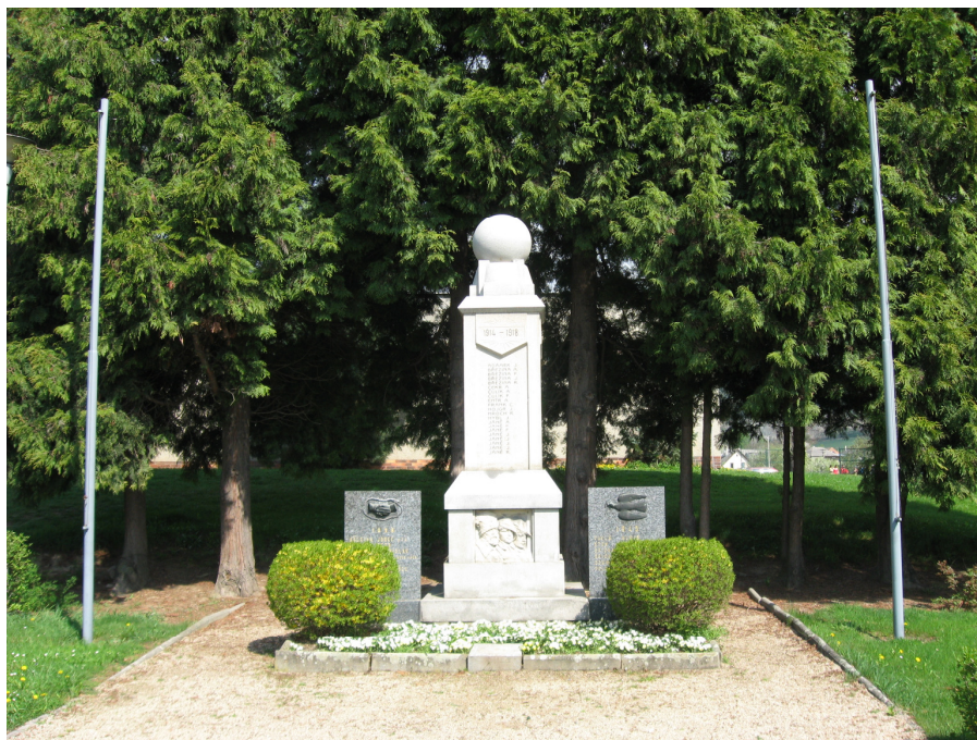
Obr. 3: Památník obětem válek.

Důležitou událostí, která se uskutečnila v roce 1921 a která měla připomínat hrůzy první světové války, bylo odhalení pomníku padlým vojákům pocházejícím z Bludova. Na pomníku nejsou napsána všechna jména padlých nebo nezvěstných, i přesto jich je vytesáno něco kolem sedmdesáti. 85 Chybí tam asi třicet jmen, celkem zemřelo víc než sto vojáků. Během druhé světové války se muselo odstranit datum vzniku samostatné Československé republiky a zakrýt reliéfy legionářů v přední části pomníku. 86 Po ní byly vedle něho přidány desky se jmény padlých za této války. Nyní tvoří dohromady jednotný celek.