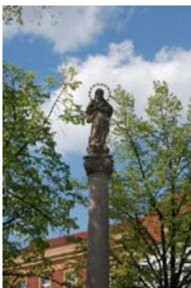
č. 67 Morový sloup se sochou Immaculaty