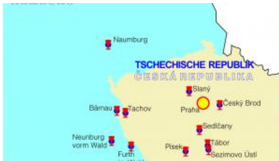
č. 279 Mapky Svazu Husitských měst