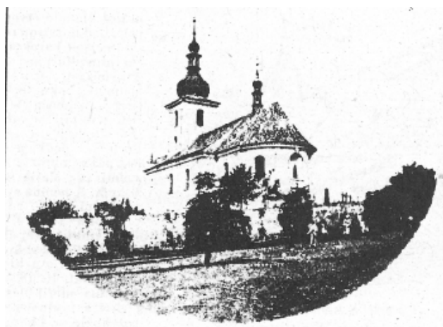
č. 58 "Církvička"