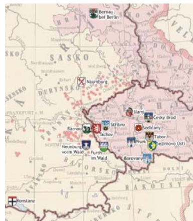
č. 279 Mapky Svazu Husitských měst