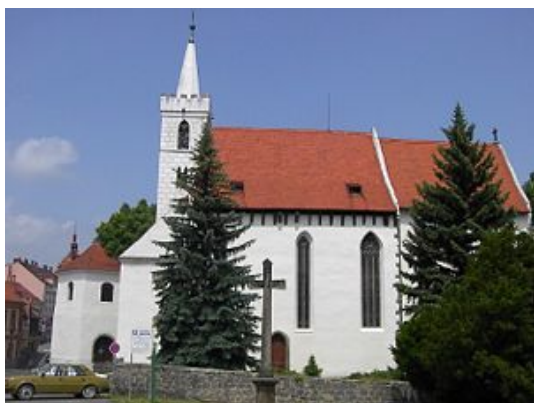
č. 62 Kostel sv. Martina