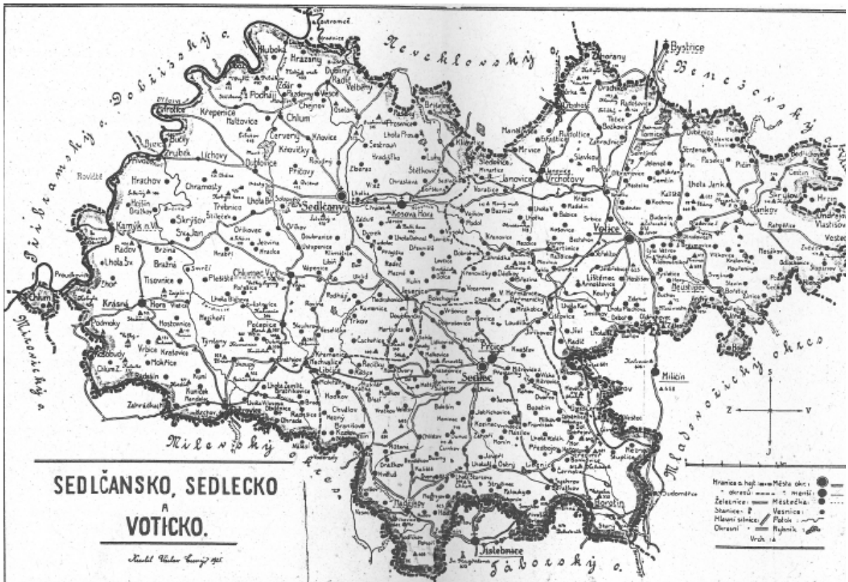
č. 75 Mapa Sedlčanska