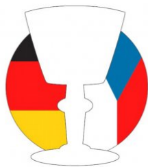
č. 280 Logo Svazu Husitských měst