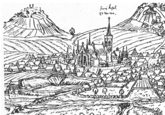
č. 65 Kostel sv. Martina, kresba z roku 1600