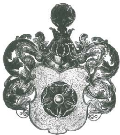
č. 50 Znak města Sedlčan