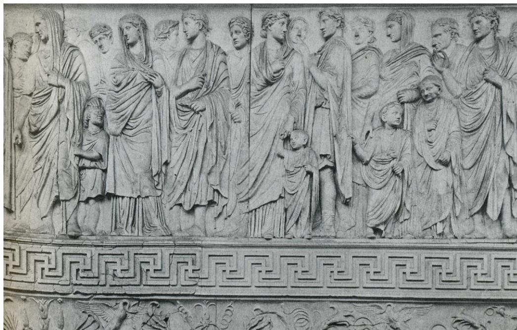
Ara Pacis Augustaea – oltář Míru Augustova : detail slavnostního průvodu.