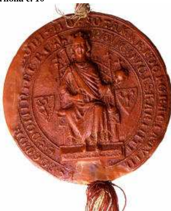
Majestátní pečeť Přemysla Otakara II.