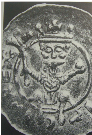
Denár Vratislava II.