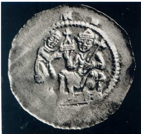
Denár Vladislava II.