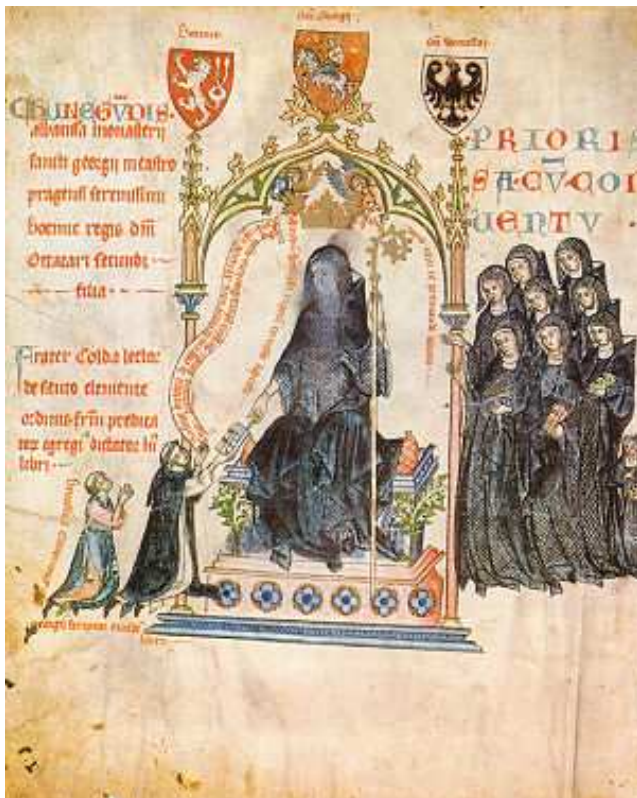
Pasionál abatyše Kunhuty, 1313-1321