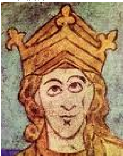
Vratislav II. na stěně Znojenské rotundy