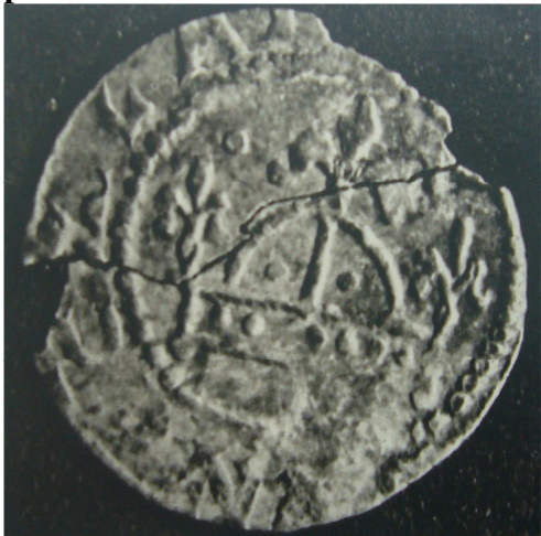
Denár Václava I.