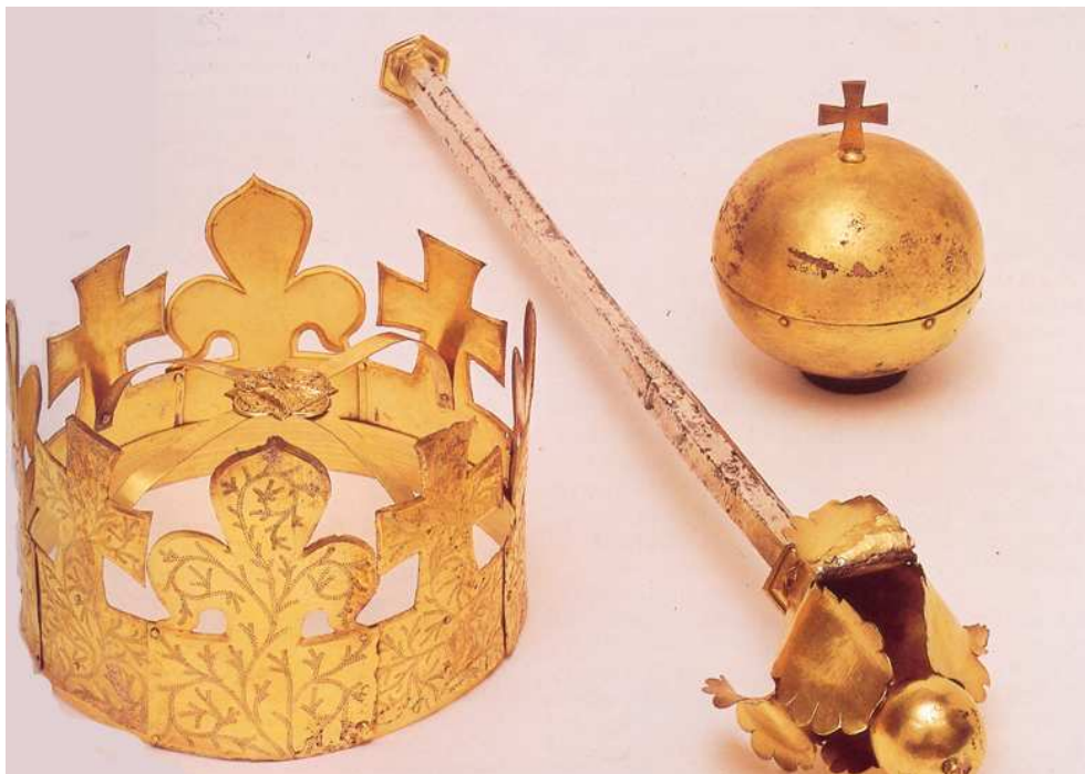
Pohřební regálie- koruna, žezlo a jablko- Rudolfa I. byly nalezeny v roce 1870 v kapli sv. Kříže