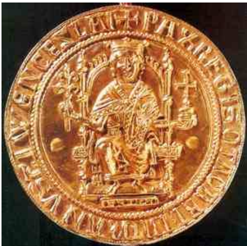
Zlatá pečeť Přemysla Otakara I.