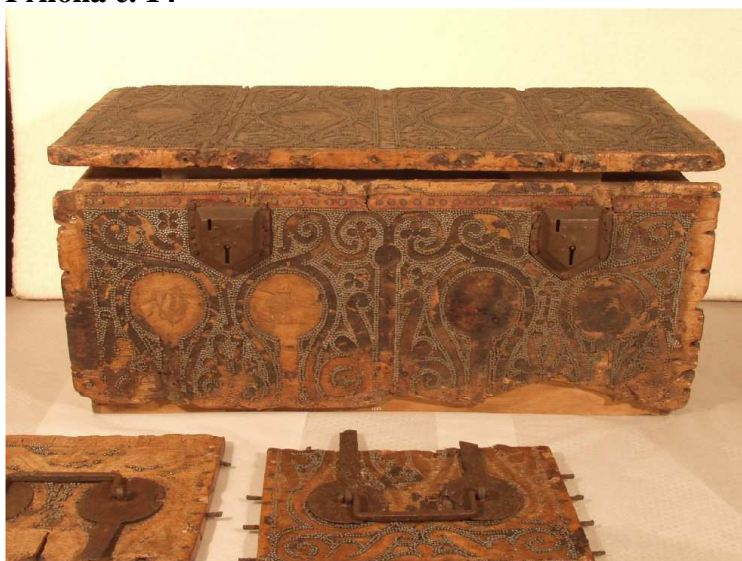
Dřevěná románská truhla Konráda II. Oty