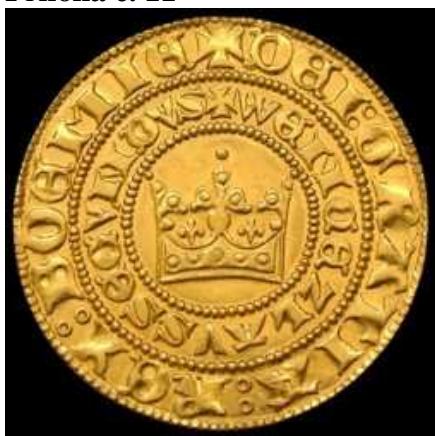
Pražský groš Václava II.