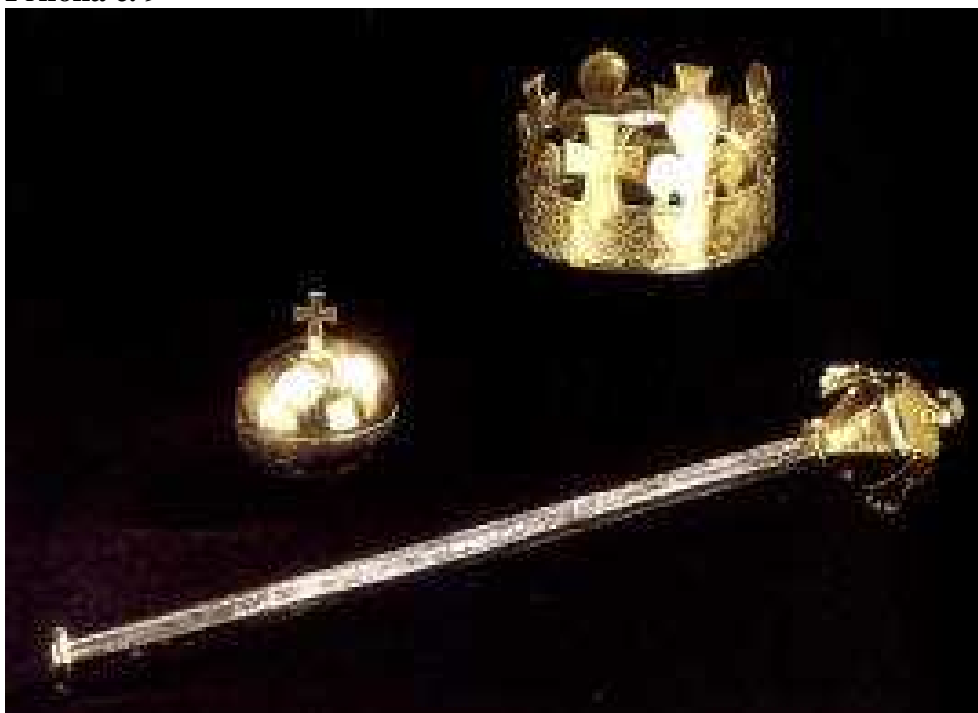
Královské pohřební insignie Přemysla Otakara II. byly objeveny v dnešní Saské kapli na Pražském hradě v roce 1976