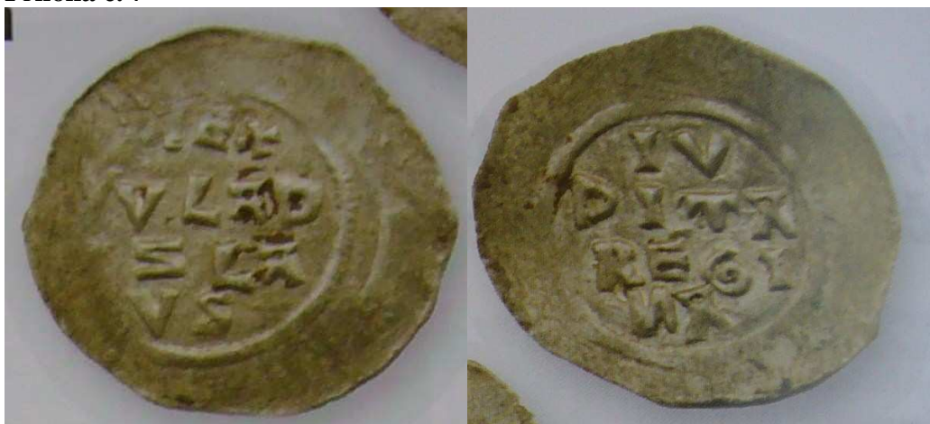
Korunovační denáry Vladislava II. s nápisy REX WLADIZLAVS (král Vladislav) a IVDITA REGINA (Judita královna)