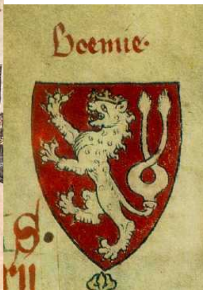
Detail erbu českého krále