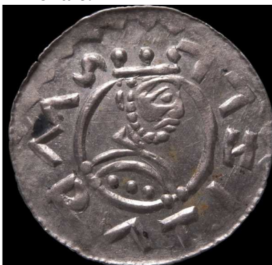
Denár Vratislava II.