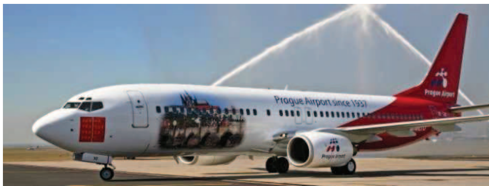
Obrázek 2: Reklama Letiště Praha na letadle společnosti Travel Service k oslavě výročí 70 let od založení letiště (na ocasu stroje je vidět starší verze loga Letiště Praha používaná do roku 2008)