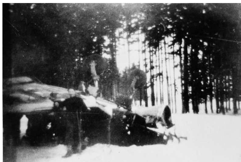
Letecká havárie u Nového M sta na Morav - Junkers Ju 87 Stuka 11