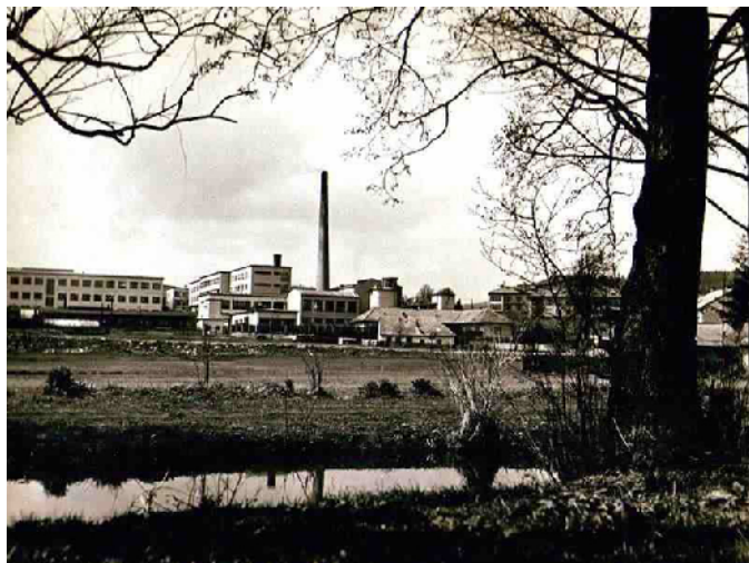
Areál novom stské nemocnice (1955) 3