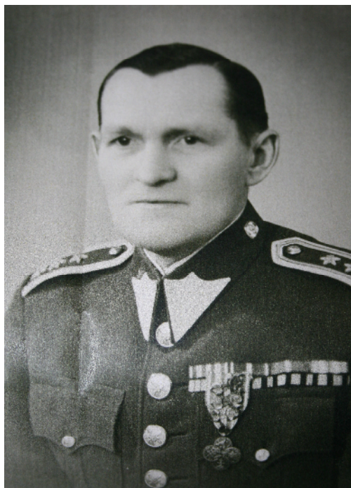
Generál Svato 24