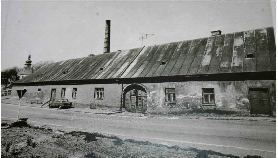
Novomstský lihovar - strategický bod odboje 22