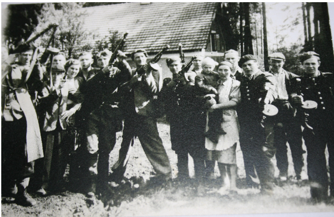
Partyzánský oddíl oslavující konec války 26