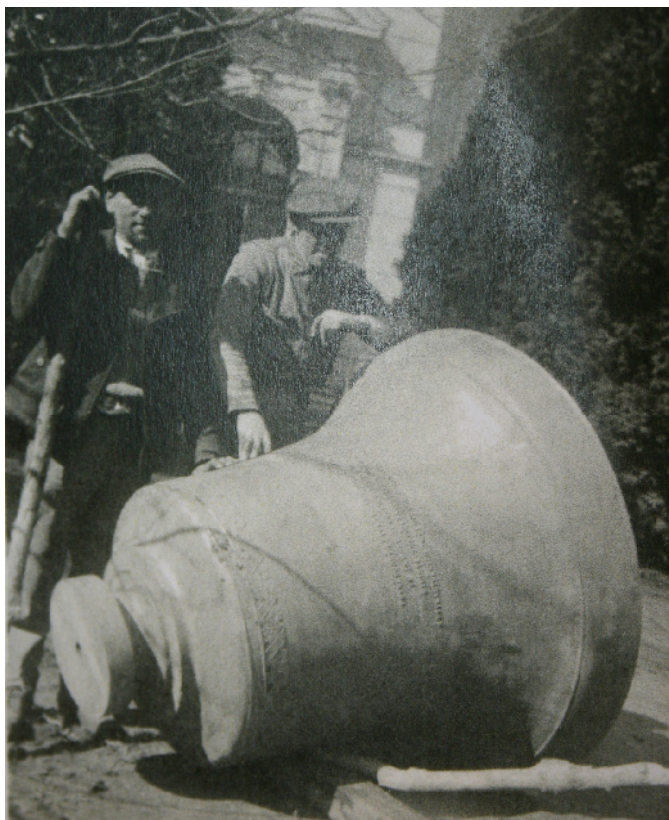
Odstranění zvonů z katolického kostela sv. Kunhuty v roce 1942 10