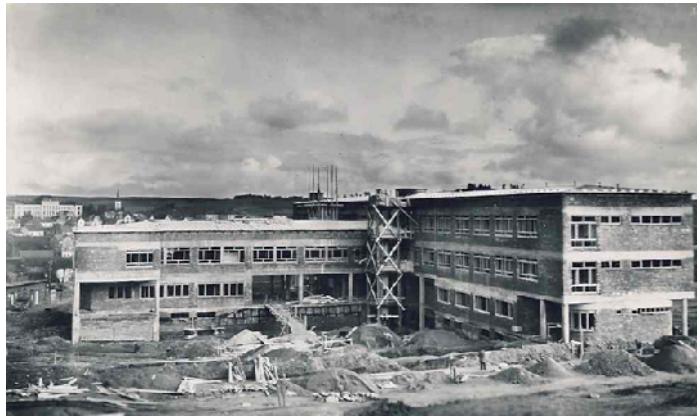
Stavba hlavního pavilonu novom stské nemocnice (1938-1939) 1