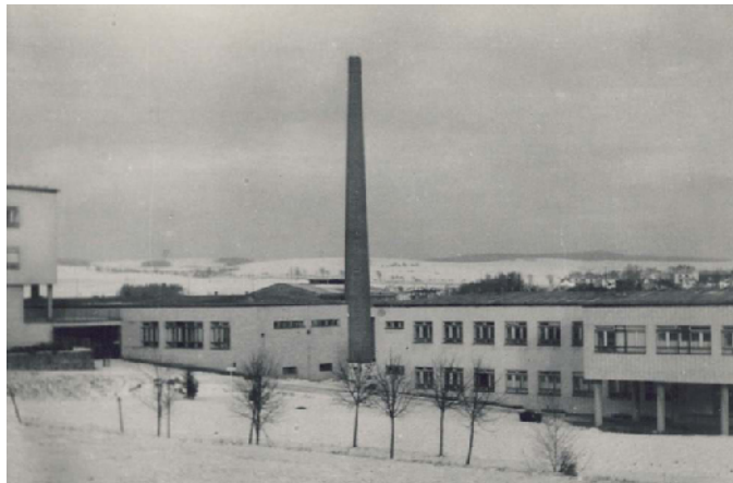
Interní pavilón (sest ínec), kotelna a prádelna (1951) 2