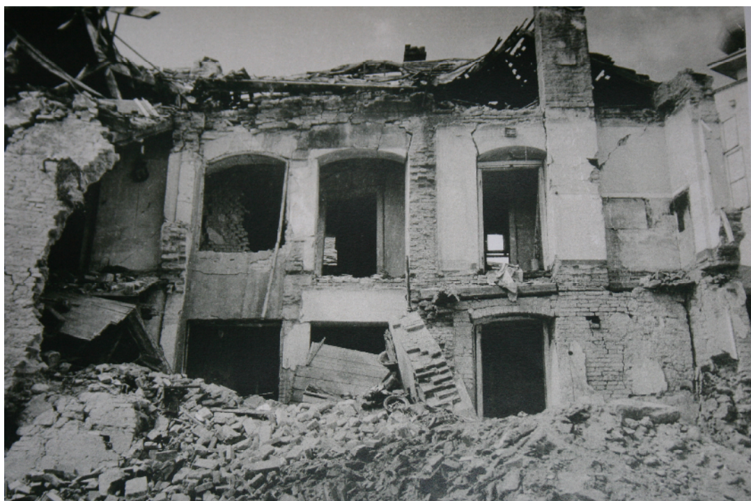
Bombardování Nového Města 9. května 1945 27