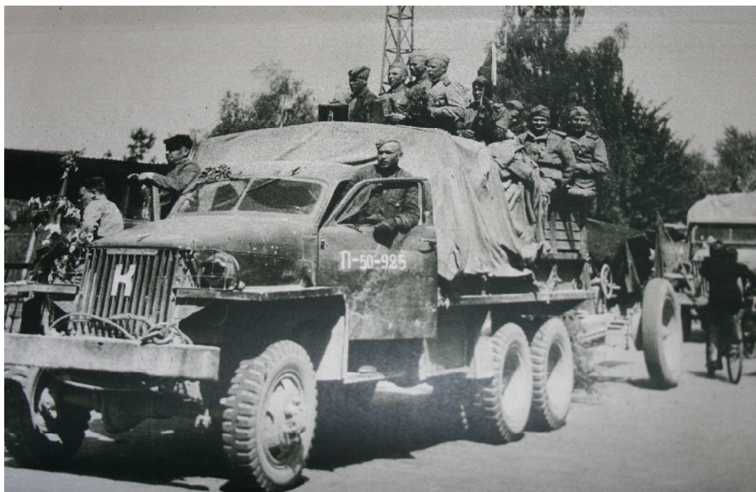
P íjezd Rudé armády 29