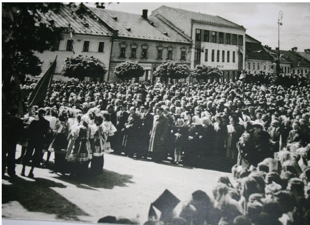
Oslavy osvobození a p ivítání Rudé armády 31