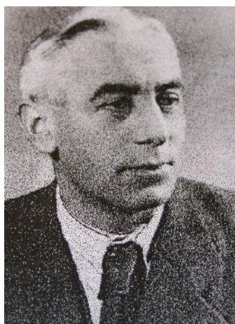
Metoděj ejka 18