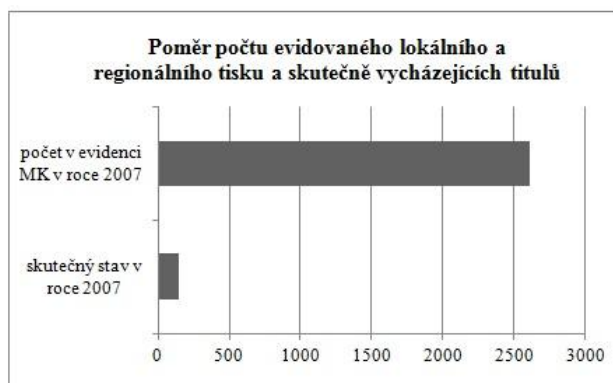
Obrázek 9: Výpis z evidence Ministerstva kultury 7