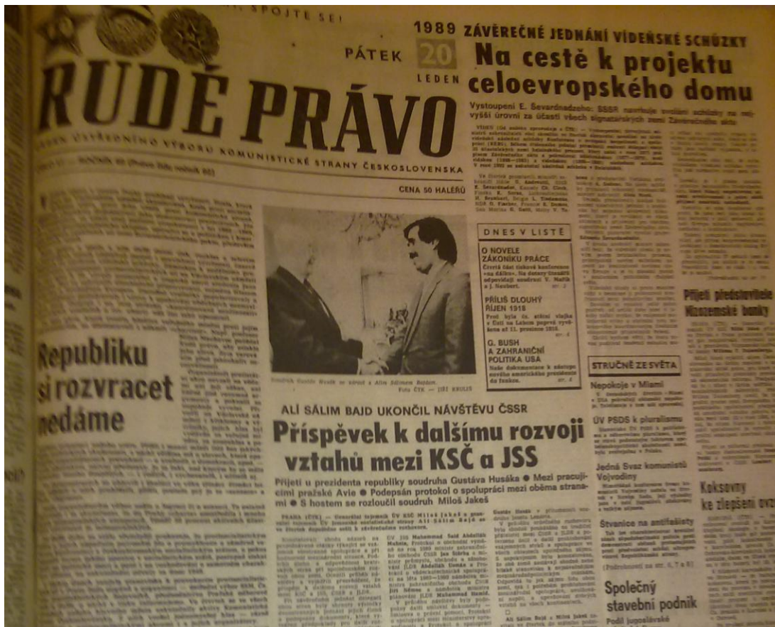
Příloha č. 2: Titulní strana Rudého práva z 20. ledna 1989 (obrázek)

Pozn.: jedná se pouze o ilustrační příklad, relevantní by bylo srovnání příspěvků ve dvou denících, nikoliv deníku a měsíčníku – klasický opoziční deník neexistoval, proto jsem vybral měsíčník Lidové noviny.