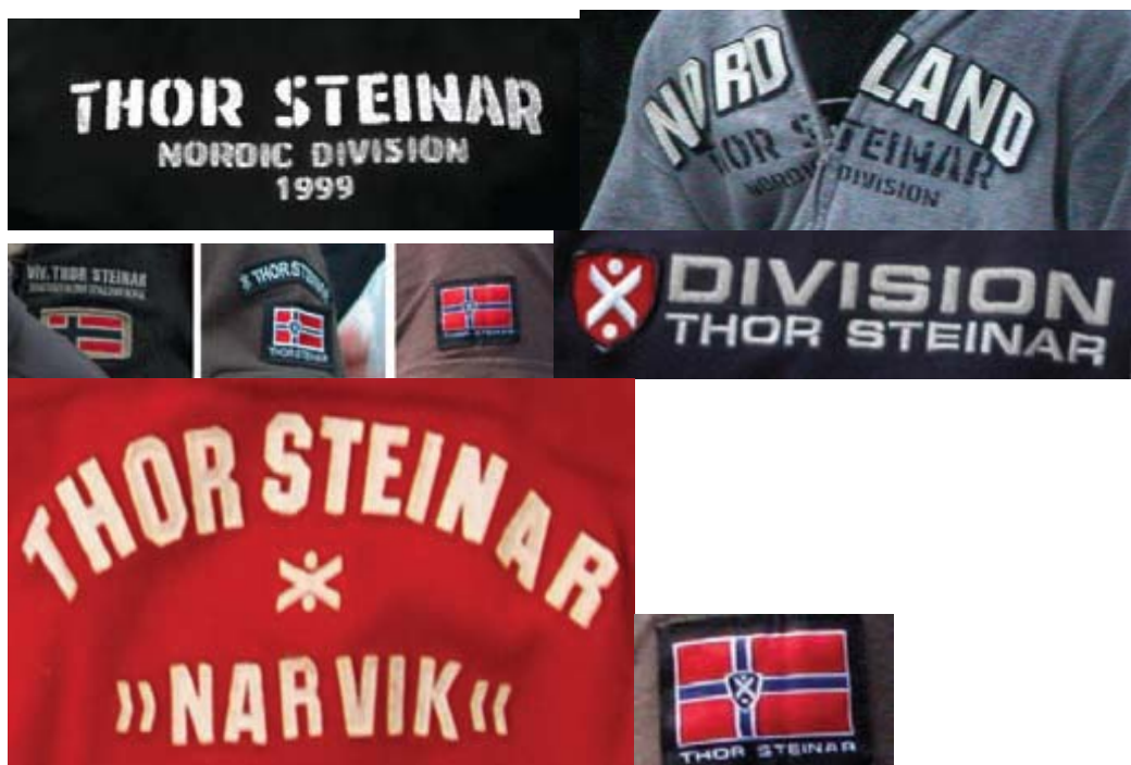
Příloha č. 6: Thor Steinar (obrázky)