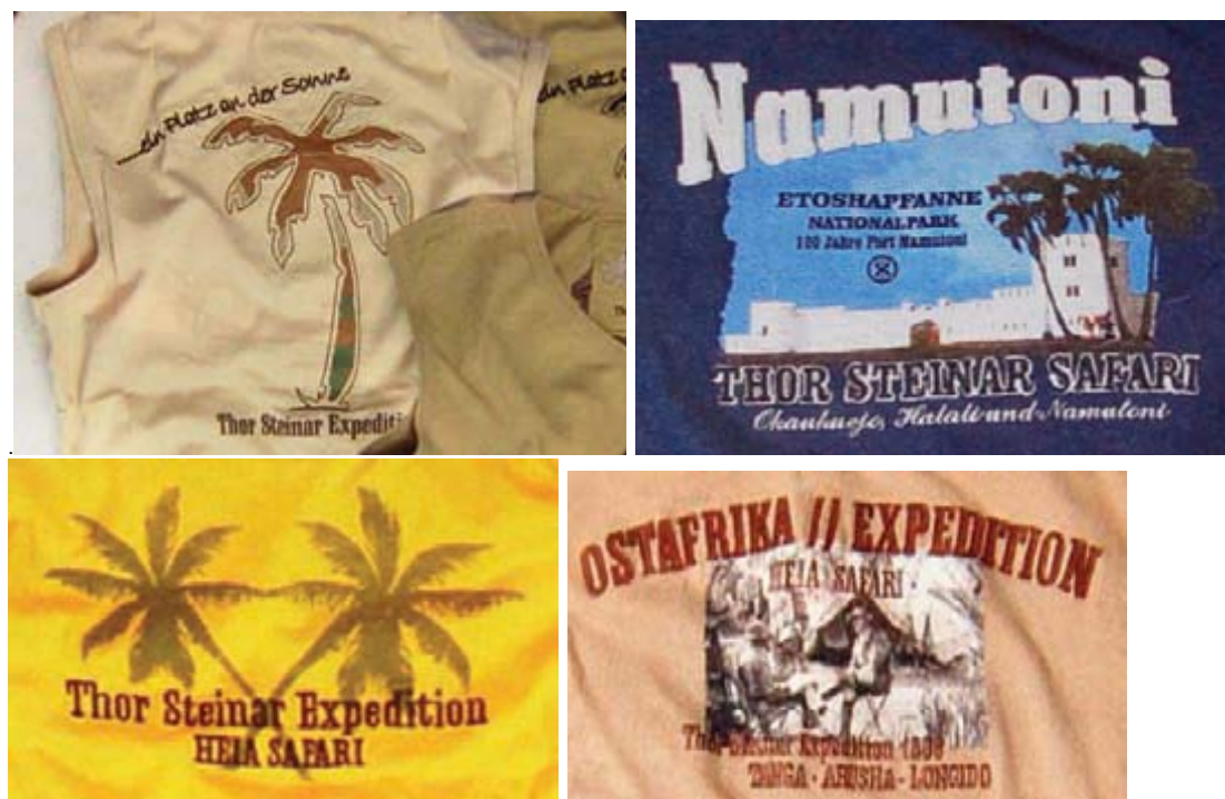
Příloha č. 7: Thor Steinar (obrázky)