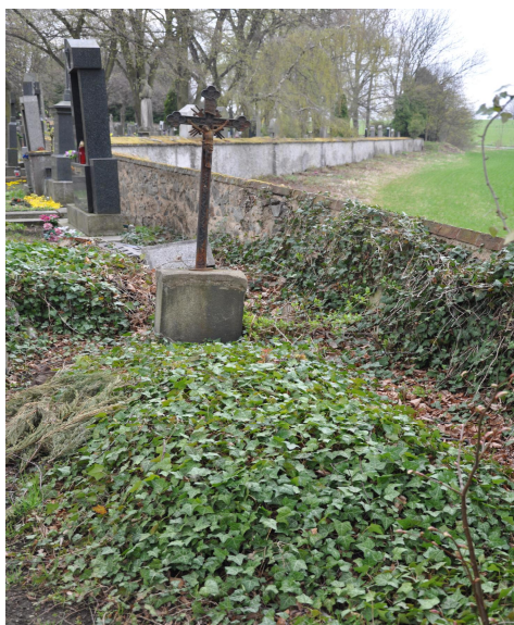
Hrob z roku 1885 v Jílovém u Prahy

S ohledem na to, že Navrátilová ve své knize hovoří o tom, že pohřební rituály jsou konzervativní a mění se málo, snažila jsem se zacílit své otázky tak, aby se dotkly rituálů, které by se i v dnešní době, kdy umírání a smrt probíhá mimo rodinu, mohly zachovat. Přesto rozloučení se zesnulým u otevřené rakve (dříve zcela samozřejmé), ve většině případů u popisovaných pohřbů neprobíhlo a pokud ano, tak pouze ve skupinách A a B.