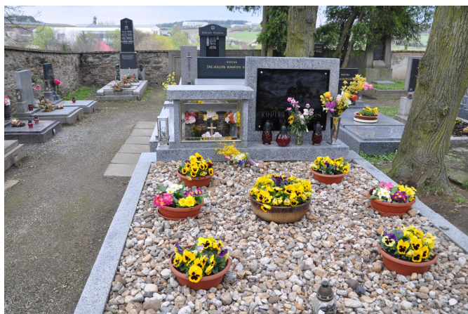
Sou asný hrob Jílové u Prahy

V dne-ní dob má odpov na otázku, po kolika dnech po úmrtí prob hl poh eb, malou výpov dní hodnotu z pohledu na rituály, které v období smrti a poh bu probíhají. T lo totifl musí být dle zákona 256/2001 Sbírky ulořeno v chladícím za řzení, kontakt s t lesnými poz statky není tedy mořlný. Termín poh bu se pak stanovuje podle toho, jak vyhovuje poz stalým, p řpadn podle volného termínu v krematoriu.