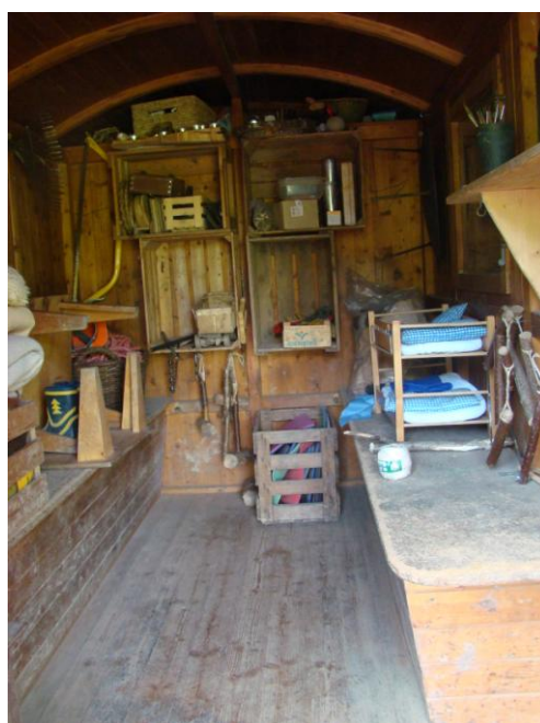
Obrázek 6 Dílna LMŠ Včelín, vybavení