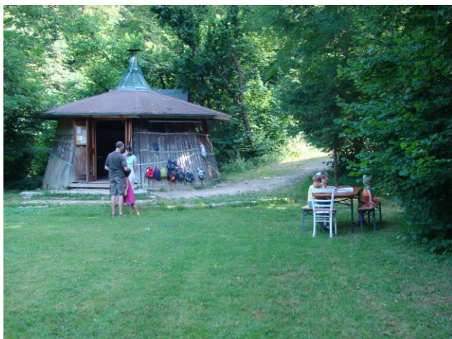
Obrázek 1 Dřevěná chata zázemí LMŠ Günterstal