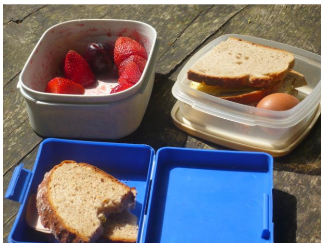
Obrázek 18 Zdravé svačiny