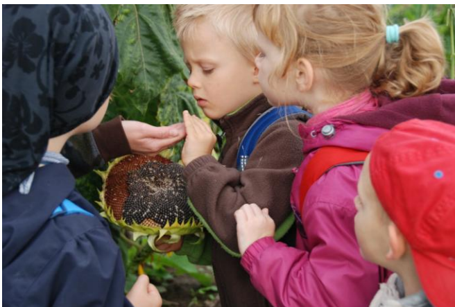
Obrázek 23 LMŠ Lesníček - činnosti