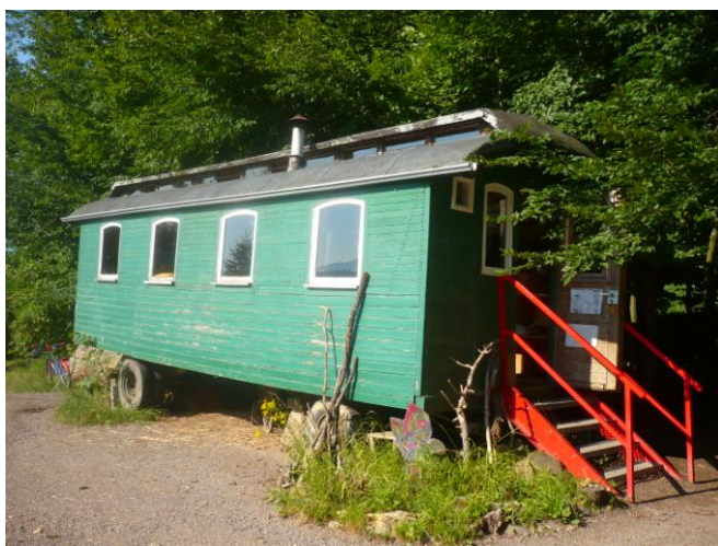
Obrázek 3 Zázemí LMŠ Cirkusový vůz