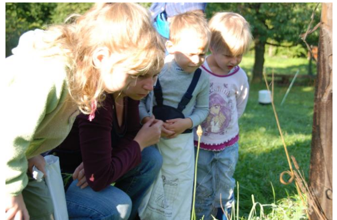
Obrázek 24 LMŠ Lesníček - činnosti