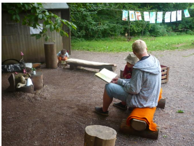
Obrázek 11 Čtení po zakončení ranního kruhu LMS Včelín