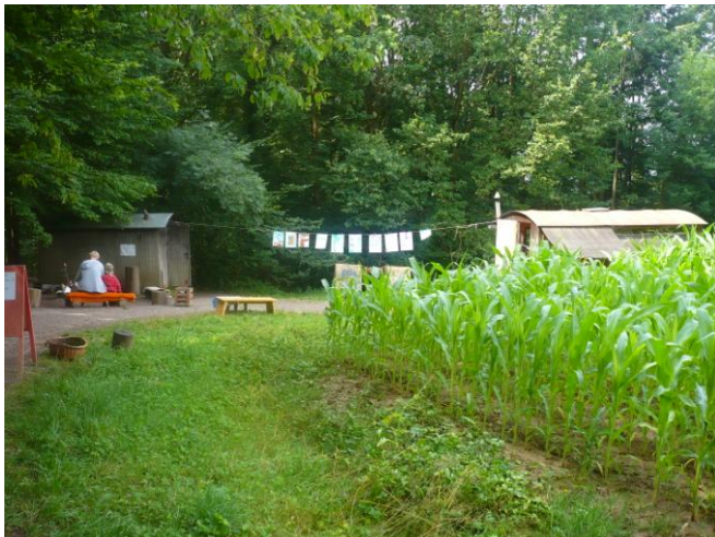
Obrázek 7 Pohled na LMS Včelín