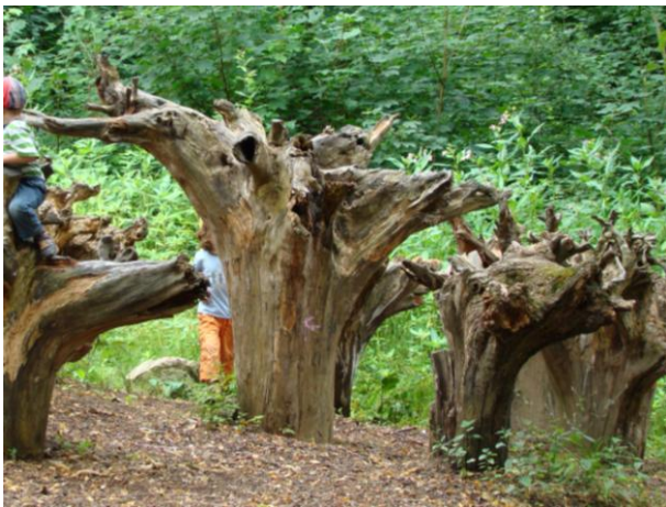
Obrázek 21 Lezení po stromech – hřiště v přírodním stylu