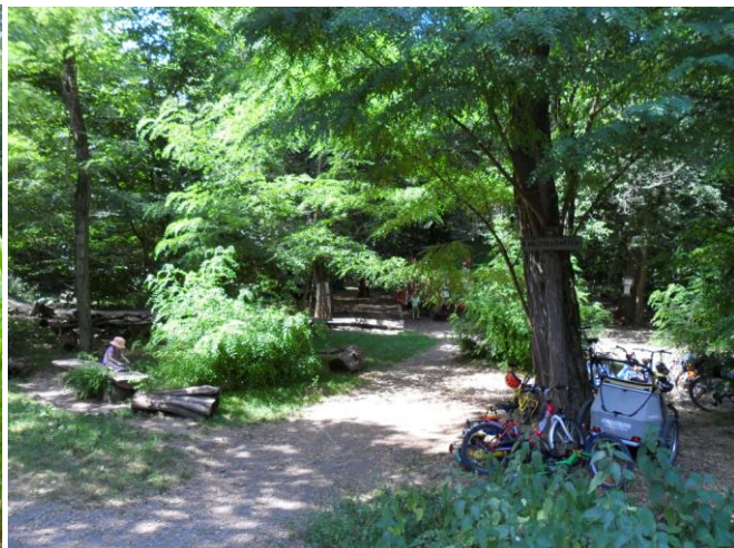
Obrázek 8 Parkování dopravních prostředků LMS Mechový les