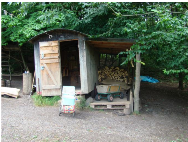
Obrázek 5 Dílna LMŠ Včelín