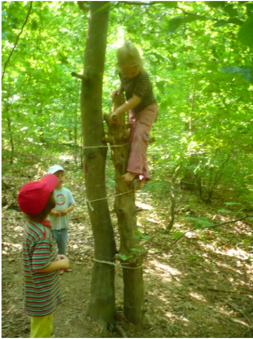
Obrázek 19 Vyhledka LMŠ Cirkusový vůz