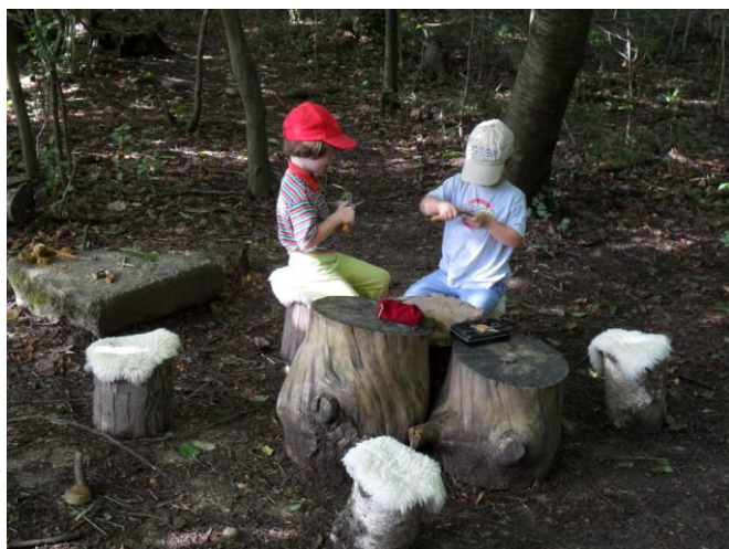
Obrázek 16 Místo na práci s nožem