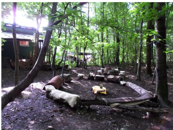
Obrázek 9 Ohniště, místo na společné povídání