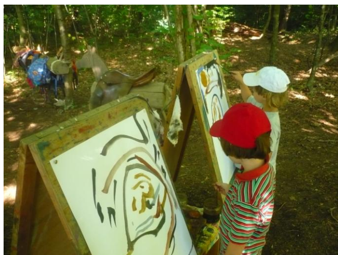
Obrázek 12 Malování, LMS Cirkusový vůz