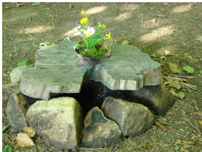
Obrázek 10 Urostřed nebývá jen ohniště