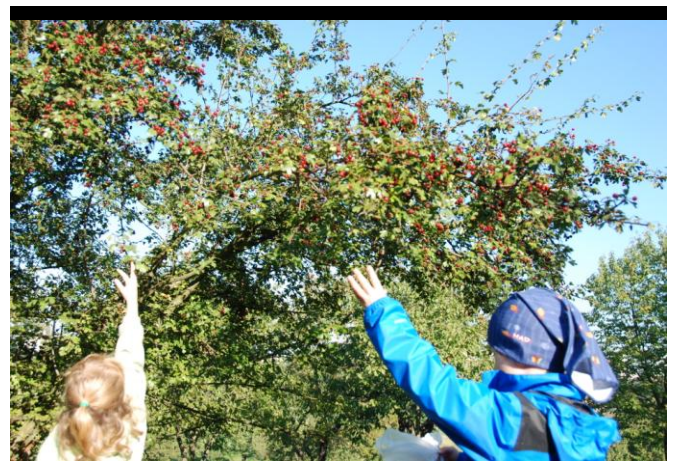
Obrázek 22 LMŠ Lesníček - činnosti