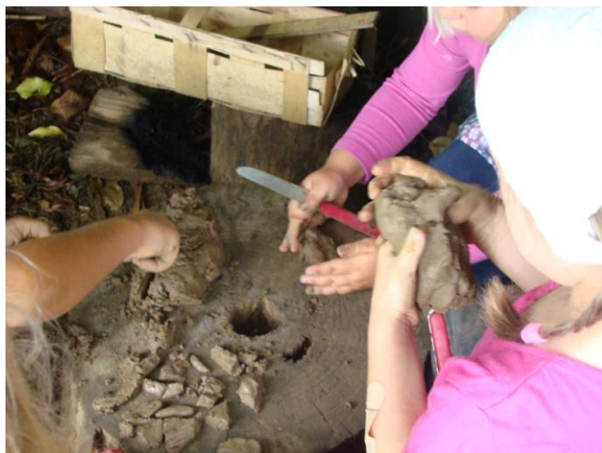
Obrázek 14 Práce s hlinou