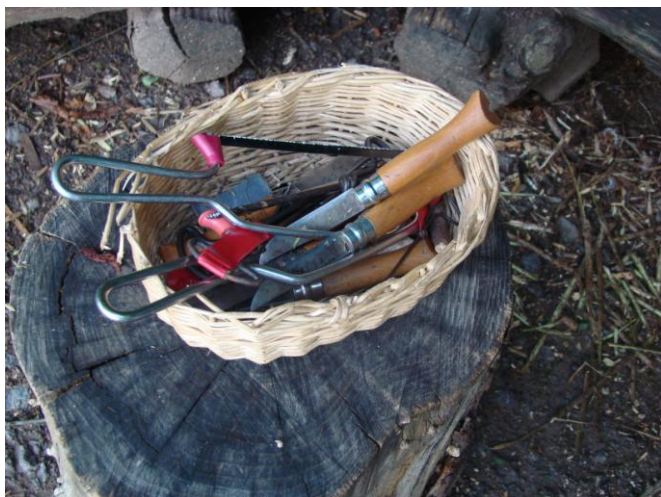
Obrázek 13 Ruční nářadí