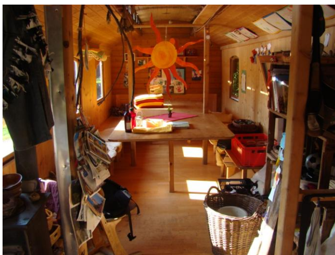
Obrázek 4 Vybavení maringotky LMŠ Cirkusový vůz