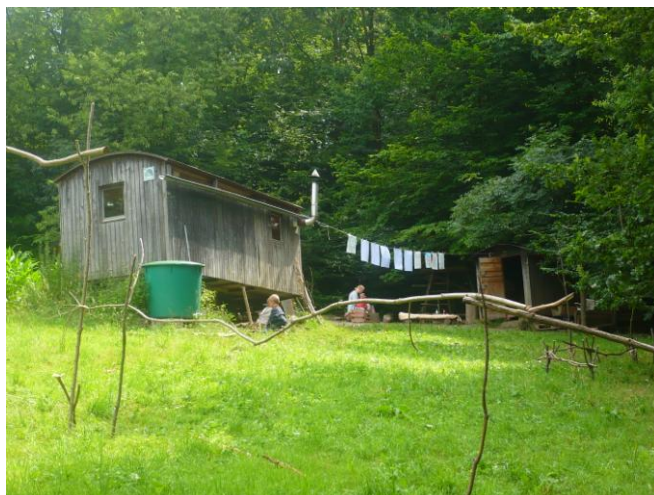
Obrázek 2 Zázemí LMŠ Včelín