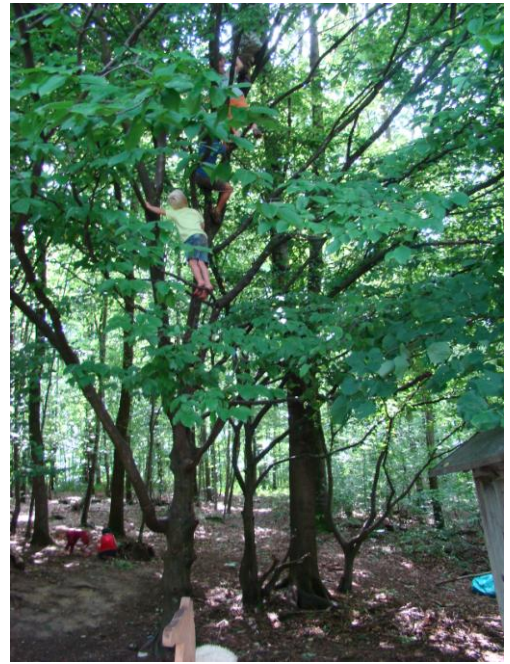
Obrázek 20 Lezení po stromech LMŠ Včelín