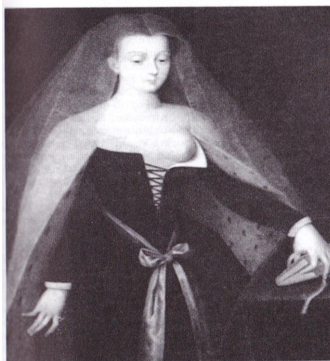
Na obrázku je první opravdová francouzská kurtizána Agnes Sorelová, která sloužila králi Karlu VII.