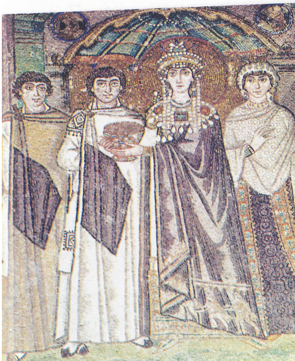
Na obraze můžeme vidět Theodoru a Justiniána.