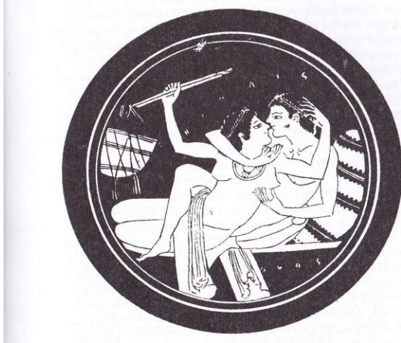
Nádoba se zobrazením řecké hétery a mladého Atěňana.