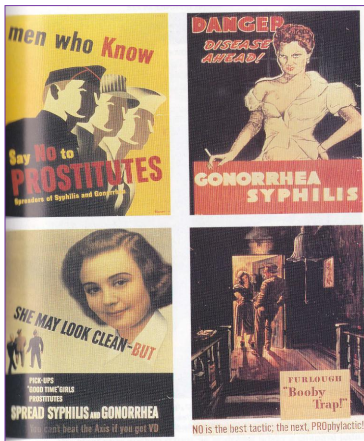
Obrázek č. 6 Plakáty varující proti epidemii syfilis

Na plakátech je zastrašující tematika, která měla varovat proti využívání komerčních sexuálních služeb z důvodu epidemie syfilis. Je z období 2. světové války.