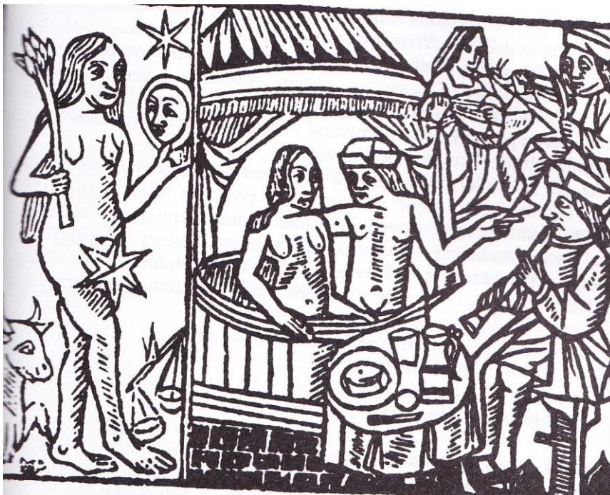
Dřevořez z období středověku., kdy je prostitutka zobrazena s klientem v lázni.