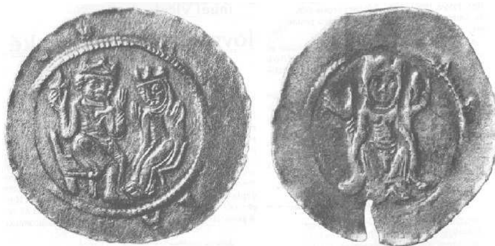
Obr. 6 (vlevo). Vladislav II. a Judita na denáru z doby před rokem 1174.