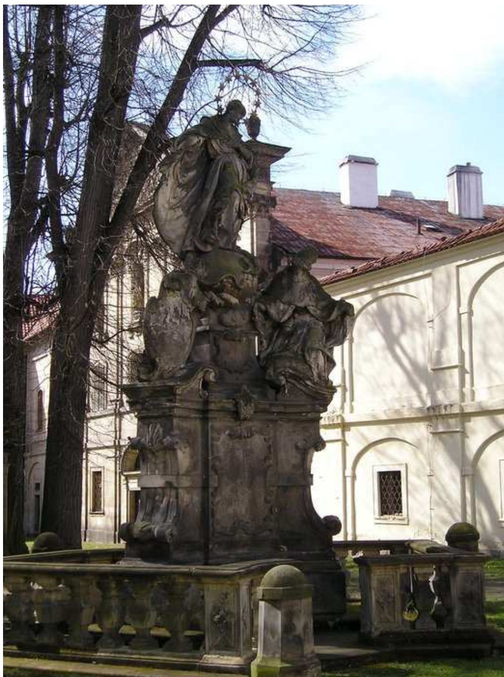
Obr. 4. Sousedí Panny Marie a Gertrudy Babenberské, klášter Doksany.