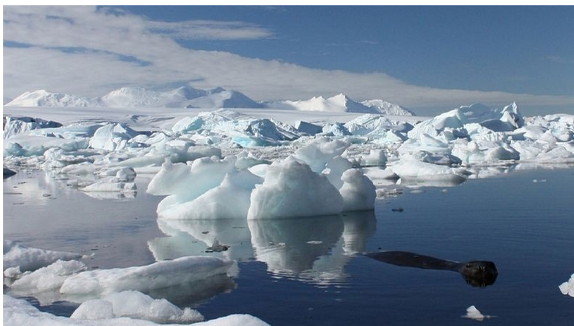
Obraz č. 10 – další vliv klimatických změn, tání ledovců...