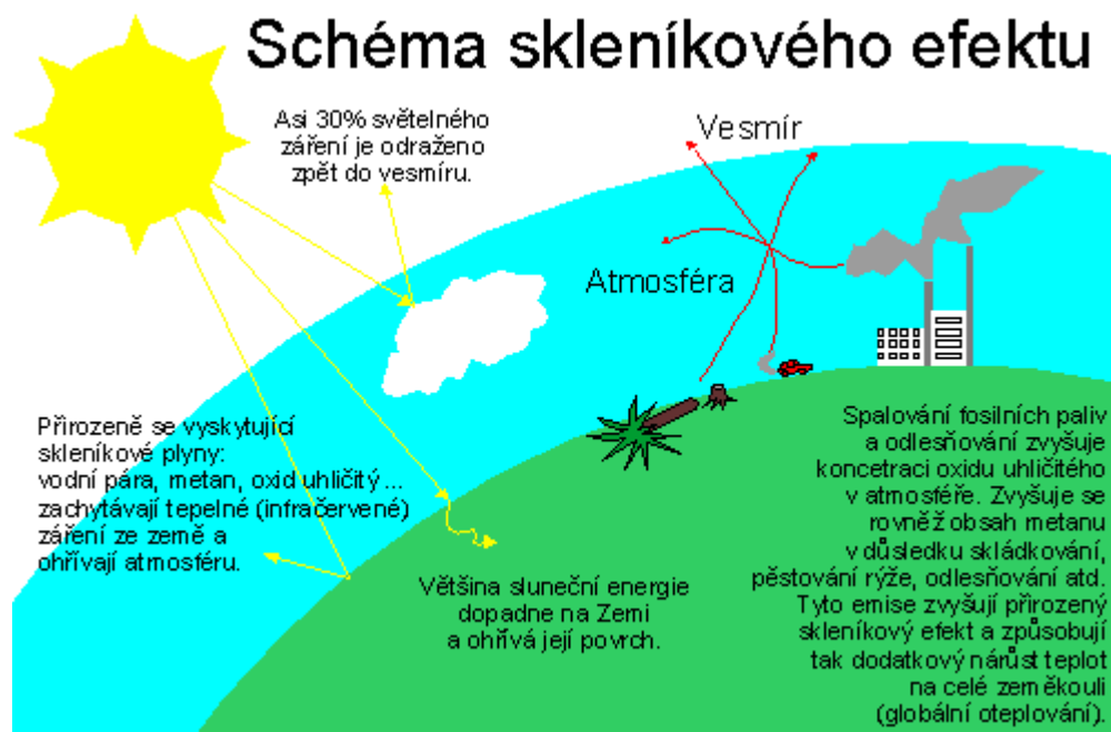
Obraz č. 8 – znázornění vzniku skleníkové efektu