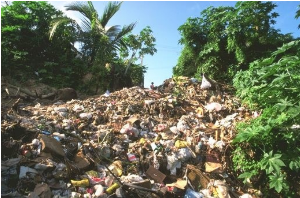
Obraz č. 1 – Odpady, které zaplavují svět