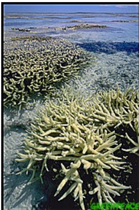
Obraz č. 9 – vybělený korál – důsledek klimatických změn