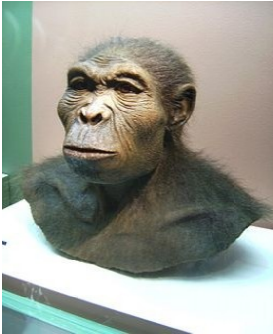
Obraz č. 4 – Homo habilis (člověk zručný)