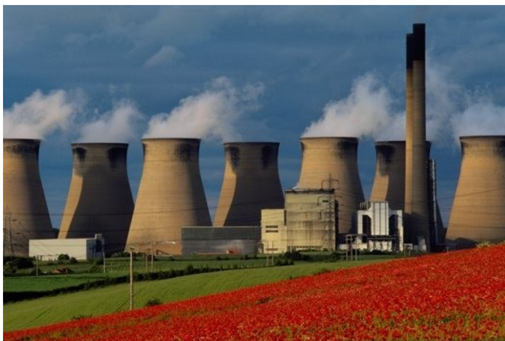
Obraz č. 6 – Komíny mohutně znečišťující životní prostředí Dostupné z http://www.petulina.euweb.cz/galerie