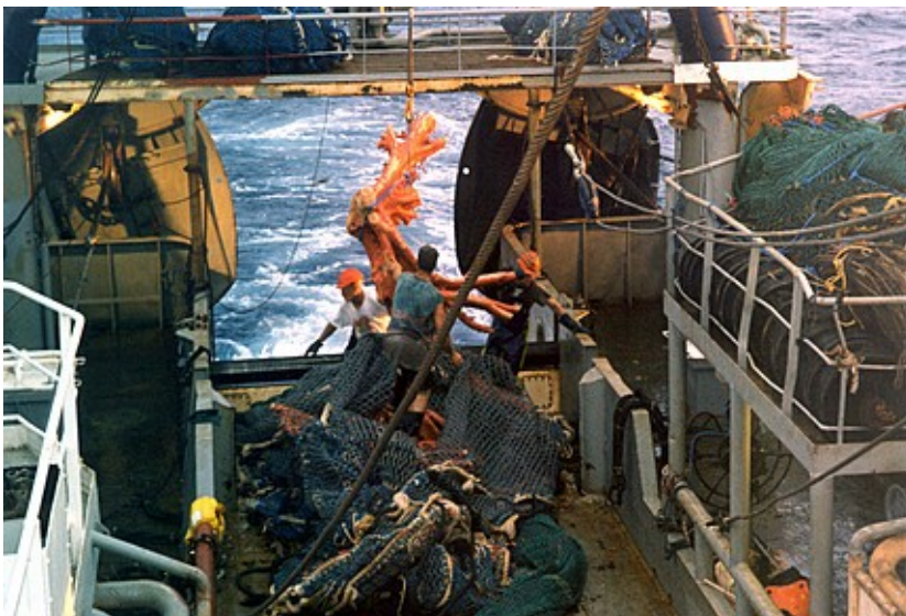
Obraz č. 2 – na fotografii, kterou pořídil pracovník novozélandského ministerstva rybolovu, je vidět velký kus hlubokomořského červeného korálu, který byl vytržen z hlubokomořského dna při rybolovu pomocí vlečné sítě.