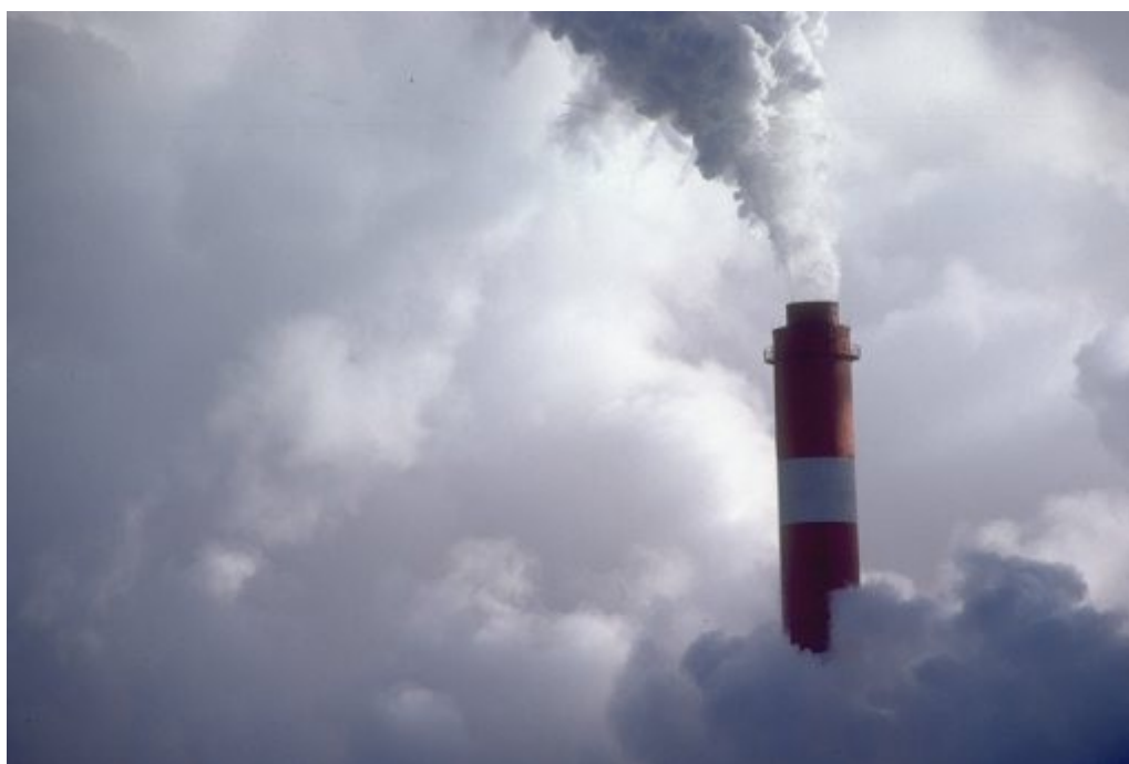
Obraz č. 7 – jedním z častých obrázků moderní doby