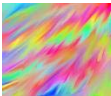
Obrázek č.3, Barevné spektrum

Barvy účinkují vnitřní i vnější vazbou významy i obsahy předmětů, ve výtvarné a společenské situaci, ve které se nacházejí. Barvy mají také určující charakter. Je mnoho případů, kdy situace jsou definovány světem barevných předmětů, což se zejména úspěšně využívá v divadle i ve filmu, kde stačí k charakteristice situace pouze detail barevného předmětu. Podstata barevného vjemu u člověka byla z hlediska psychofyzilogického dovršena teprve v posledních letech. Vedle poznávací složky má barva velmi silnou složku pocitovou. Barva ( obr. č. 3 ) je nositelem významu, obsahu, nositelem hodnot duchovních a symbolických, nositelem citových stavů, bezprostředním zdrojem radosti a potěšení, je nositelem výtvarných hodnot.