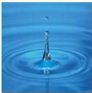
Obrázek č.4, Vodní hladina

Z běžné zkušenosti jsme si zafixovali vnímat barvy ve vztahu k předmětům . Často předmětům přisuzujeme barvy jako jejich objektivní vlastnost a proto i podle barvy předmětu též často odhadujeme jeho vlastnosti (červené rajske jablko je zralé, zelené nezralé, hnědé jablko je shnilé, červené vejce je patrně nabarvené atp.). Barvu předmětu často i přeneseně používáme na nějakou obecnou vlastnost – protože nebe, moře či led (v silné vrstvě) se jeví jako modré, a oheň je většinou červený, oranžový, nebo žlutý, spojujeme si modrou s chladem, červenou a oranžovou s teplem. Není to ale asi tak zcela pravda – vezměme v úvahu např. to, že nejteplejší část plamene není ta červená, ale vlastně modrá, že studený sníh je přece bílý, nehledě na to, že vodní hladina ( obr. č. 4 ) bývá modrá díky odlesku modré oblohy v ní. Možná zde hrají roli i nějaké atavismy, zděděné po prapředcích.