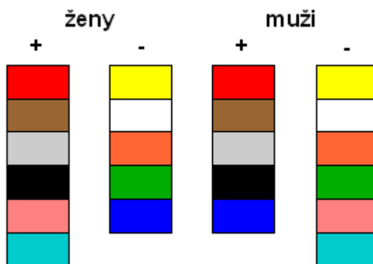
Obrázek č.5, Oblíbené a neoblíbené barvy žen a mužů

Pokud bychom srovnali oblíbenost jednotlivých barev u mužů a žen ( obr. č. 5 ), pak jako oblíbené barvy u obou pohlaví můžeme označit barvu červenou, hnědou, šedou a černou, naopak neoblíbenými barvami jsou žlutá, bílá, oranžová a zelená. Rozdílný pohled je na modrou (u mužů je oblíbená, u žen nikoli) a růžovou (oblíbená barva pro ženy a neoblíbená pro muže). Muži upřednostňují oranžovou před žlutou a modrou před červenou. Ženy naopak preferují červenou a žlutou barvu na úkor modré a oranžové. K barvám, kterým ženy dávají přednost, zatímco mezi muži nejde o příliš oblíbené barvy, patří také modrozelená.