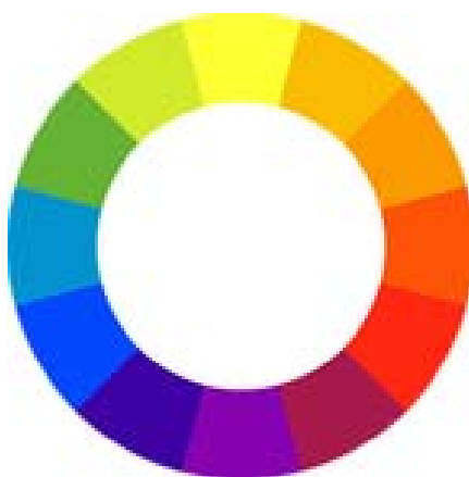
Obrázek č.2, Barevný kruh

To jsou ovšem zcela subjektivní zážitky, jaké se mohou obdobně vyskytovat v nejrůznějších životních situacích. A přece přitom nejde o nic jiného, než že onen charakteristický teplý a přívětivý záchvěv citu může přecházet skoro neznatelně do dalších citových zážitků, tentokrát už skutečně více méně subjektivních. Taková je lidská přirozenost! Ve většině případů je tomu u Goetha tak, že sice uvádí takovéto subjektivní pocity, ale přece jimi současně poukazuje na objektivní účinek barev na vnitřní život. Nejdůležitější Goethův poznatek je, že paletě viditelných základních barev odpovídá paleta vnitřních zážitků. A můžeme-li vzájemné vztahy základních barev vyjádřit tím, že tyto barvy uspořádáme do kruhu, v němž jedna přechází do druhé, platí to i pro jejich citové protějšky. Jako v takovém kruhu barev můžeme sledovat postupné přechody z jedné barvy do druhé, přecházejí naprosto obdobně i citové dojmy vyvolané barvami jeden do druhého. Goethův kruh barev (obr. č. 2) je tedy zkratkovité vyjádření vnější i vnitřní působnosti barev na člověka. A tento kruh je přitom v plném souladu s optickými, ryze fyzikálními poznatky, k nimž Goethe dospěl.