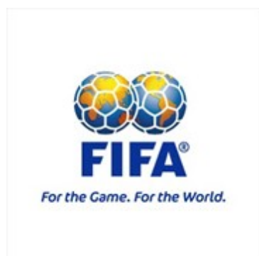
Příloha 1: Oficiální znak FIFA a UEFA