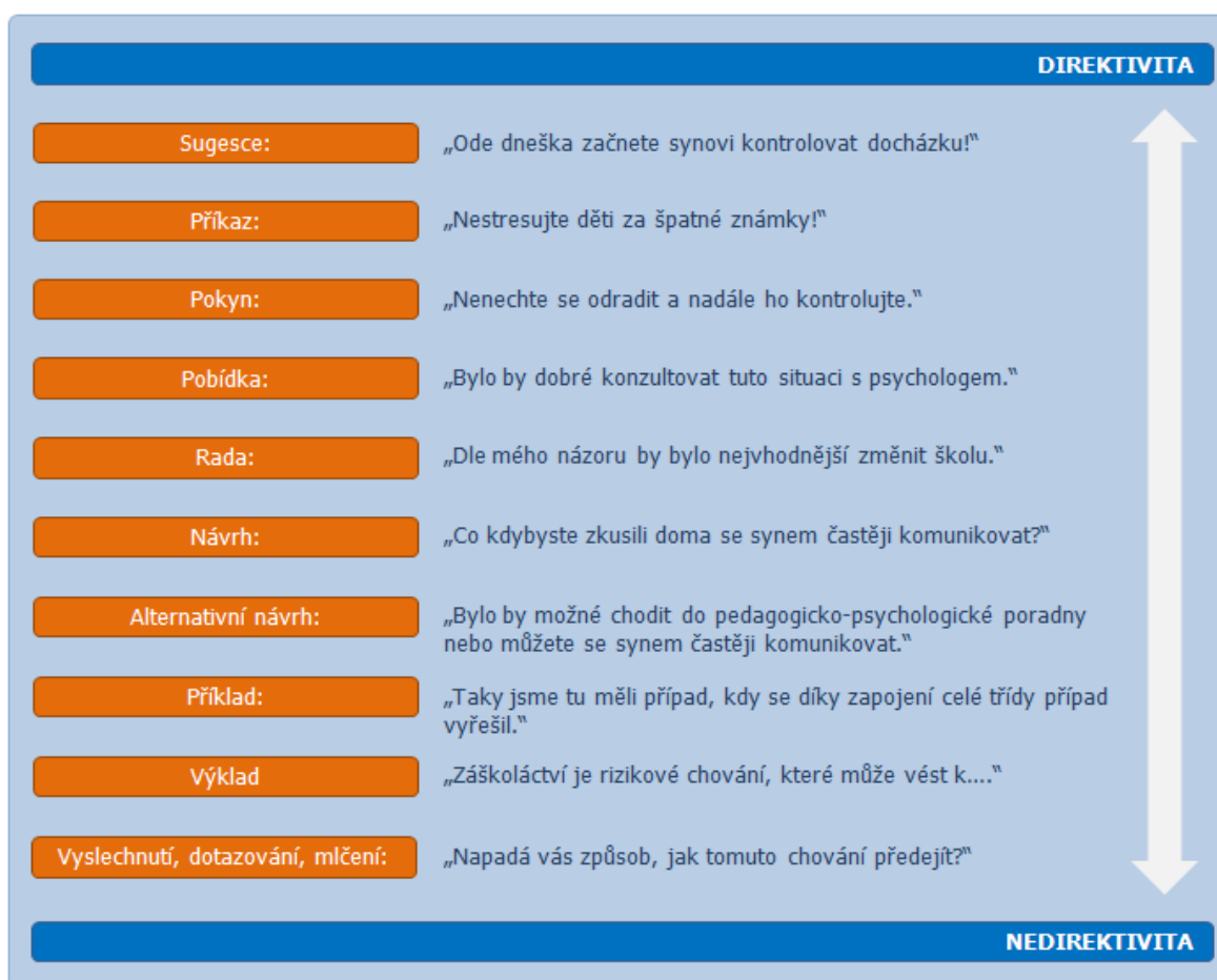
Schéma č.2: Škála direktivity podle Langmeiera (in Matějček, 1991 – upraveno)

Konkrétní příklady jednotlivých intervencí mohou vypadat např. takto: