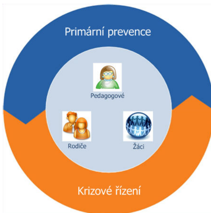
Schéma č.1: Schéma komplexního preventivního působení ve škole

především na oblast primární prevence rizikového chování, což je samozřejmě stěžejní. Právě efektivní primární prevence rizikového chování předchází samotné potřebě a následnému použití krizového plánu. Samotný krizový plán a aktivní krizové řízení se však zpětně mohou stát výraznou součástí preventivního působení (viz. Schéma č.1), především díky jeho správné interpretaci žákům a rodičům, zákonným zástupcům (dále jen rodičům), kdy jen pouhé vědomí a znalost krizového plánu může být efektivním primárně preventivním nástrojem. V současné době školy určitou podobu krizového plánu zapojují do svých Minimálních preventivních programů. Samotný pojem krizový plán se však v oblasti školství objevuje až v Metodickém pokynu ministra školství, mládeže a tělovýchovy k prevenci a řešení šikanování mezi žáky škol a školských zařízení (Č.j. 24 246/2008-6).