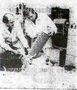
Příslušníci společné společnosti Vlastek a Křivky...