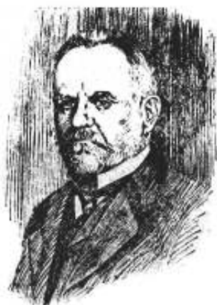
Theodor Zuleger senátor