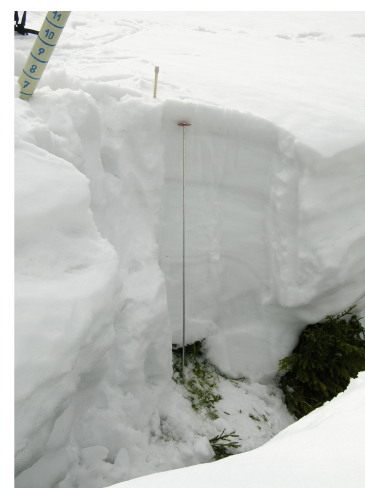
Kopaná sonda 4.4.2009