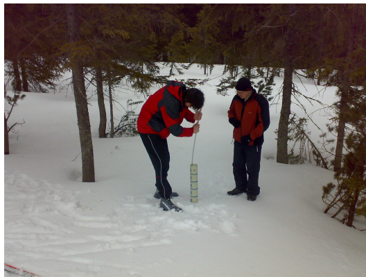
Rokytky 19.2.2008