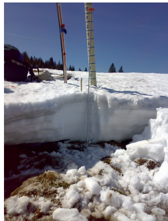
Kopaná sonda 4.4.2009, 12.4.2009 a 19.4.2009