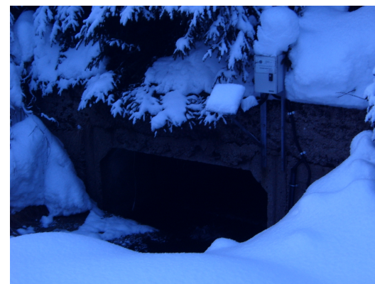
Hladinoměr 20.3.2009