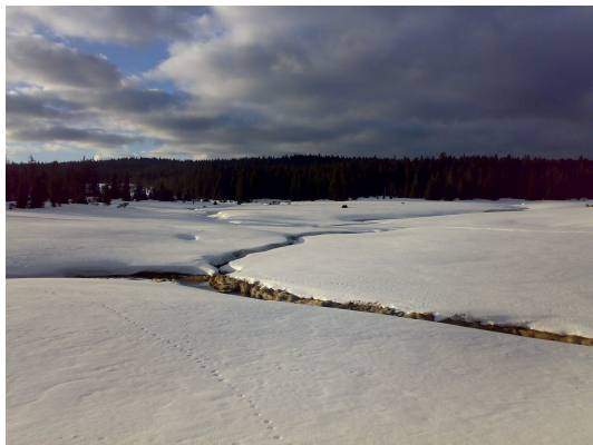
Rokytecká slať 19.2.2008