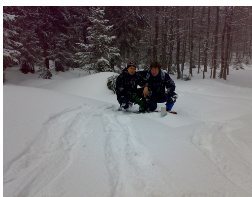
Hraniční sloupek 19.3.2009