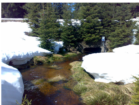
Hladinoměr 19.4.2009