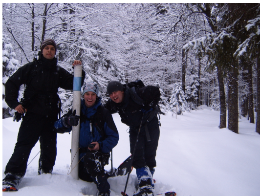
Hraniční sloupek 20.1.2009