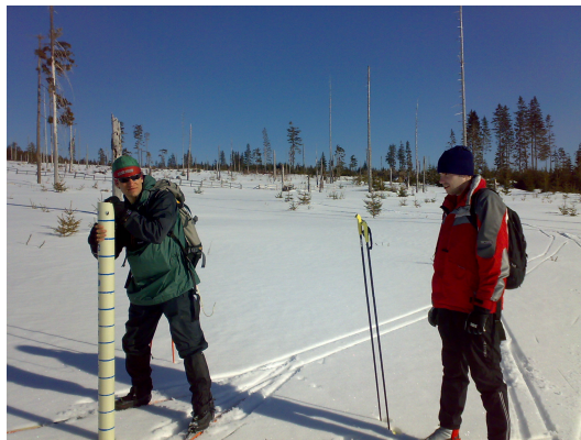
Černá hora 20.2.2008