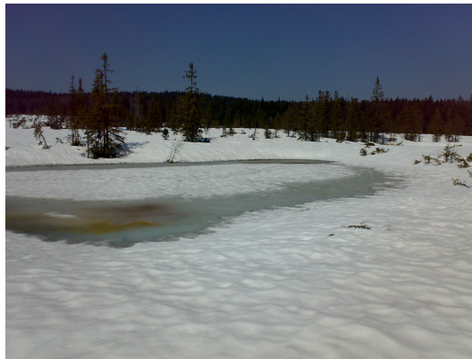
Rokytecká slať 12.4.2009