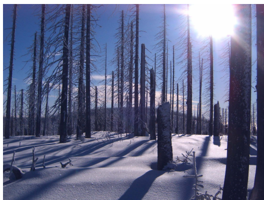
Malá Mokrůvka 21.1.2009