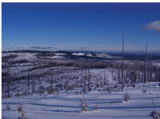
Malá Mokrůvka pohled na Černou horu