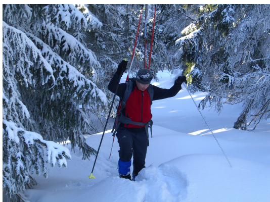
Černá hora 21.1.2009