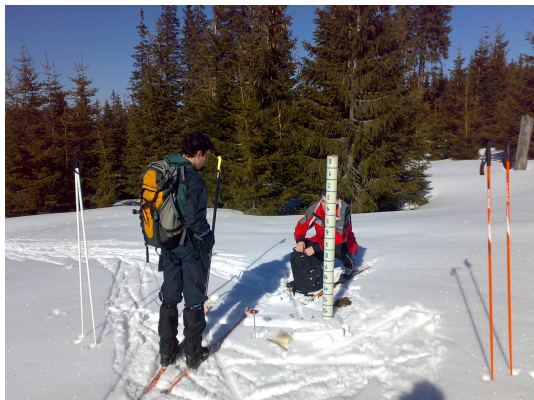
Černá hora 20.2.2008