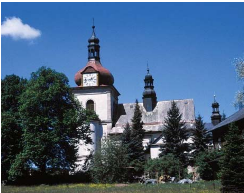
Kostel sv. Mikuláše v Horní Branné.

V ideálním případě žádný z farníků neměl zemřít bez zaopatření, netřeba dodávat, že úmrtím nezaopatřených jednotlivců se vyhnout nešlo.