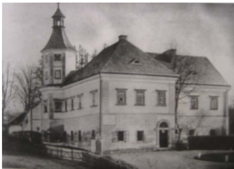
Renesanční jádro jilemnického zámku před přestavbou roku 1895.