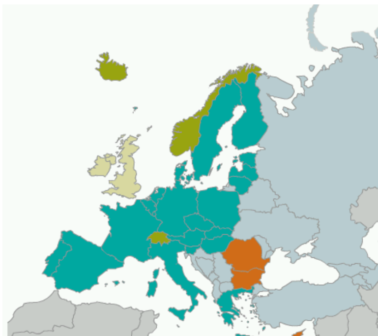
Obr. č. 3: Státy připojené k Schengenské dohodě v r. 2009

Na obrázku č. 3 je znázorněn stav v roce 2009: