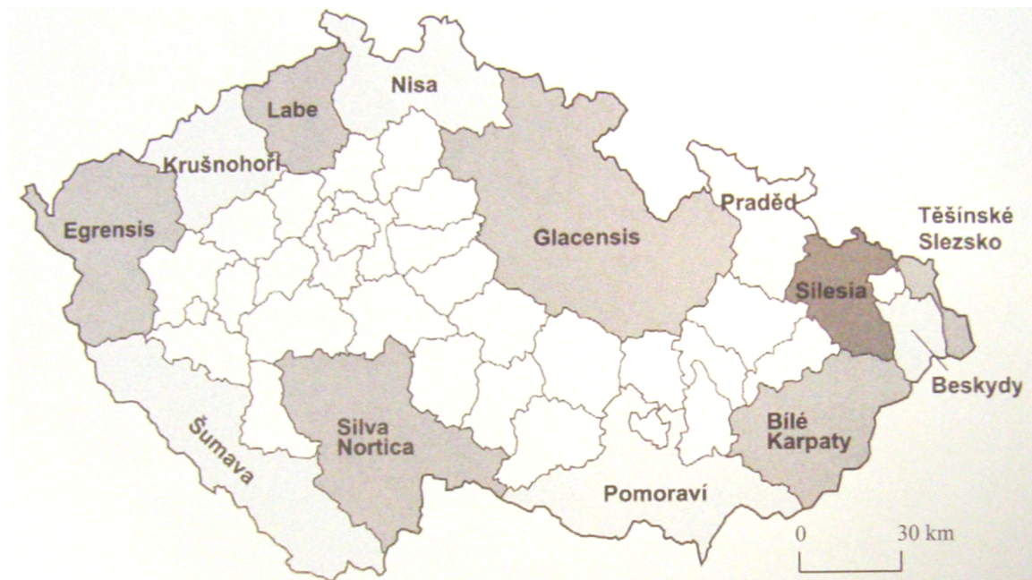
Obr. č. 2: Vymezení euroregionů na území Česka v roce 2007