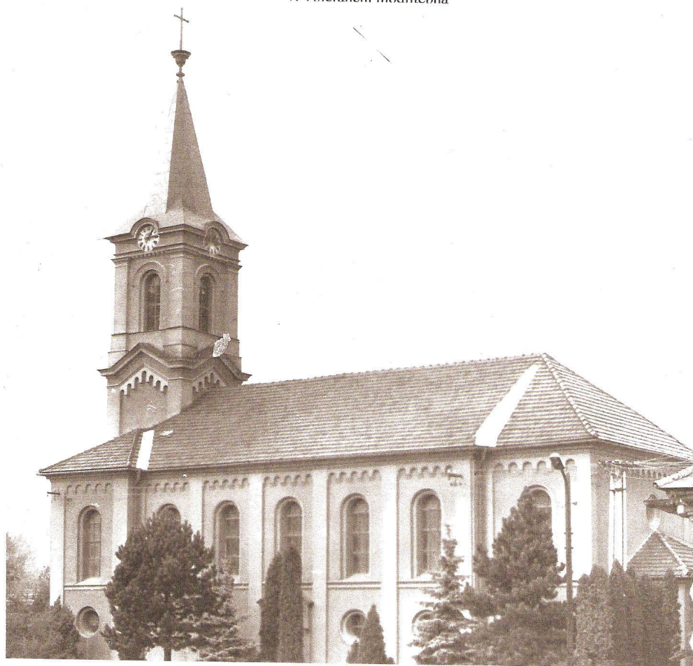
2. Evangelický kostel v Huslenkách