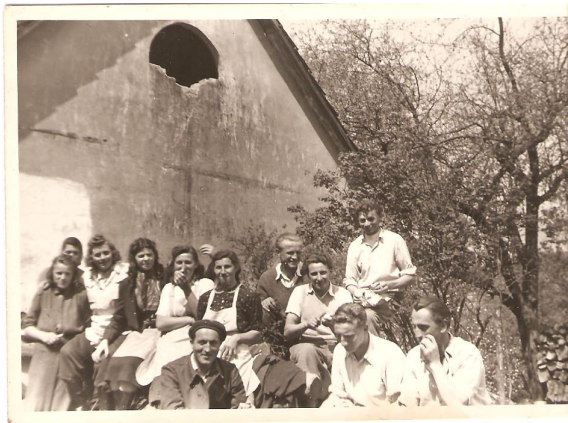
7. – 8. Brigádnické práce při přestavbě fary v 50. letech