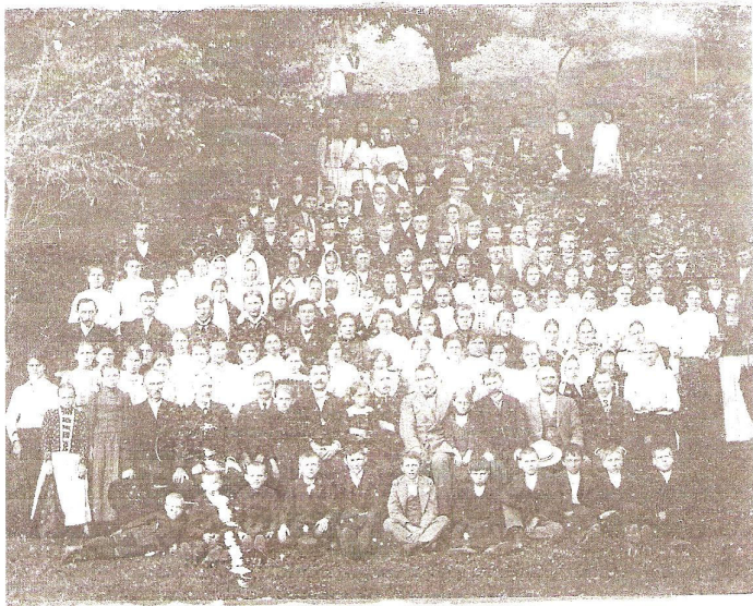
3. Nejstarší fotografie huslenského sboru