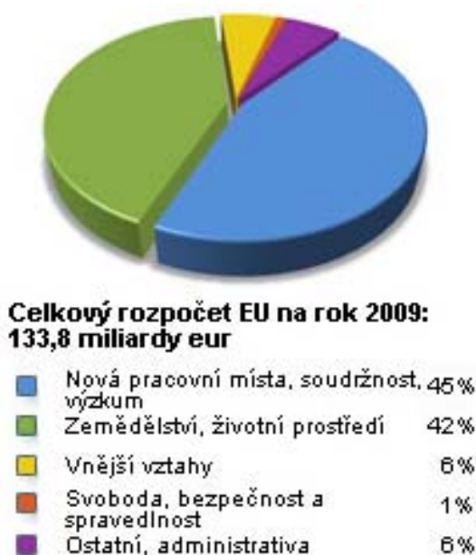
Obrázek č. 1 – Kam směřují peníze z rozpočtu EU