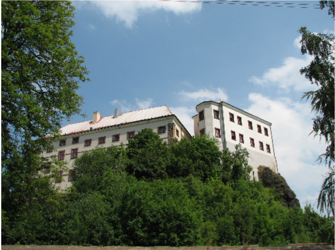
7. Zámek Milešov, nejreprezentativnější sídlo Kaplířů ze Sulevic (stav k roku 2006)