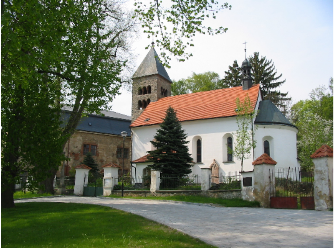
8. Kostel Nanebevzetí Panny Marie a část zámku v Neustupově, předním sídle třebívlické linie Kaplířů ze Sulevic (stav k roku 2006)