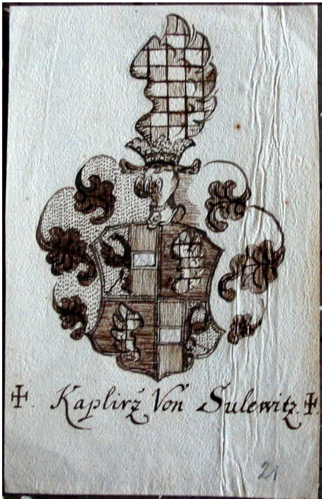
1. Jedno z mnoha vyobrazení erbu Kaplířů ze Sulevic