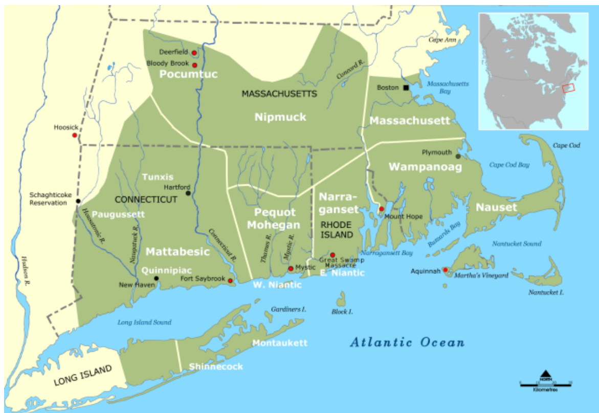
Příloha č. 2: Mapa znázorňující oblast kolem Plymouthu s vyznačeným územím jednotlivých okolních kmenů. [online] in: https://enlablo.wordpress.com/2018/11/28/wampanoag-language-spotlight/