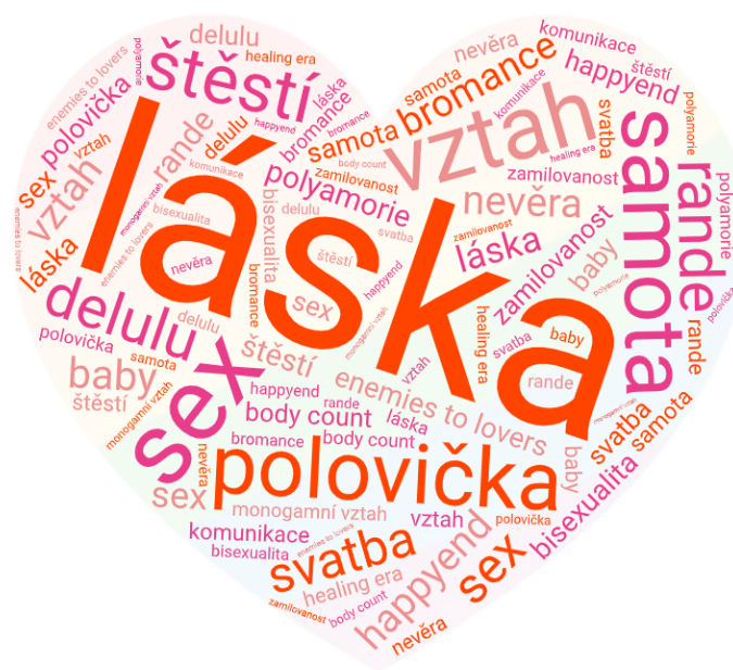
Obrázek 1 Slovní mrak – vztahy

Cílem lekce bylo otevřít téma milostných vztahů; prostřednictvím recepce populárně naučného textu (vybraných 5 kapitol z knihy Vztahy a mýty ) a následného sdílení se spolužáky dostali žáci možnost zamyslet se nad svými názory na vztahy, nad tím, jak je ovlivňuje okolí, a co sami od partnerských a přátelských vztahů očekávají. Žáci byli vedeni k uvědomění si vlastních hodnot, hranic a potřeb ve vztazích. Žáci měli příležitost setkat se s knihou v roli zdroje relevantních informací.