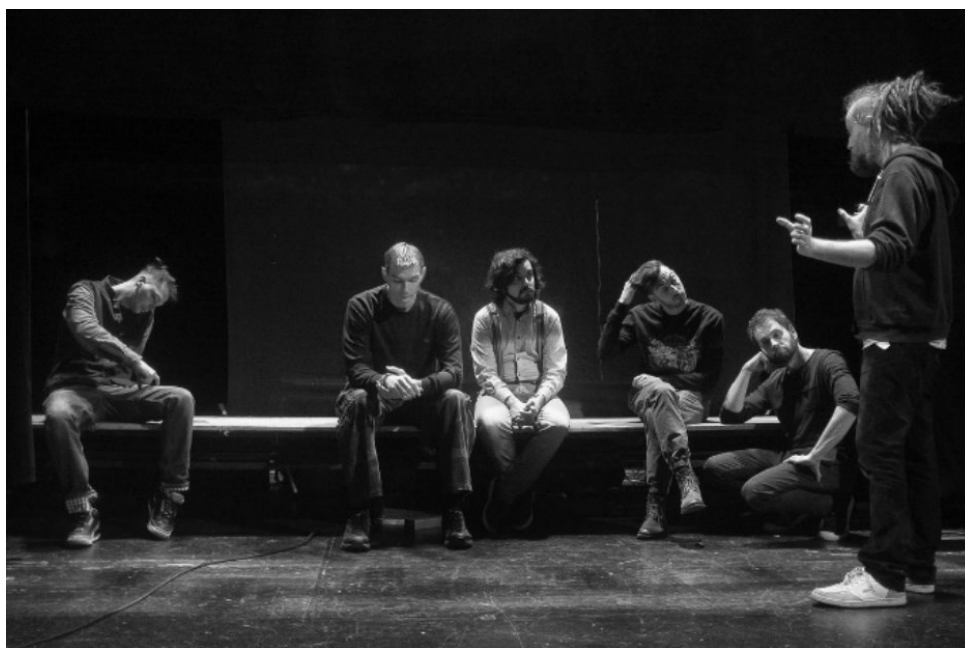
Obr. č. 5. (Hanke, 2018)

Hankeho snímek zobrazuje a klade důraz na kolektiv pracovníků divadla Spejbla a Hurvínka v moment vysvětlování při zkoušce. Na snímku lze pozorovat rozdílné emoční rozpoložení pracovníků a jejich zájem o dané téma. Hanke pro zachycení této fotografie využívá krátkého času závěrky, díky kterému není pohyb postav rozmazán, dále pro ostrost snímku využil autor nejspíše ostřící bod ve středu fotografie, díky kterému jsou postavy na okrajích fotografie lehce rozmazány 10 . Vzhledem k tomu, že není zřetelné přílišné zrnění, můžeme předpokládat, že pro snímek nebyla využita příliš vysoká hodnota ISO.