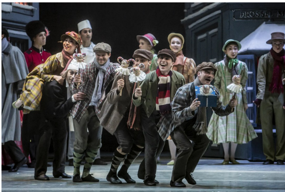
Obr. č. 8. (Divíšek, 2017)

Příkladem takové fotografie focené z hledišťe může být například právě snímek Divíška z baletního představení Louskáček – Vánoční příběh.