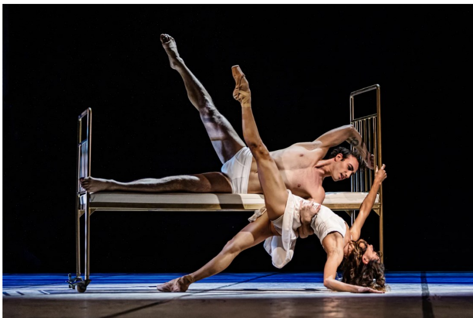
Obr. č. 2. (Hejný, 2022)

Jako příklad snímku zachycující konkrétní divadelní inscenaci je přiložena fotografie taktéž fotografa Baletu Národního divadla Pavla Hejného. Přestože je Hejný znám především pro své reklamní fotografie, je také dlouholetým fotografem právě Baletu ND. V rozhovoru pro ČT ART tvrdí, že fotit pohyb je jako učit se cizí jazyk. Zdaleka to není jen o tom podívat se do hledáčku a najít něco hezkého, ale jde o to napojit se na ten pohyb a hudbu a cítit, jak kulminuje, pak jde teprve poznat, kdy zmáčknout spoušť (Hejný, 2022). Vybraný snímek pochází z divadelní inscenace Tramvaj do stanice Touha , která měla premiéru v roce 2022. 4