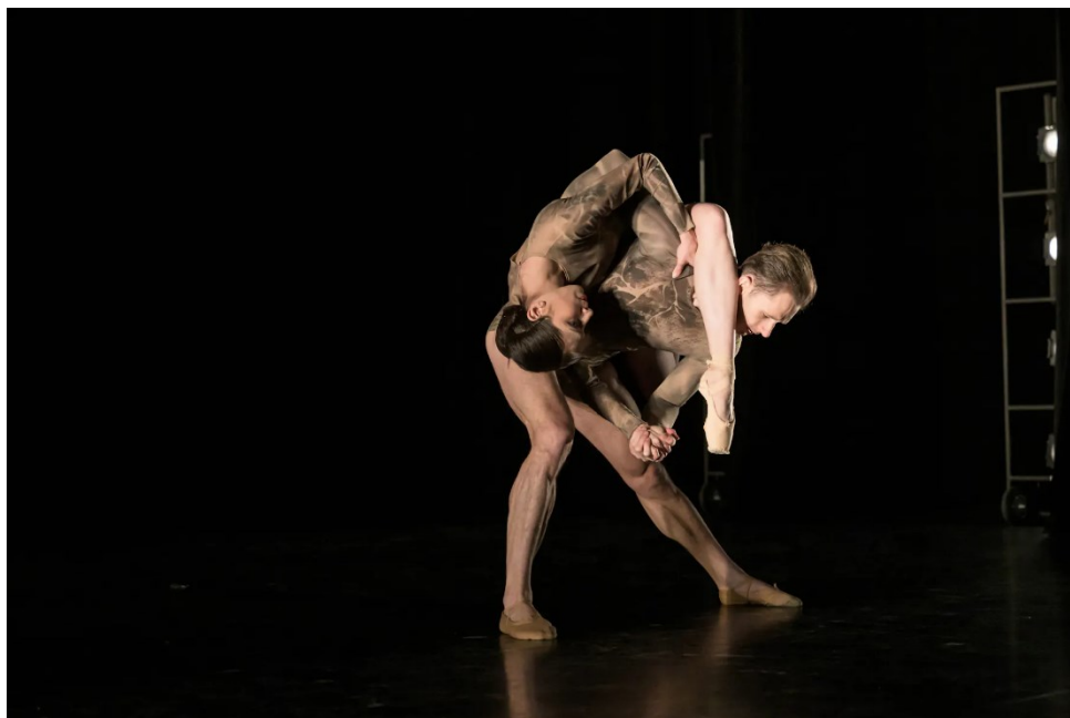
Obr. č. 7. (Gherciu, 2023)

který odkrývá v pravé části snímku část zákulisí. Jak říká Divíšek v našem rozhovoru (2024), tak snímky blízko herců nemusí být vždy tak čisté jako snímky na zoom objektiv z hlediště, mají však zcela jiný náboj.