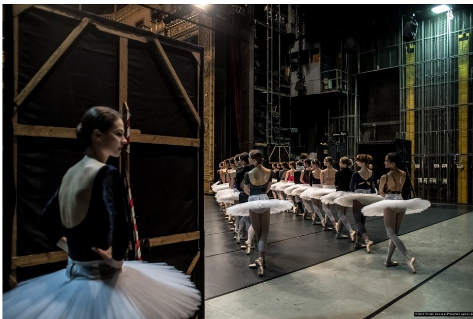
Obr. č. 6. (Divíšek, 2019)