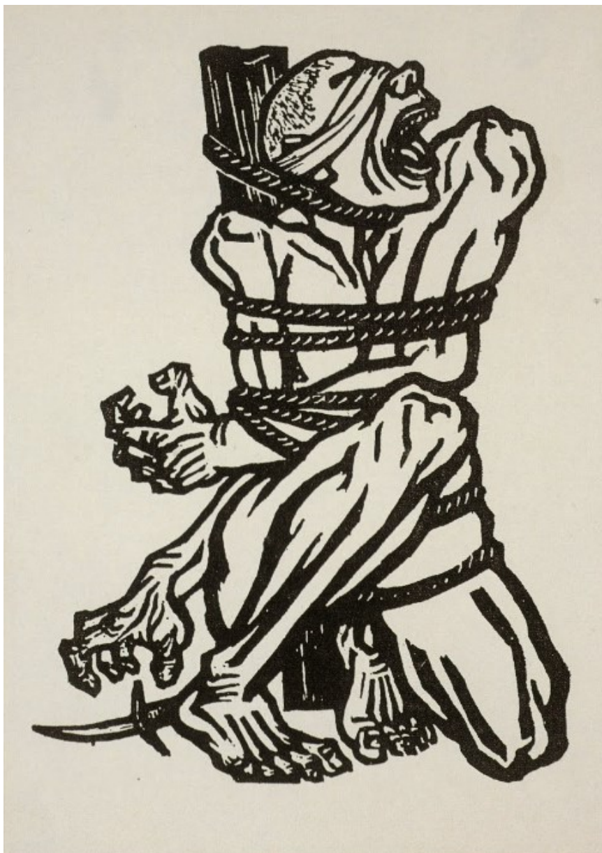
Obrázek 4: Zařvi, Číno!