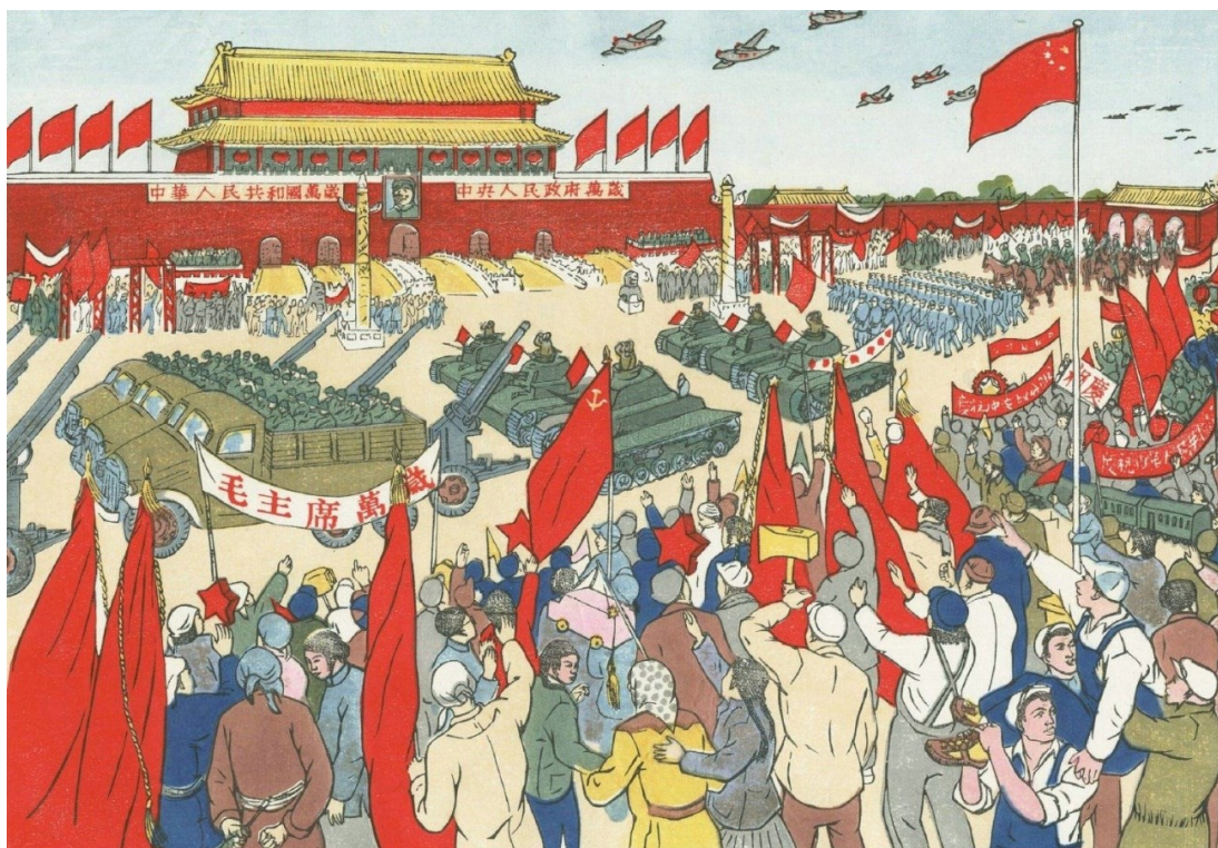
Gu Qun, Oslava založení Čínské lidové republiky