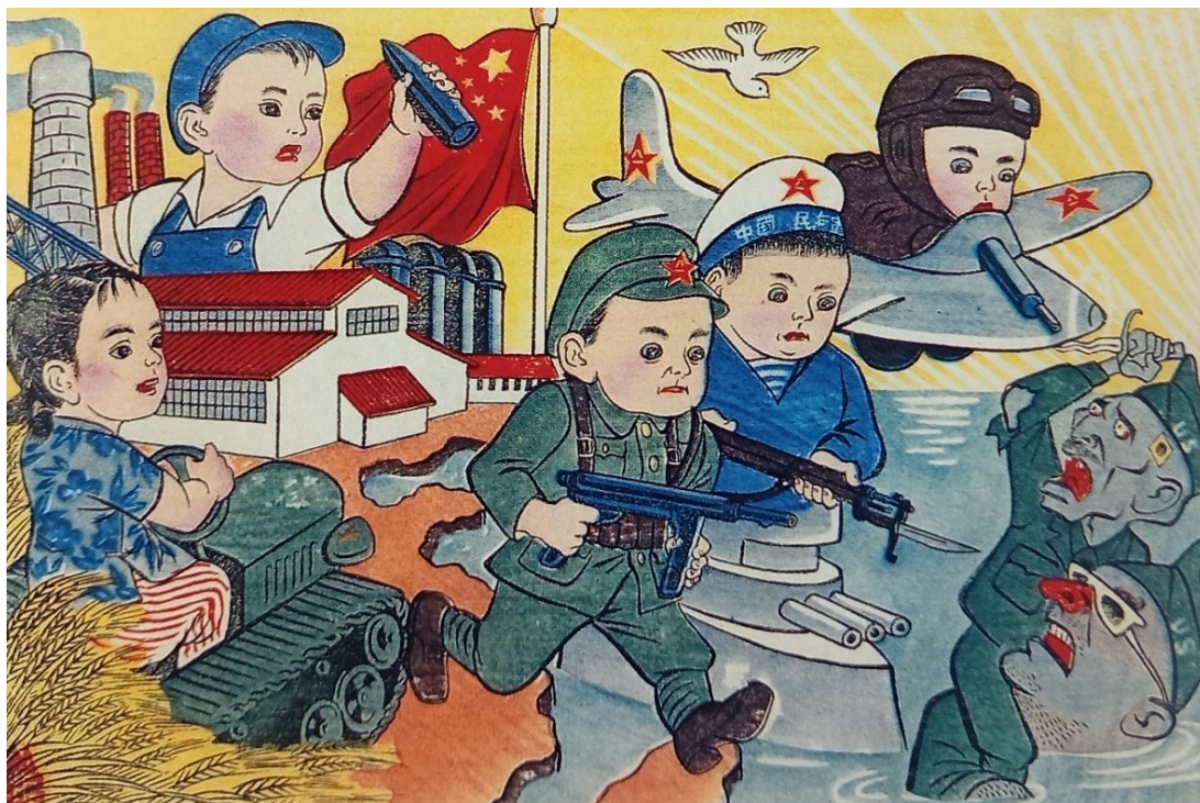
Obrázek 9: Děti Nové Číny