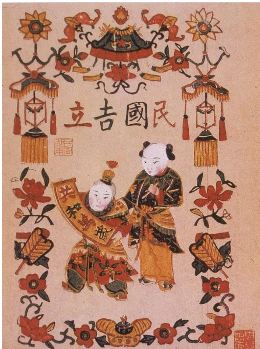
Obrázek 1: Příznivé založení republiky