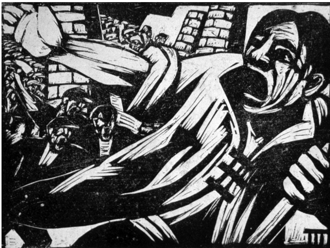
Hu Yichuan, Do přední linie!