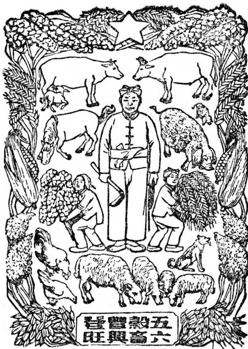
Obrázek 7: Novoroční obrázek