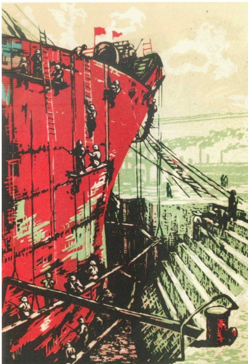
Shen Roujian, V loděnici ( New Chinese woodcuts 1959, s. 13)