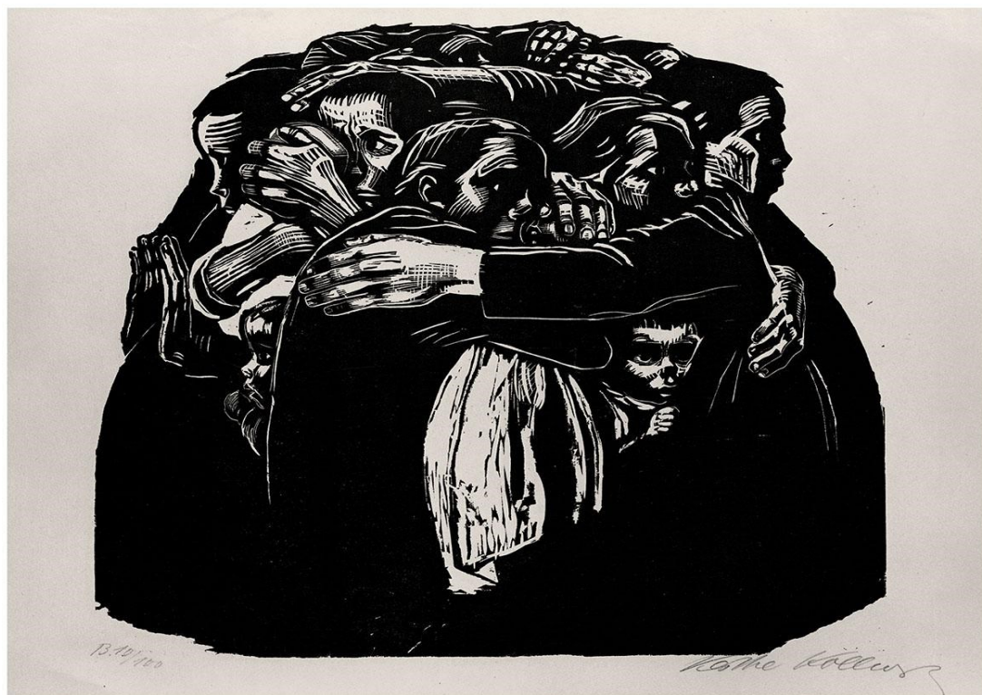
Obrázek 2: Matky