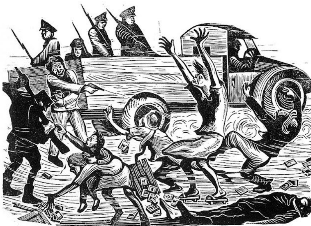
Huang Rongcan, Hrůzná inspekce (Hrdlička 1949, s. 47)