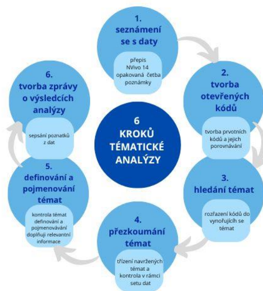
Schéma 1. Schéma postupu tematické analýzy. Adaptováno pro účely této práce z Brumovská a kol. (2022)

Braun a Clarke (2006) proces vytváření tematické analýzy rozdělují do šesti fází. Nejedná se o lineární postup, práce postupuje v iterativních cyklech, kdy se jednotlivé fáze navzájem prostupují. Zdůrazňují, že ve své podstatě se kódování vyvíjí a definuje v průběhu celého procesu analýzy. Ve své práci jsem na základě těchto šesti pospaných fází postupovala od seznámení s daty (fáze 1), přes revizi kódu (fáze 3) po definování a pojmenování témat (fáze 5). Celý proces probíhal s pomocí mezinárodně uznávaného softwaru k analýze kvalitativních dat QSR NVivo 14.