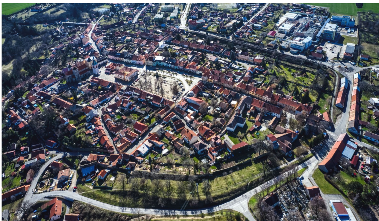
Obrázek 5 – Dnešní podoba Kouřimi 386