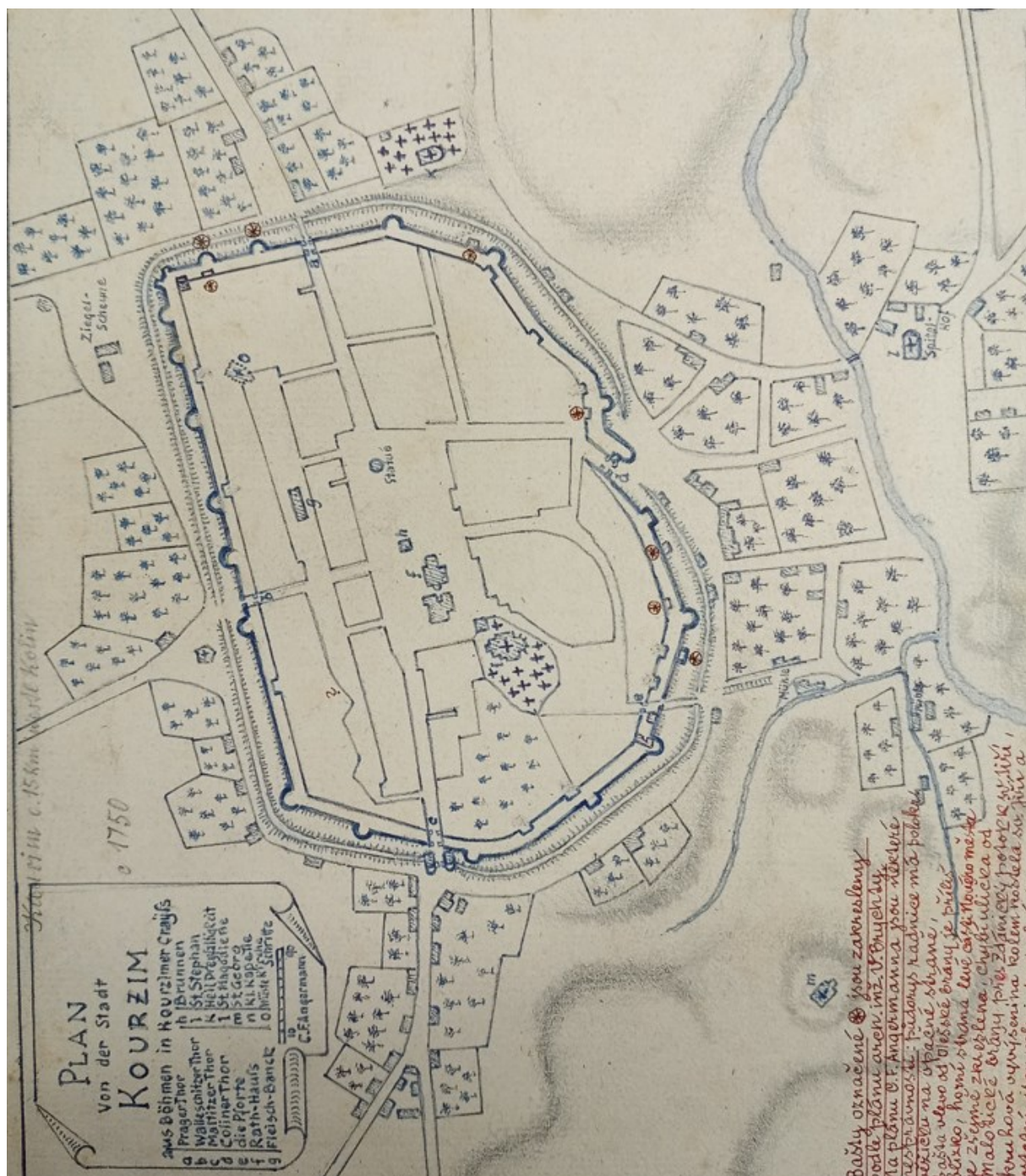
Obrázek 1 – Kopie plánu města Kouřim z poloviny 18. století, autor B. Svoboda 382