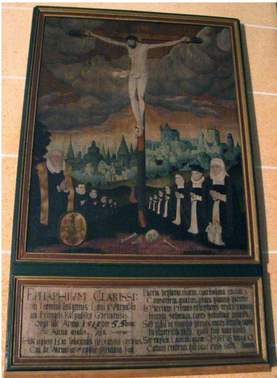
Obrázek 3 – Epitaf Jana Lána z Varvažova, řezníka a královského rychtáře 384