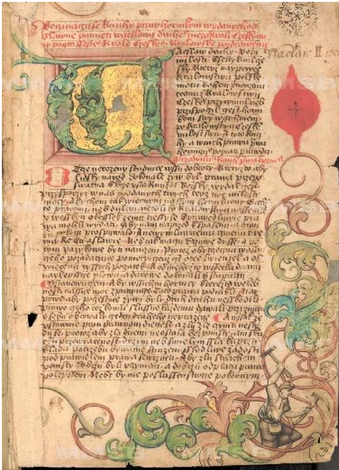
1. Titulní strana rukopisu „Jus regale montanorum aneb právo královské horníkuov“ z roku 1528, fond Národní knihovny ČR, sign. MS XVII D 43.