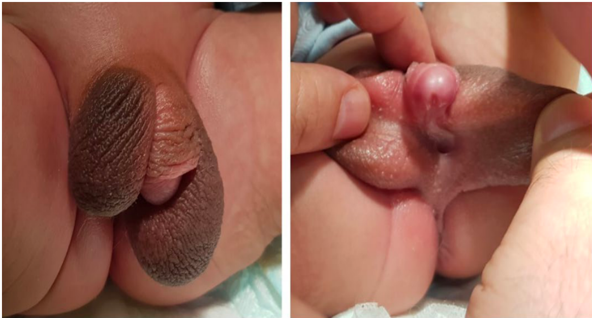
Obrázek 5 - Vnější genitálie novorozeného pacienta 46,XY DSD (mutace v genu MAP3K1 ). Penis o délce 3 cm, hypospádie a varlata v šourku (Al Shamsi et al., 2020).