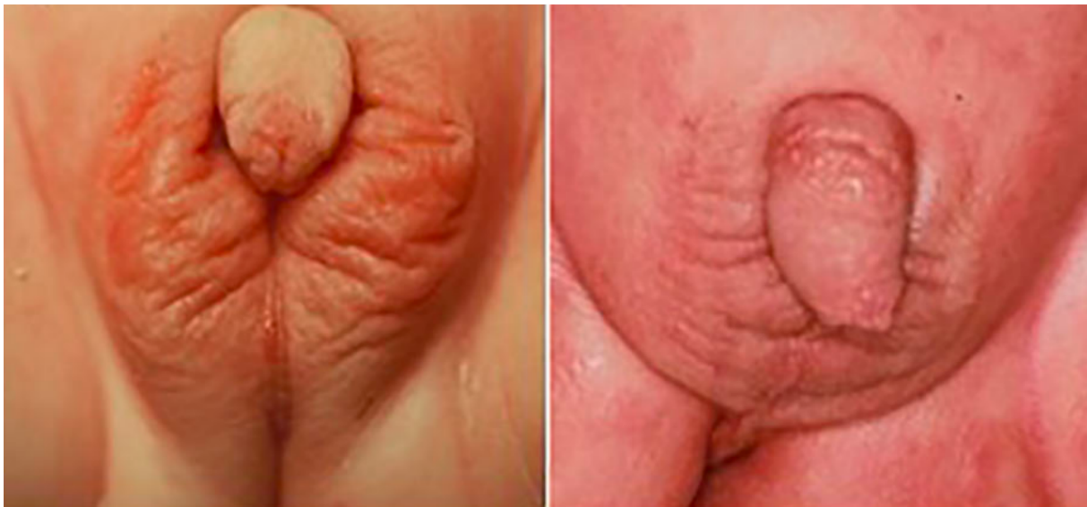
Obrázek 6 - Vnější genitálie pacientů 46,XX DSD s CAH způsobenou deficitem 21-hydroxylázy. Genitálie pacienta vlevo odpovídají třetímu stupni Praderovy stupnice. Genitálie pacienta vpravo odpovídají pátému stupni Praderovy stupnice (Finkelstain et al., 2021).